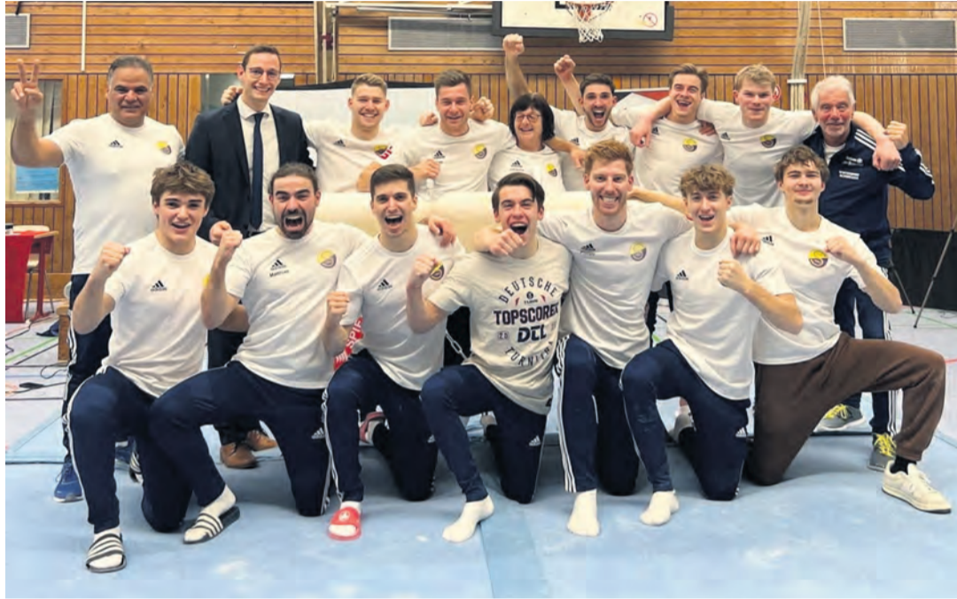
Es ist geschafft: Nach einem nervenaufreibenden Relegationsduell gegen die TSG Grünstadt turnt der Stadtturnverein Singen ab nächster Saison wieder in der 1. Bundesliga.