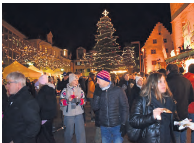
Der große Weihnachtsbaum auf dem Marktplatz zeigt den Christkindlemarkt bereits von Weitem sub-Bilder: Achim Holzmann

Zwischen Ständen mit süßem Weihnachtsgebäck, edlen Weinen, handgefertigtem Schmuck und kunstvollen Krippenfiguren blieb kaum ein Wunsch offen. Besonders die Vorführung des Glasblasens, bei der funkelnde Weihnachtskugeln entstanden, zog zahlreiche staunende Blicke an. Auch das Schneeflockengewinnspiel der Aktionsgemeinschaft Radolfzell e. V. und das interaktive Winter-Erlebniskino sorgten für leuchtende Augen bei Groß und Klein. Achim Holzmann