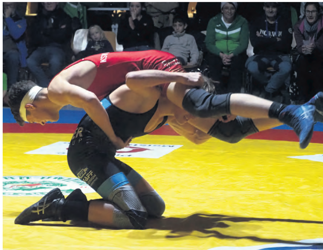
Eine deftige Niederlage musste der KSV Gottmadingen beim vergangenen Heimkampf gegen Angstgegner Triberg hinnehmen.

zunehmend besser wurde, blieb die Offensive der Schlüssel zum Erfolg. Trotz eines dezimierten Kaders zeigten die Herren eine konzentrierte Leistung. Besonders hervorzuheben ist die gute Verteidigung gegen den siebten Feldspieler der Gastgeber, ein taktisches Mittel, das der TuS trotz knapper Wechsoptionen diszipliniert löste. Die Mannschaft schaffte es, die Führung konsequent auszubauen. Auch wenn die Gastgeber immer wieder versuchten, über Tempogegenstöße heranzukommen, hatte der TuS meist die passende Antwort parat. Am Ende stand ein beeindruckender 44:35-Sieg auf der Anzeigetafel, der die offensive Stärke der Mannschaft unter Beweis stellte. Mit den eingefahrenen Punkten festigt der TuS Steißlingen seine Position im Mittelfeld. Pressemeldung