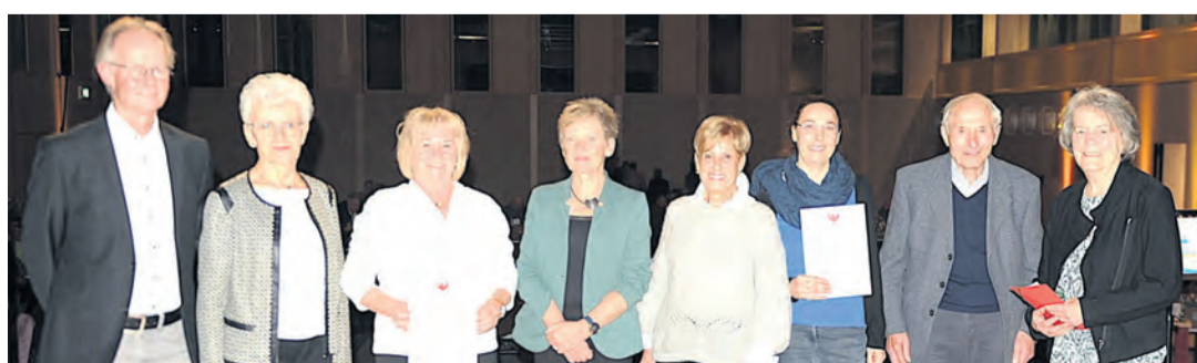
Die Organisatoren der Veranstaltung blickten auf 40 Jahre AHR zurück. Mit dabei waren auch viele Ehrungen, die an diesem Abend ausgezeichnet worden sind.