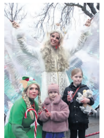
Für besondere Momente beim Adventszauber sorgte der Engel.

Unterhalten wurden sie alle von dem Bläserensemble der Jugendmusikschule Westlicher Hegau. Marcelino Rüth