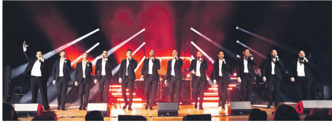
The 12 Tenors – Song of Eternity am Dienstag, den 30. Dezember um 20:00 Uhr in der Stadthalle, Hohgarten 4 in Singen. Begleitet von einer Live-Band und umrahmt von einer spektakulären Lichtshow zelebrieren die 12 Tenöre die Vielseitigkeit der Musik in all ihren Facetten. Weltberühmte Arien treffen auf Rock- und Pophymnen, eine Allianz von charismatischen Stimmen formiert sich zu einem beeindruckenden Ensemble und 12 Top-Solisten verschmelzen in ihrer Virtuosität und Leidenschaft zu einer fulminanten Einheit. Weitere Infos unter www.stadthalle-singen.de

■ Biedermann und die Brandstifter Schauspiel von Max Frisch – »Die Darstellung eines durchschnittlichen Bürgers, der ein etwas schlechtes Gewissen hat ... und der ein gutes haben möchte, ohne irgendetwas zu verändern.« so Max Frisch. Mi., 19:30 Uhr.