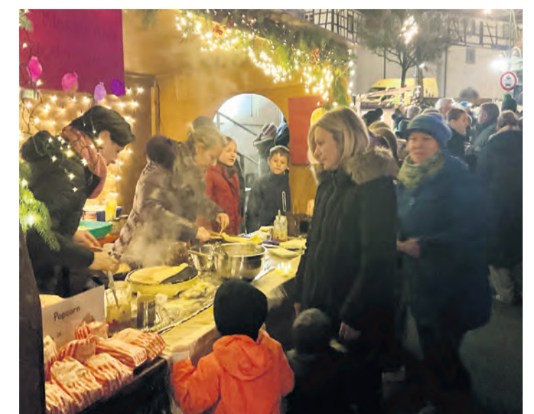
Es weihnachtete wieder an allen Ecken und Enden nahe der Steißlinger Torkel zum traditionellen Weihnachtsmarkt.