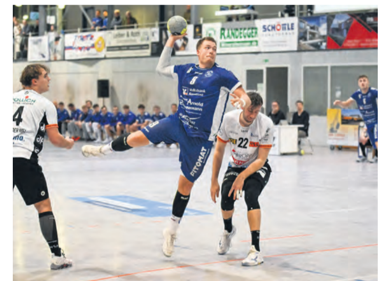
Einen am Ende verdienten Sieg konnten die Herren 1 des TuS Steißlingen beim TSV 1899 Blaustein feiern.

Steißlingen. Wichtiger Erfolg für die Herren 1 des TuS Steißlingen. Die Handballer bezwingen den TSV 1899 Blaustein in einer temporeichen Partie mit 44:35.