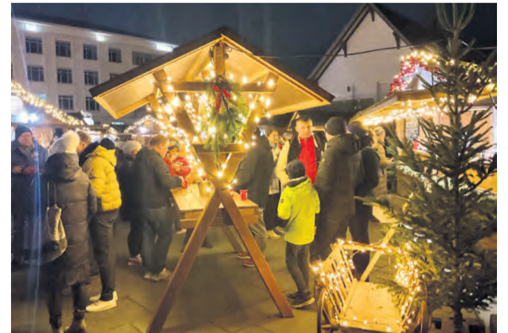
Es tut sich etwas auf dem Rathausplatz in Singen. Der Weihnachtsmarkt hat wieder geöffnet.

Singen. Seit dem 4. Dezember lockt der Singener Weihnachtsmarkt wieder Besucherinnen und Besucher auf den festlich illuminierten Rathausplatz, angeleitet und eingangs begrüßt von einem zauberhaft geschmückten und imposanten acht Meter hohen Weihnachtsbaum.