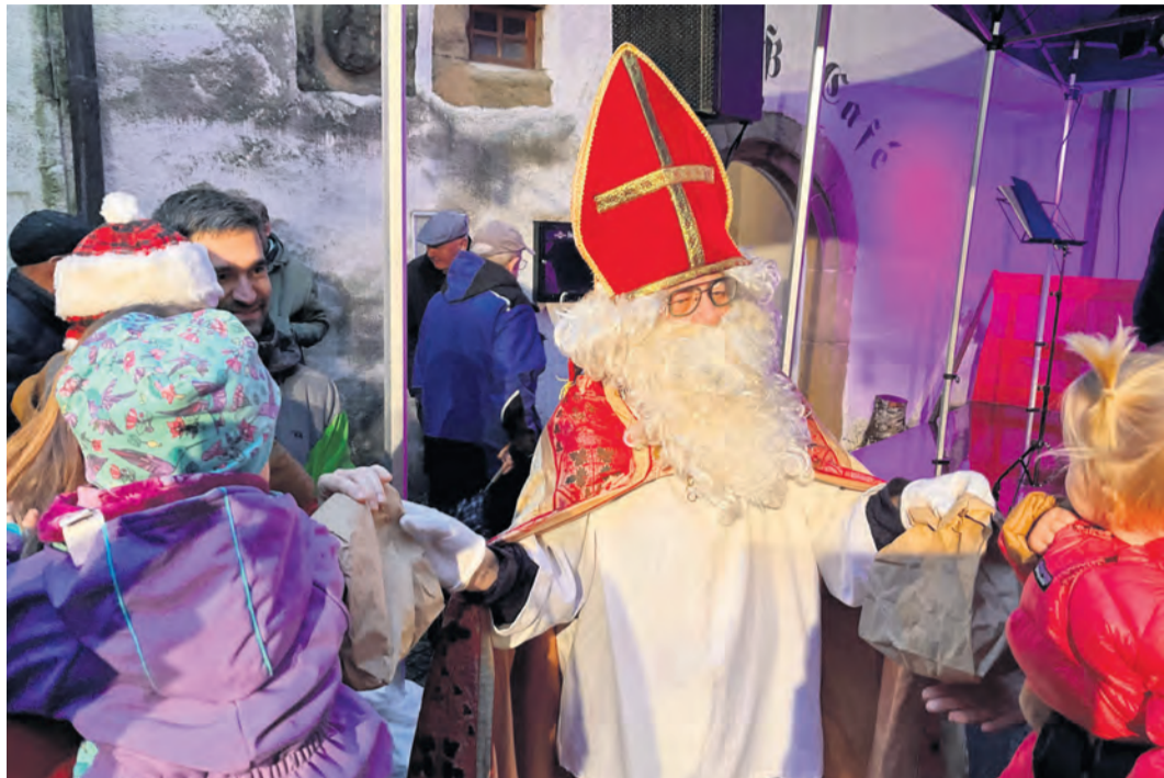
Auch der Nikolaus war an der Schlossweihnacht anwesend und hat so manche Kinderaugen zum Staunen und Strahlen gebracht.

Tengen-Blumenfeld. „Wir haben Schnee in aufgetauter Form.“ Der leichte Nieselregen tat der Stimmung indes keinen Abbruch: Auf dem Kirchplatz, im Schlossgarten, vor und hinter dem Torbogen und auf dem festlich illuminierten Schlosshof tummelten sich Generationen von heimischen und nachbarlichen Besucherinnen und Besuchern, ließen sich an den Ständen und Pavillions lokaler Vereine verwöhnen und erfreuten sich am vielfältigen Kunsthandwerksmarkt. Das Bläserquartett St. Agatha aus Hausen an der Aach spielte stimmungsvoll zur Vorweihnachtszeit auf, gefolgt von der X-Mas-Combo mit schwungvollen Stücken rings