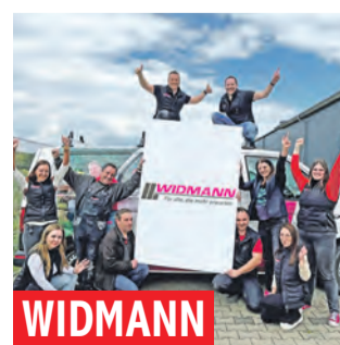
Das Team von WIDMANN freut sich auf die Leistungsschau 2025.

Wer wir WIDMANN? Ein familiengeführtes Unternehmen im Bereich Heizung, Sanitär, Klimaanlage, bei dem Service wird bei uns ganz großgeschrieben. Seit 98 Jahren ist der Sanitär Spezialist ein verlässlicher Partner.