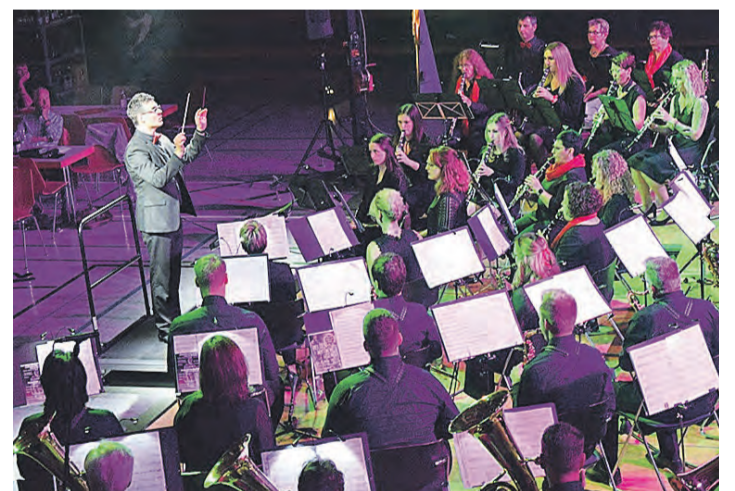
Auch in diesem Jahr lädt die Musikkapelle Ehingen wieder ein zum Benefizkonzert – diesmal unter dem Motto „Klang der Berge.“