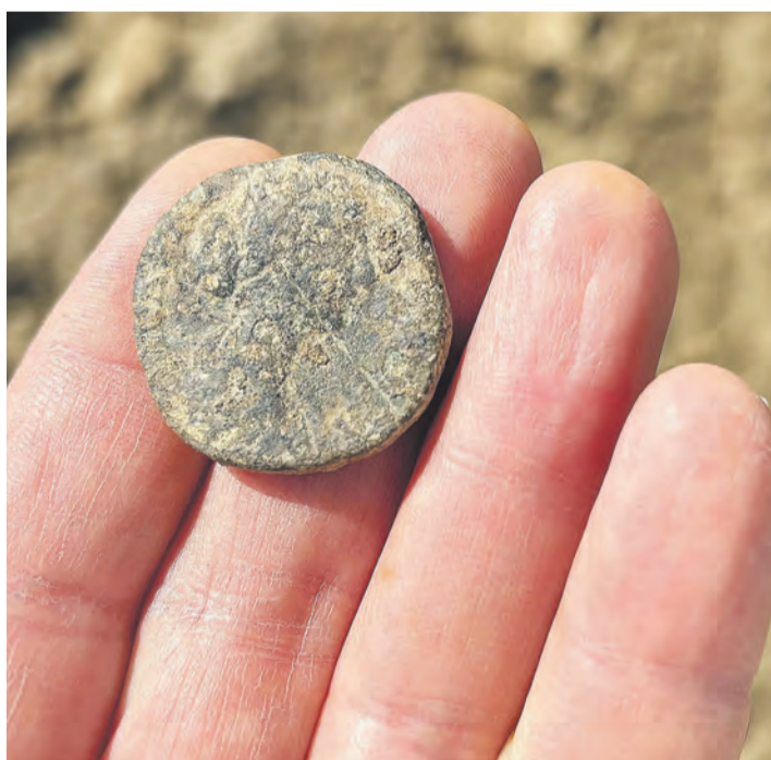
Römische Bronzemünze aus der aktuellen Ausgrabungsstätte in Bodman-Ludwigshafen mit schwach erkennbarem Frauenporträt (vermutlich Ende 2. Jh. n. Chr.).

In der etwa 260 Quadratmeter großen Baufläche zeichnen sich über 100 Einzelfundstellen als Verfärbungen im sandigen Untergrund ab. Es handelt sich dabei meist um Fundamentgruben für Holzpfosten, die das tragende Gerüst der damaligen Häuser mit Flechtwerkwänden und vermutlich Strohdach bildeten. Im Gewirr