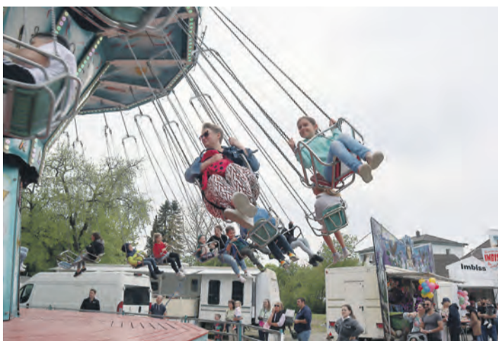
Auch in diesem Jahr wird der Festplatz vor der Fahrkantine wieder in einen kleinen Rummel verwandelt.