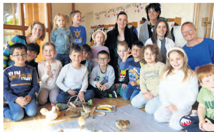
Die Vorschüler im Kinderhaus St. Raphael und die Erzieherinnen lernen wie Leben entsteht.