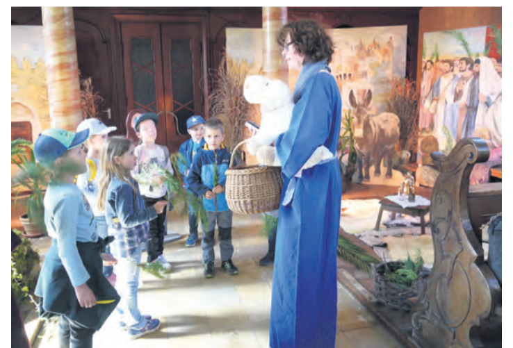
Alles zum Osterfest lernten die Kinder des KiGa Anselingen kürzlich im Ostergarten Tengen.