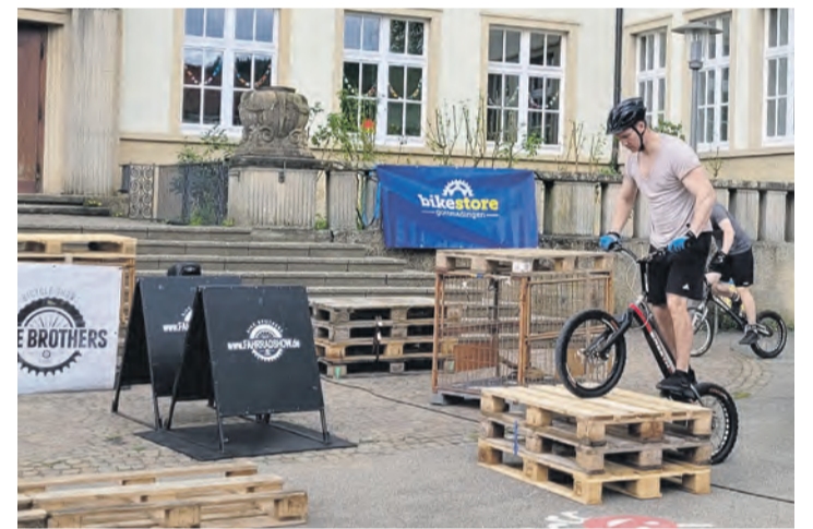
Eine kleine, dafür aber spektakuläre Stuntshow wird allen Besuchern von den Bike Brothers auf dem Platz der Hebelschule versprochen.

Der Gottmadinger Frühjahrsmarkt zählt schon seit vielen Jahren traditionell zum Veranstaltungskalender der Stadt und genießt bei Jung und Alt große Beliebtheit. Egal ob bunten Treiben mit verschiedenen Fahrgeschäften über zahlreiche Verkaufsstellen, Essens- und Kunsthandwerkerstände bis hin zum lokalen Handel - hier ist für jede Generation etwas dabei.