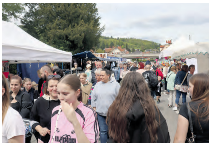
Am 26. und 27. April lockt der Frühjahrsmarkt in Gottmadingen wieder zahlreiche Besucher zum frühlinghaften Bummel in die Gemeinde.