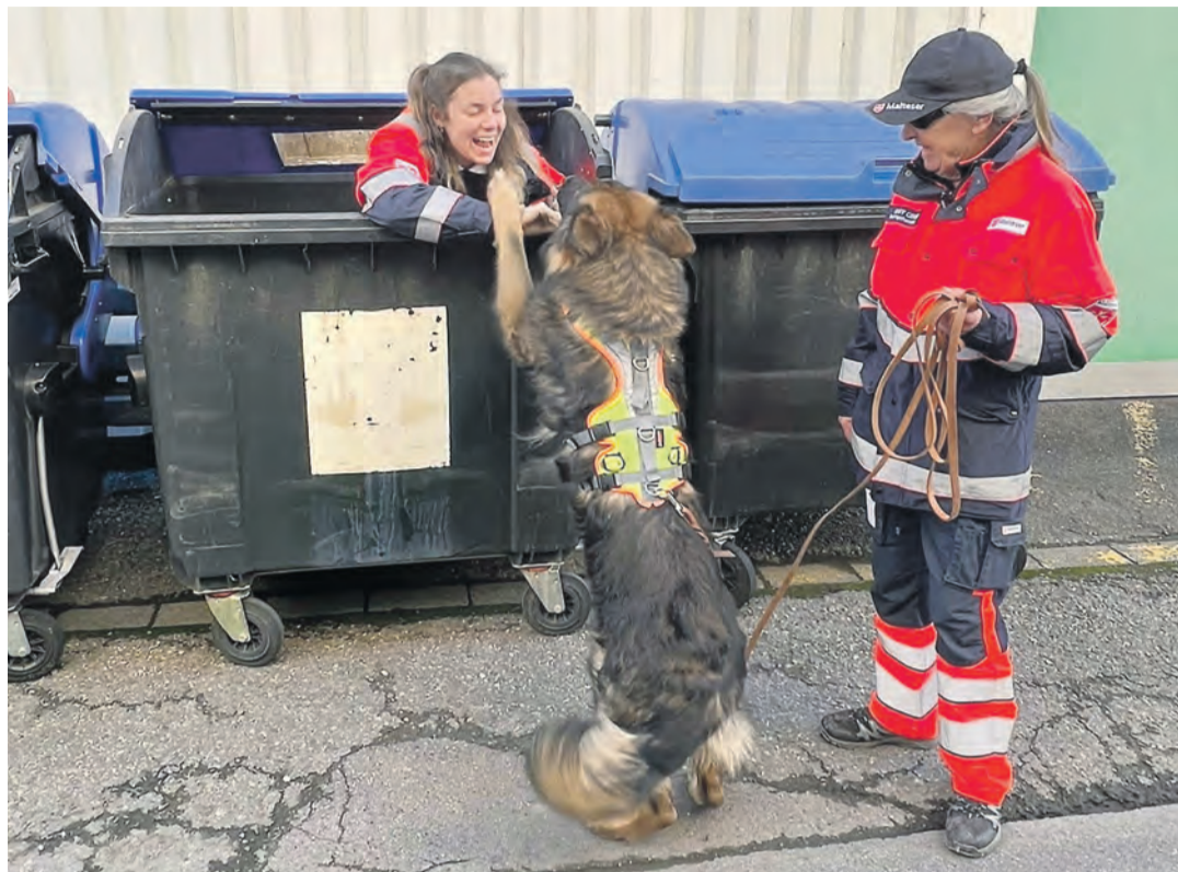
Mantrailer, wie sie in der Rettungshundestaffel der Malteser Singen eingesetzt werden, konzentrieren sich auf den individuellen Geruch einer bestimmten Person.

Nicht jeder Einsatz führt zum Erfolg. „Natürlich sind wir erleichtert, wenn eine Person vorher gefunden wird. Aber wir hatten auch schon Funde.“ Jeder Hinweis zählt – selbst wenn die Spur zu einer Bushaltestelle führt. „Wenn die