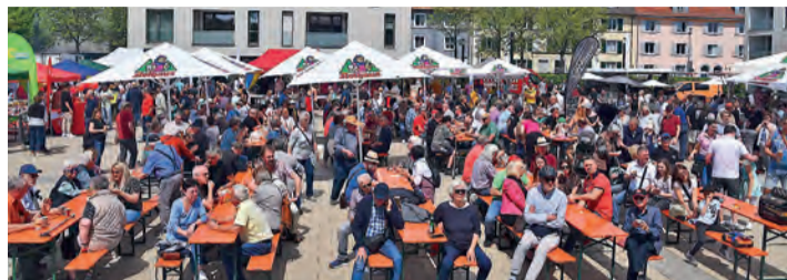
Zum vierten Mal ist Groß und Klein zum Familienfest am Maifeiertag eingeladen.