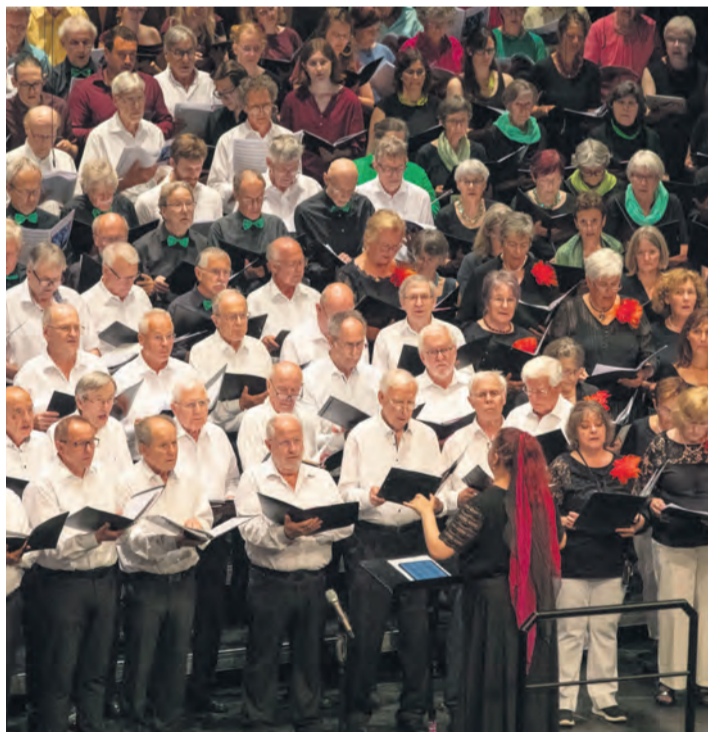
Sieben Chöre teilen sich beim grandiosen Abschluss von „Singen grenzenlos“ die Bühne.