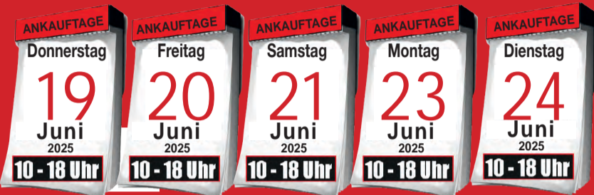
Ankauf von Krokotaschen

BARES FÜR WAHRES - DIE EXPERTEN SIND FÜR SIE VOR ORT