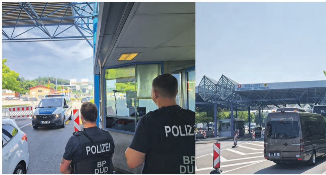
Beamte der Bundespolizei kontrollieren Fahrzeuge am Grenzübergang zwischen Thayngen und Bietingen.