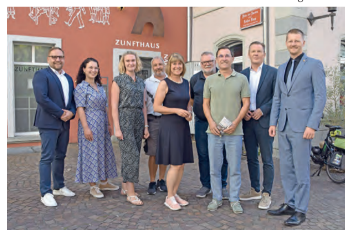
Die Beteiligten freuen sich schon auf viel Musik, Besucher und gute Stimmung beim 47. Radolfzeller Altstadtfest am 6. September.