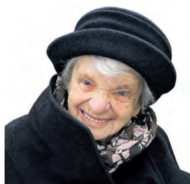
Heudorf i. Heg.