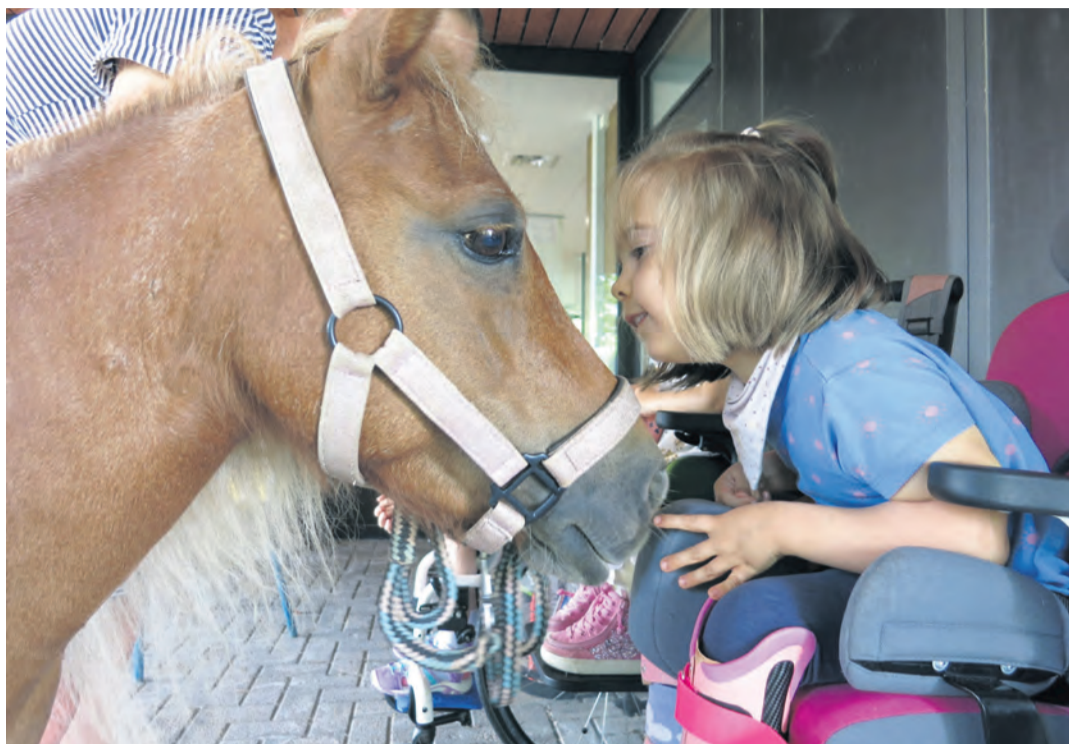
Über eine tierische Begegnung durften sich die jungen Patienten des Hegau-Jugendwerks freuen.