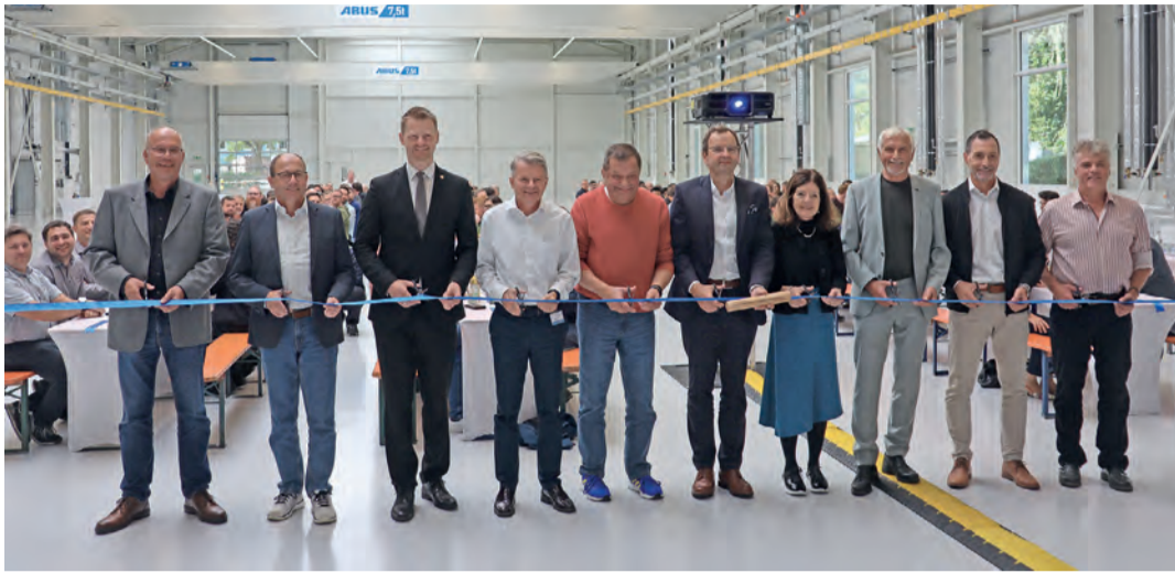
Mit dem symbolischen Durchschneiden des Bandes wurde der OPTIMA-Anbau offiziell eröffnet.