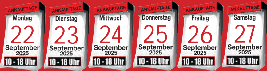
Ankauf von Krokotaschen

BARES FÜR WAHRES - DIE EXPERTEN SIND FÜR SIE VOR ORT