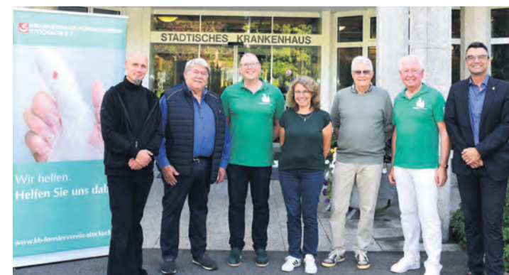
Über eine Spende in Höhe von insgesamt 1.000 Euro durfte sich der Förderverein des Krankenhauses Stockach freuen.