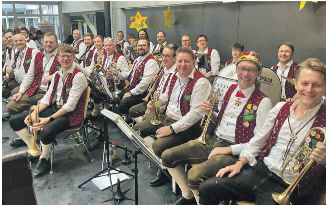
100 Jahre jung: Narrenmusik der Narrizella Ratoldi 1841 e.V. zu deren Männerfrühschoppen am Dreikönigstag in der FHG-Aula eingeladen wurde.