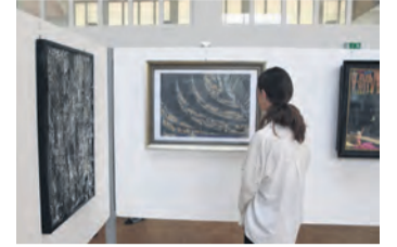
Für die Ausstellung »Aus den ateliers am See« werden Exponate gesucht.

warum Nenzingen kein Luftkurort aber vielleicht ein Bad Nenzingen werden könnte oder dass, laut Schild, auf dem Friedhof ein Klettergerüst entstehen sollte.