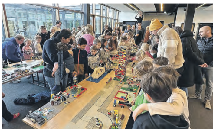
Beim Projekt »Legostadt« errichteten die Schülerinnen und Schüler der Grundschule der CSH gemeinsam eine Stadt aus Lego-Steinen.

Hilzingen. Kürzlich verbandelte sich die Grundschule der Christlichen Schulen im Hegau in eine kreative Baustelle: Beim Projekt »Legostadt« errichteten die Schülerinnen und Schüler gemeinsam eine Stadt aus Lego-Steinen. In mehreren Bauphasen entstanden Häuser, Geschäfte, Polizeistationen, Sportstätten und viele weitere Gebäude, die nach und nach zu einer lebendigen Stadt zusammenwuchsen. Gearbeitet wurde in kleinen Gruppen. Die Kinder überlegten gemeinsam, welche Elemente zu einer Stadt gehören, planten ihre Bauwerke, teilten Aufgaben auf und unterstützten sich gegenseitig. Dabei wurden nicht nur Kreativität und Feinmotorik gefördert, sondern auch soziale Kompetenzen wie Teamarbeit, Kom-