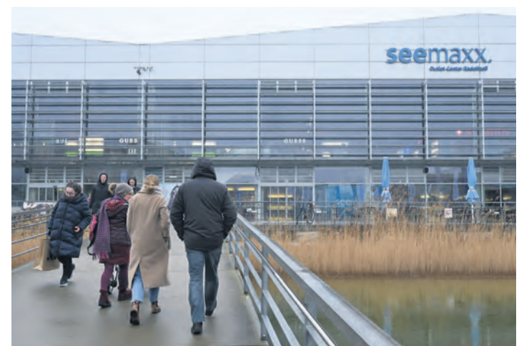
Das Seemaxx ist Konkurrenz und Ankerpunkt zugleich für die Innenstadt. Nun soll dort das Sortiment erweitert werden.