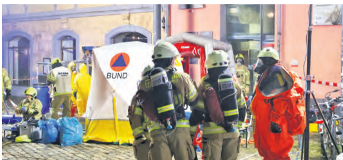
Die ersten Feuerwehrkräfte betreten das Gebäude mit Atemschutzmasken.