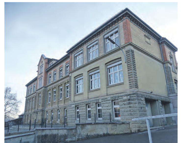
Die Grundschule Zizenhausen soll wieder zu einer eigenständigen Schule werden. Der Gemeinderat Stockach stimmte dem zu.