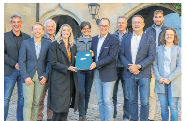
Mit der Vertragsunterzeichnung ist das Windpark Schindelwald einen Schritt voran gekommen.

Bau von Windkraftanlagen im Schindelwald mit der finalen Vertragsunterzeichnung aller Beteiligten. Die vorgesehene Fläche von etwa 120 Hektar befindet sich ausschließlich im Waldgebiet. Rund 23 Prozent werden von der Gemeinde Mühlingen und rund vier Prozent der Fläche von Neuhausen ob Eck zur Verfügung gestellt. Der größere Anteil der Flächen liegt im Staatswald von ForstBW. Das Projekt wäre auch ohne die Flächen der Gemeinden umgesetzt worden. Doch durch die Einbringung der gemeindlichen Flächen, vergrößert sich der Windpark sinnvoll und die Gemeinden erbringen so auch einen Anteil an den Flächenvorgaben des Landes zur Umsetzung der Klimaziele. Pressemeldung