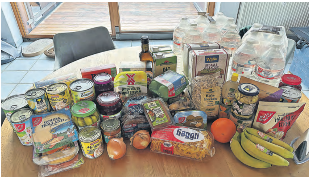
Ein Lebensmittelvorrat, der sich an der Empfehlung und Beispiele des Amtes für Bevölkerungsschutzes orientiert. Damit soll sich eine Person zehn Tage lang versorgen können.

Singen. Eine jüngst veröffentlichte Umfrage von YouGov zeigt: Nur etwa die Hälfte der Deutschen hat einen Notvorrat für mindestens drei Tage angelegt. Empfohlen wird gar ein Lebensmittelvorrat, der zehn Tage lang hält. Das stellt einen Haushalt unter Umständen vor Herausforderungen bei Kauf und Lagerung. Ein Beispieleinkauf für einen