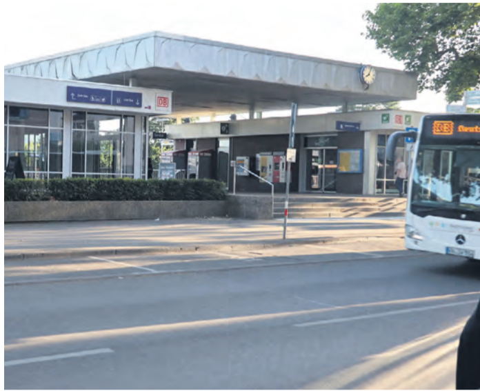
Westlich des Hauptbahnhofs plant die Stadt ein Fahrradparkhaus, um den Umstieg vom Rad auf die Züge zu erleichtern. Der Hauptbahnhof selbst soll 2027 umgebaut und modernisiert werden.

Das Gebäude ist westlich des Hauptbahnhofs geplant, das für das Parkhaus abgerissen werden soll. Für das Gebäude muss laut Wacker aber eine Anlagenerfassung auf Restbestände von Bauwerkstechnik durch Mitarbeiter der Deutschen Bahn durchge-