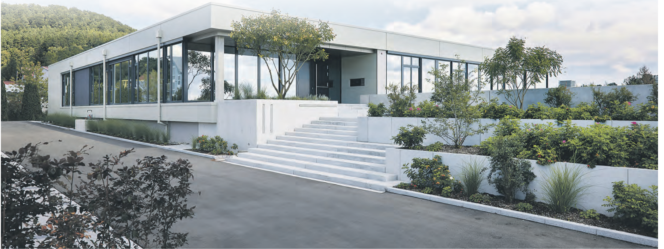
Zorn Maschinenbau lädt am 18. April zu einem Tag der offenen Tür ins neue Produktionsgebäude im Himmelreich ein.