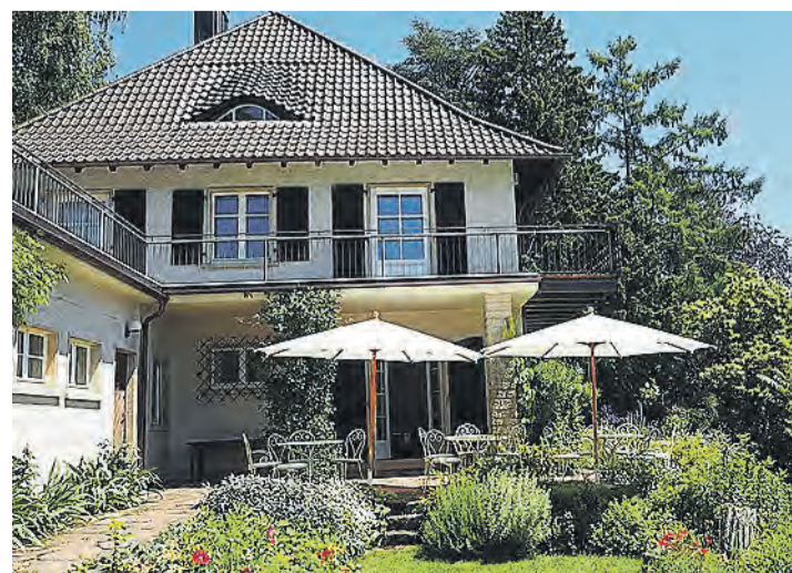
Auch das Museum Haus Dix in Gaienhofen hat in der Saison 2026 einiges im Programm.