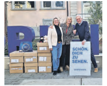
Die Beteiligten freuen sich sehr über die Spende für das Frauenhaus.

50.000 Euro Reparaturkosten angefallen waren, hätten nun für die Richtung des Antriebs wieder 13.000 Euro eingesetzt werden müssen. So entschied man sich für eine Neuanschaffung. Es zeigte sich aber, dass durch die Einhaltung aller vorgeschriebenen Abläufe, die Beschaffung vom Landesverband nicht vor 2028 erfolgen wird. So wurde vorübergehend ein kleineres Ersatzboot angeschafft, welches nun so umgerüstet wird, dass es 2028 wieder verkauft werden kann. Dessen Bootstaufe kann dann schon am 15. Mai 2026 stattfinden. Trotz Einnahmenverlust zeigte der Kassenbericht, dass der Verein finanziell auf gesunden Füßen steht. Damit dies auch so bleibt, sah sich die Vorstandschaft gezwungen, die Mitgliedsbeiträge moderat zu erhöhen. Dieser Antrag wurde genauso einstimmig angenommen, wie auch die Wahl Max Blazej zum Technischen Leiter Boot und Fahrzeuge.