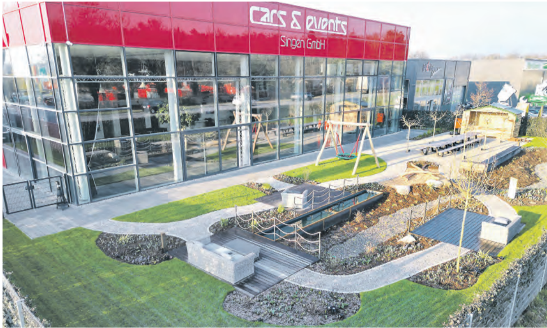
Feiern, die in Erinnerung bleiben - das bietet die neue Eventlocation cars & events Singen GmbH in der Josef-Schüttler-Straße 6 an.