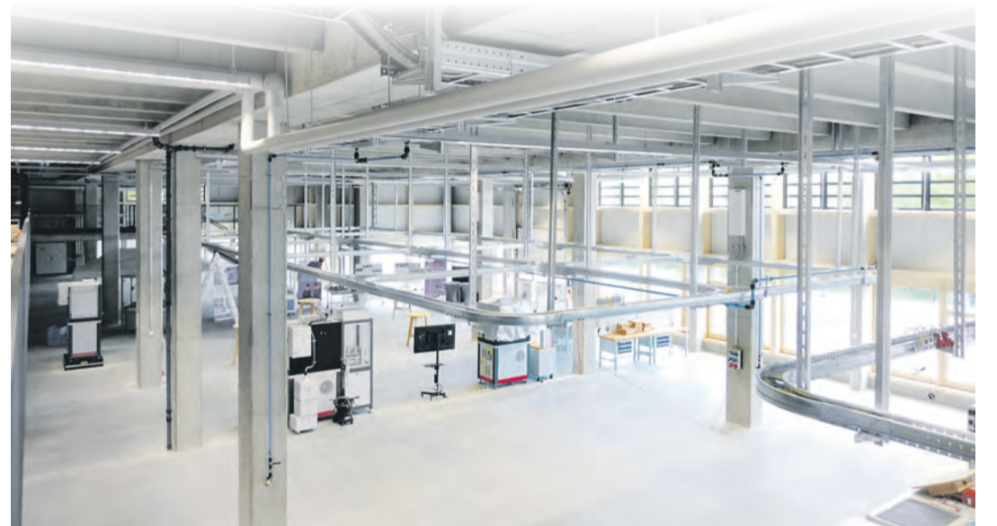
Beim Tag der offenen Tür erhalten Besucher erstmals Gelegenheit, einen Blick hinter die Kulissen zu werfen.