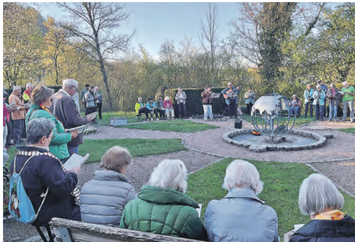
Zahlreiche Gläubige aus Singener Kirchengemeinden hatten sich zur ersten Andacht 2026 im idyllisch gelegenen, bereits 2000 anlässlich der Landesgartenschau angelegten »Garten der Schöpfung« eingefunden.

Singen. Sechs umpflanzte Granitstelen und eine große Erdkugel in der Mitte zieren ein mit Bänken, Kieswegen und Grünstreifen umsäumtes Rund. Ein großes Holzkreuz an der Roseneggstraße, die vom Krankenhaus Richtung Kleingartenanlage führt, markiert nach der Überquerung der Bahnlinie rechterhand den Zugang zu diesem magischen Ort, der alternativ auch über die Fußwege hinter den Tennisanlagen erreicht werden kann. Von April bis Oktober