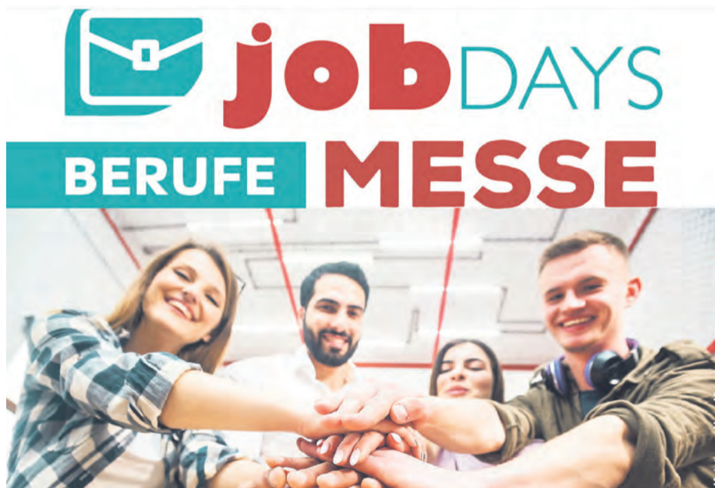
Bei den jobDAYS gibt es auch in diesem Jahr Gelegenheit, Berufe kennenzulernen und mit potenziellen Arbeitgebern ins Gespräch zu kommen.

Schon in dieser WOCHENBLATT-Ausgabe ist eine Beilage zu dieser Berufsmesse mit vielen Informationen von und über regionale Arbeitgeber zu finden. Auch einen Messeplan gibt es wieder, in dem alle Aussteller verzeichnet sind. So bleibt ausreichend Zeit, sich vor den jobDAYS zu informieren und sich vorzubereiten. Denn die Auswahl ist wie gewohnt groß.