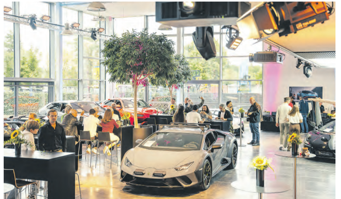
cars & events Singen versteht sich vielmehr als wandelbare Eventlocation für Unternehmen und Veranstalter, die ihren Events einen besonderen Rahmen geben möchten.

Feiern, die in Erinnerung bleiben - das ist der Anspruch der neuen Eventlocation cars & events Singen GmbH in der Josef-Schüttler-Straße 6. Mit einem Tag der offenen Tür am Sonntag, den 19. April, von 11.00 bis 17.00 Uhr lädt das Unternehmen alle Interessierten ein, die Location hautnah kennenzulernen und sich von dem besonderen Konzept zu überzeugen.