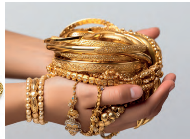
Ankauf von Goldschmuck