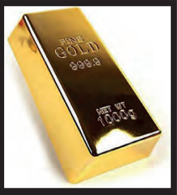
Ankauf Goldbarren Inhaber: W.