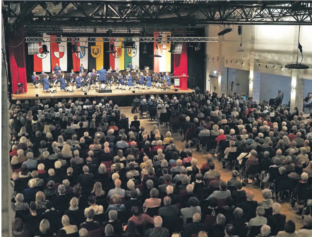
»Neujahrsempfang Radolfzell« am Sonntag, 11. Januar ab 10.30 Uhr, im Milchwerk, Werner-Messmer-Straße 14, 78315 Radolfzell. Auch in diesem Jahr lädt die Stadt Radolfzell dazu ein, gemeinsam auf das neue Jahr anzustoßen. Eröffnet wird der Empfang von Oberbürgermeister Simon Gröger. Im Zeichen des großen, 1.200-jährigen Stadtjubiläums können sich die Gäste in diesem Jahr auf ein ganz besonderes Überraschungsprogramm freuen: Ein spannender Beitrag über Radolfzell wird für beste Unterhaltung sorgen. Musikalisch wird der Empfang von der Stadtkapelle Radolfzell 1772 e. V. umrahmt. Ein weiterer Höhepunkt ist der eigens komponierte Jubiläumssong, der hier erstmals vorgestellt wird. Freier Eintritt. Weitere Informationen unter www.radolfzell1200.de .

STADTTHEATER SCHAFFHAUSEN www.stadttheater-sh.ch Telefon: 0041 / 52 625 05 55