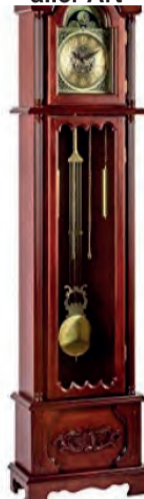
Ankauf von Uhren aller Art

ACHTUNG! Letzter Aufruf für Pelze vor Saisonschluss. Die Nachfrage ist groß, wir zahlen bis zu 8.500 €