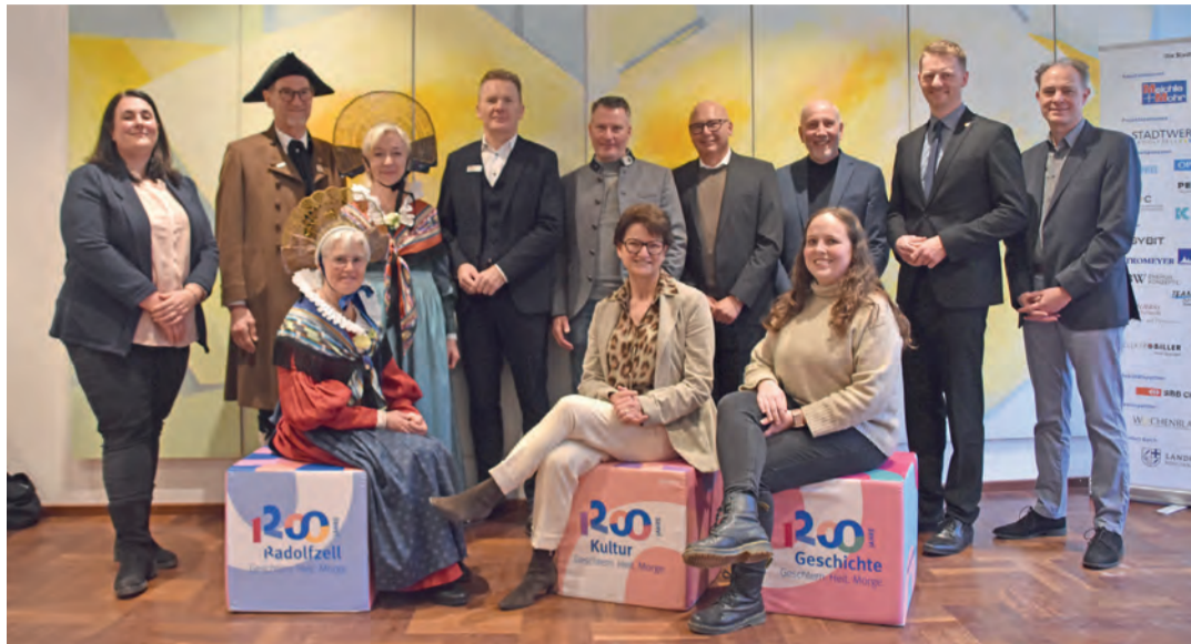
Die Beteiligten und Hauptsponsoren des Zeller Stadtjubiläums freuen sich über den erfolgten Startschuss zu 1200 Jahren Radolfzell.

»Dieses Jubiläum ist ein gemeinsames Fest mit allen für