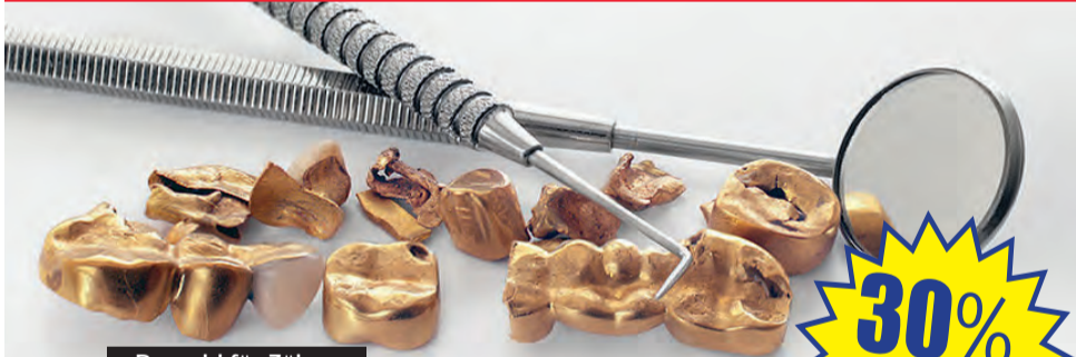
Bargeld für Zähne