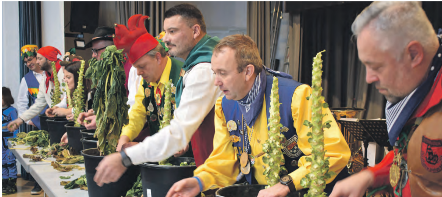
Zur Ermittlung der Umzugsreihenfolge beim Höriumzug musste ein stattlicher Rosenkohlstock in Rekordzeit abgerntet werden.

Im Mittelpunkt des Vormittags standen gleich zwei emotionale Schwergewichte der Hörifasnacht: die Verabschiedung eines Höripräsidenten und die heiß ersehnte Auslosung der Umzugs-