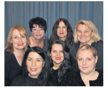
Der Verein Frida - Frauen für Frauen lädt zur zweiten Ladies Night.