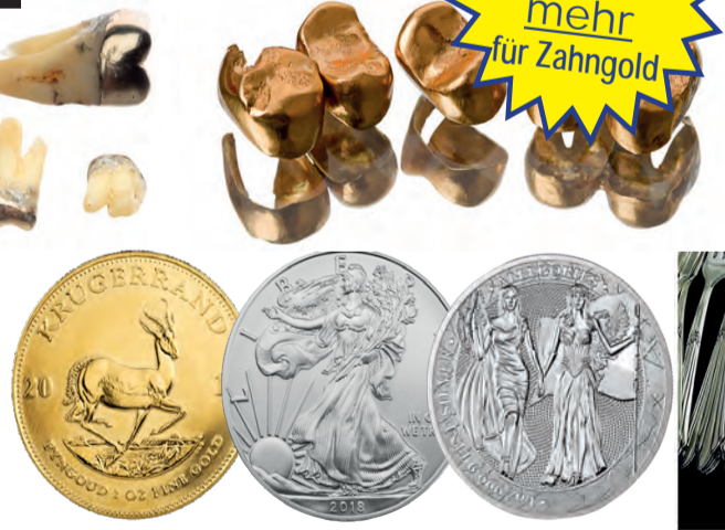
Ankauf von Münzen

GOLD SCHMUCK ANKAUF bis zu 128 € pro Gramm