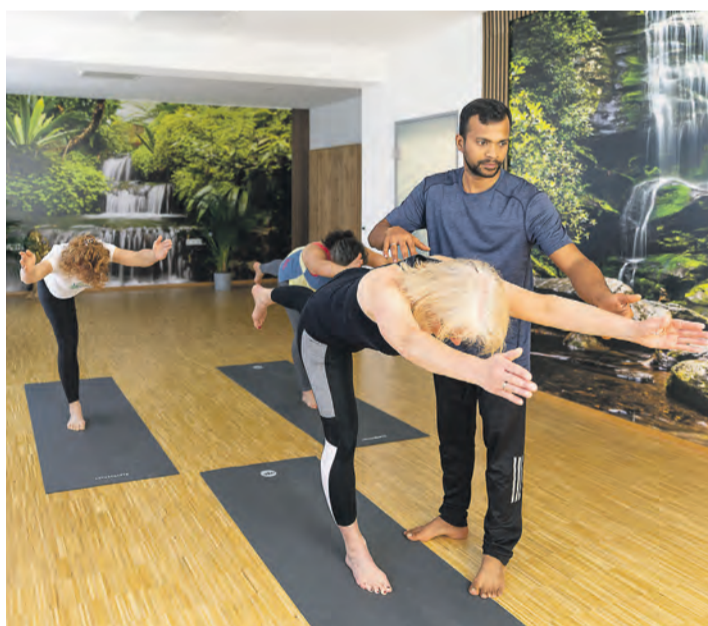
Yogakurs bei Yoga Arc.

Künftig plant Yoga Arc, rund 44 Yogastunden pro Woche in beiden Räumlichkeiten, die nur wenige Minuten voneinander entfernt zu erreichen sind. Damit gehört das Yogastudio zu den Anbietern mit dem umfangreichsten Kursprogramm in der Region. Auf dem Plan stehen unterschiedliche Kurse – von ruhigen Einsteigerkursen bis hin zu fordernden Einheiten für Fortgeschrittene. Dazu kommen Angebote mit Schwerpunkten