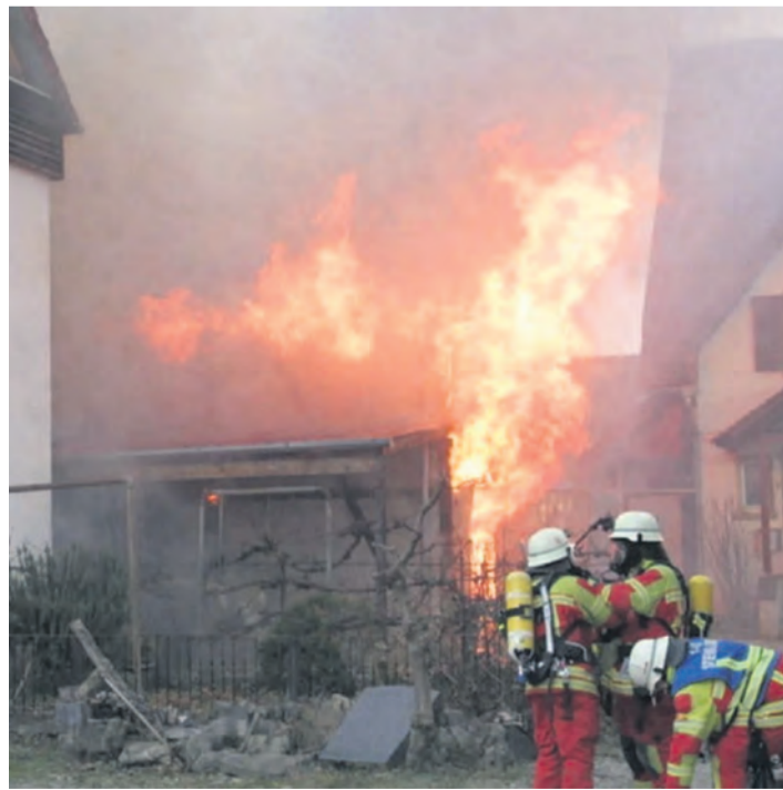
Bei Ankunft der Einsatzkräfte befand sich der Schuppen bereits in Vollbrand.