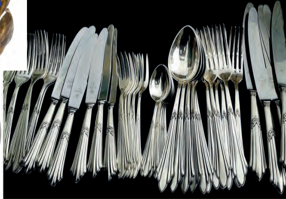
Besteck auch versilbert