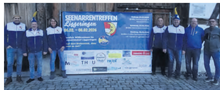
Die Narren freuen sich schon auf das große Seenarrentreffen.