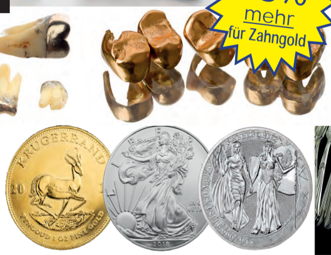
Ankauf von Münzen

GOLD SCHMUCK ANKAUF bis zu 161 € pro Gramm