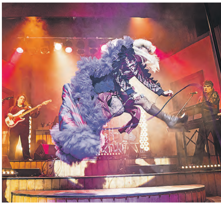
Mit »Hedwig and the Angry Inch« ist seit Ende Februar ein echtes Kultstück aus den 90ern am Theater Konstanz zu sehen.

Das Bühnenbild (Luis Graninger) präsentiert sich im rohen Punk-Ethos. Stroboskoplicht, Instrumente und ein karger Raum schaffen eine Atmosphäre voller Rausch und Energie. Die Inszenierung zieht das Publikum in eine Welt, die zugleich konfrontiert und verwirrt. Die Kostüme betonen Individualität und verweisen zugleich auf die Zugehörigkeit zu einer Subkultur. Getragen wird das Geschehen von der Live-Band mit Rudolf Hartmann, Wolfgang