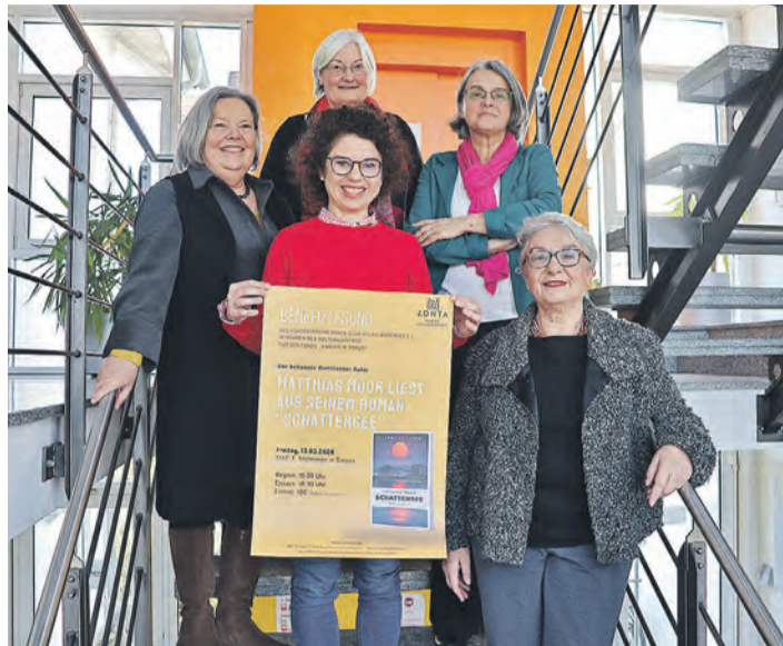
Die Beteiligten des ZONTA-Clubs sowie von der Caritas Singen-Hegau freuen sich auf eine erfolgreiche Benefizlesung.

Der Fonds reagiert auf eine gesellschaftliche Entwicklung, die seit Jahren bekannt ist. Frauen sind deutlich häufiger von Armut bedroht als Männer. Aktuell liegt das Armutsrisiko bei 16,2 Prozent, bei Männern bei 14,7 Prozent. »In