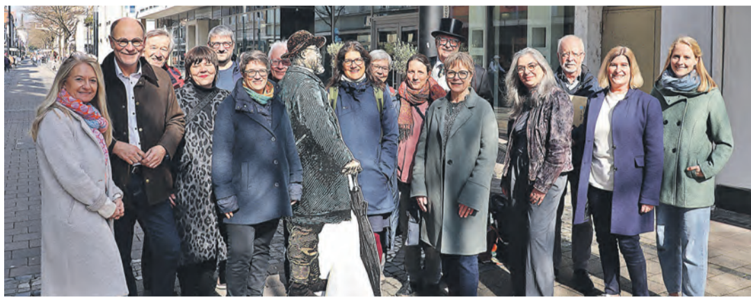
Die Stadt und ihre Kooperationspartner freuen sich auf die bevorstehenden Veranstaltungen zum Jubiläumsjahr. Stellvertretend dafür verkündeten sie das Programm in der Scheffelstraße am Beginn des Scheffelwegs.

Joseph Victor von Scheffel hat seine Spuren in Singen hinterlassen: Die Hadwigstraße, die Ekkehard-Realschule und die Scheffelhalle wurden alle nach ihm oder seinen Werken benannt. Zu dessen 200. Geburtstag feiert die Stadt Singen mit einigen Kooperationspartnern das Jubiläum mit einem breiten Programm seit Donnerstag, 5. März.