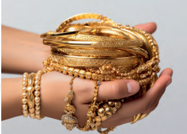
Ankauf von Goldschmuck