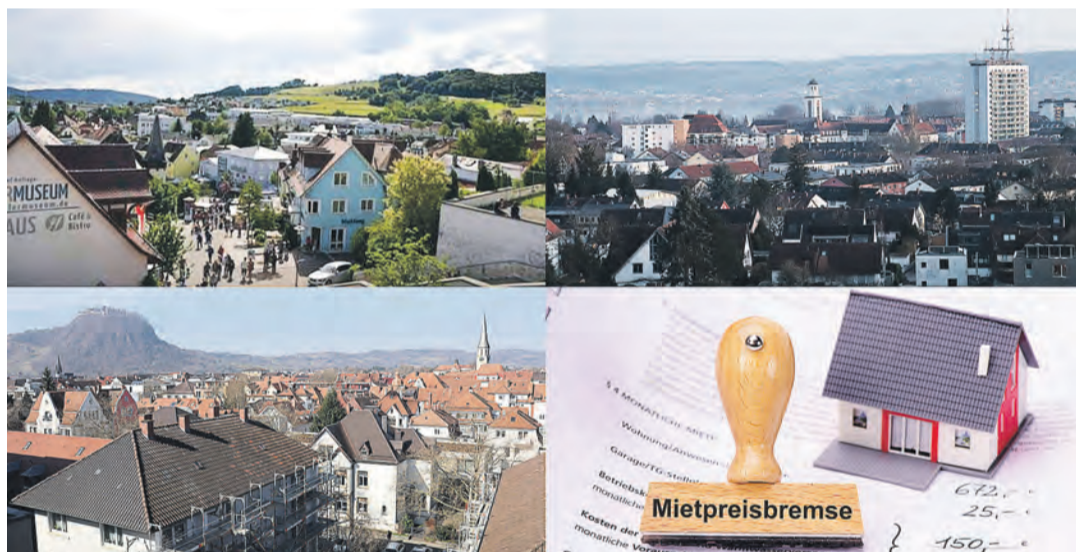
Der Wohnungsbau wird schwieriger in Stockach, Singen und Konstanz.