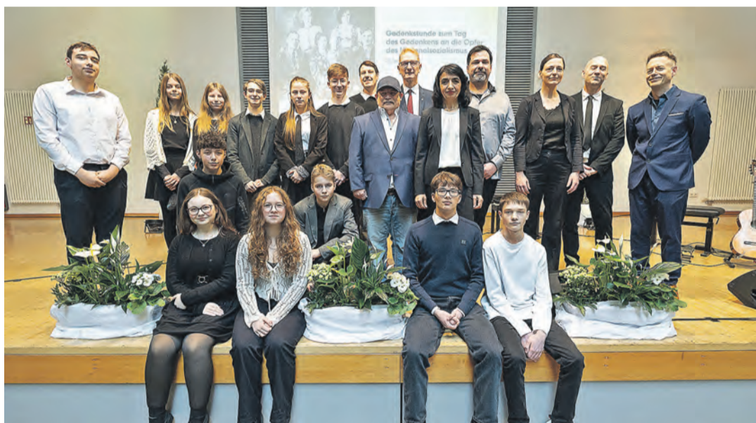
An dem Gedenktag für die Jenischen beteiligten sich auch Schüler aus Singen.