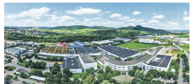
Der vorläufige Sanierungsplan für die ETO Gruppe wurde kürzlich final bestätigt.

Mit der Finanzierungszusage ist der erste Schritt der Sanierung erfolgreich abgeschlossen. Nun richtet die ETO GRUPPE ihren Fokus auf die konsequente Umsetzung und Implementierung der im Sanierungsplan definierten Maßnahmen. Ziel bleibt es, die Wettbewerbsfähigkeit nachhaltig zu stärken und die Transformation langfristig erfolgreich abzuschließen. Pressemeldung