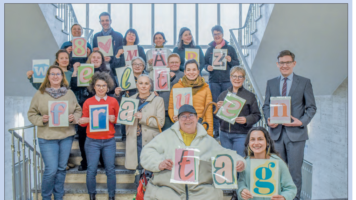
Die Organisatorinnen des Programms zum Internationalen Frauentag sowie alle Beteiligten laden herzlich zur Teilnahme an den diesjährigen Veranstaltungen ein.

Weitere Informationen und die Zusendung des Programmflyers auf Anfrage unter Telefon 07531/800 43 53 und per E-Mail: gleichstellung@lrkn.de integration@singen.de