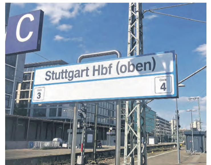
Die Teilbetriebnahme von Stuttgart 21 wurde auf den Dezember 2023 verschoben

Als Schlüssel hierfür sieht das Pro Gäubahn-Landesbündnis den im Rahmen der S21-Teilbetriebnahme vorgesehenen Kombibahnhofbetrieb in Stuttgart. Dieser bietet die Chance, ausreichend Kapazitäten im Bahnknoten Stuttgart zu sichern, die Gäubahn-Kappung dauerhaft zu verhindern und zugleich das bewährte Notfallkonzept für die S-Bahn zu erhalten.