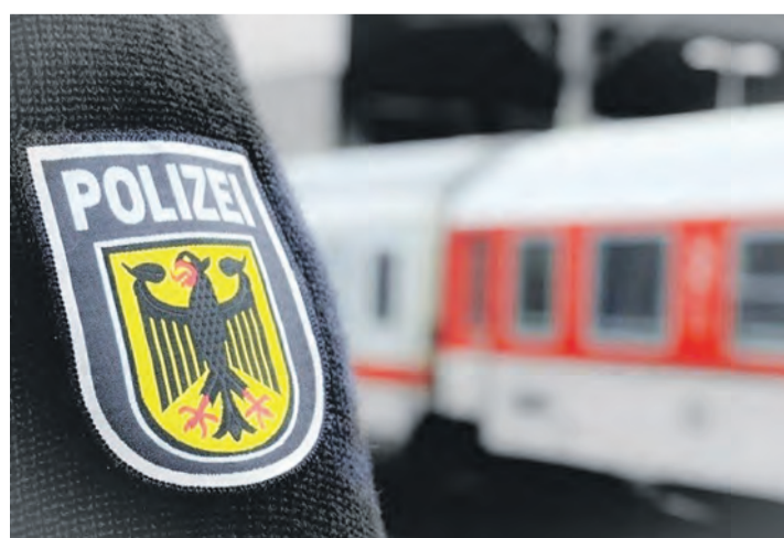
Das Polizeipräsidium Konstanz zeigt rückläufige Tendenzen bei einigen Straftaten. Doch es gibt auch Ausreißer. Symbolbild Archiv

Auch die Rauschgiftkriminalität zeigt weiterhin rückläufige Zahlen: Mit einem Rückgang um 46,4 Prozent werden in 2025 819 Fälle mit 719 Tatverdächtigen registriert. Letztlich zeigt auch der Bereich Cybercrime in 2025 weniger erfasste Straftaten. So gehen die registrierten Fälle von 645 auf 590 zurück. Den größten Anteil machen hierbei Fälle des Computerbetrugs im Zusammenhang mit unbaren Zahlungsmitteln aus. Auch wenn die Gesamtzahl der Straftaten im Zuständigkeitsbereich des Polizeipräsidiums Konstanz rückläufig ist, stellt Polizeipräsident Jürgen von Massenbach-Bardt klar: »Hinter jeder Straftat stehen Menschen, die Belastungen, Vermögensverluste oder gar Verletzungen erleiden und in ihrem Sicherheitsgefühl beeinträchtigt sind.« Der Polizeipräsident weiter: »Das nehmen wir sehr ernst und werden dies unter anderem im Rahmen lageorientierter Präsenz und der Fortführung der Kontrollen der Messerverbote aufgreifen. Ergänzt wird dies durch unsere Präventionsarbeit in Bereichen wie digitale Kriminalitätsformen, Rauschgiftkonsum und Umgang mit sozialen Medien. Pressemeldung