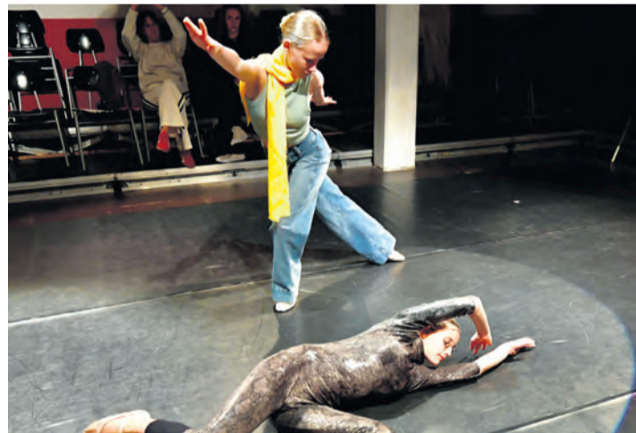
Auf einen Tanz zwischen Saint-Exupéry und Rachmaninow kann sich das Publikum beim kommenden Ballettabend der Ballettschule des Theaters »Die Färbe« freuen.

Der erste Teil widmet sich nach Angaben der Ballettschule der weltberühmten Erzählung »Der kleine Prinz« von Antoine de Saint-Exupéry. Die Choreografie von Schulleiterin Ines Kuhllicke interpretiert die Begegnungen des kleinen Prinzen auf seiner Reise aus Sicht des Piloten und übersetzt die bekannten Figuren und Situationen der Geschichte in Bewegung – eine Performance voller Leidenschaft für Tanz, Sprache und Musik in altbekannter Weise als Koproduktion des Theaters und der Ballettschule »Die Färbe« zusammen mit der Färbe-Schau-