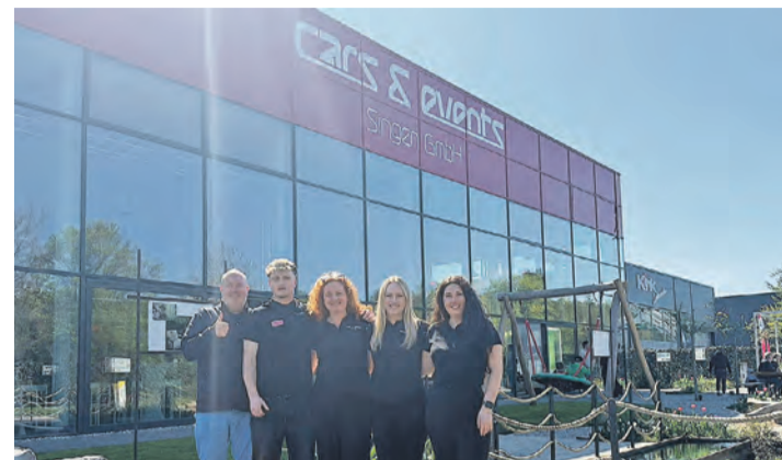
Die neue Eventlocation in Singen.

Singen. Bei sonnigem Aprilwetter konnte die neue Eventlocation »Cars und Events« am Sonntag, 19. April erstmals ihre Türen für die Öffentlichkeit öffnen und Interessierten Einblicke hinter die Kulissen gewähren. Dabei gab es