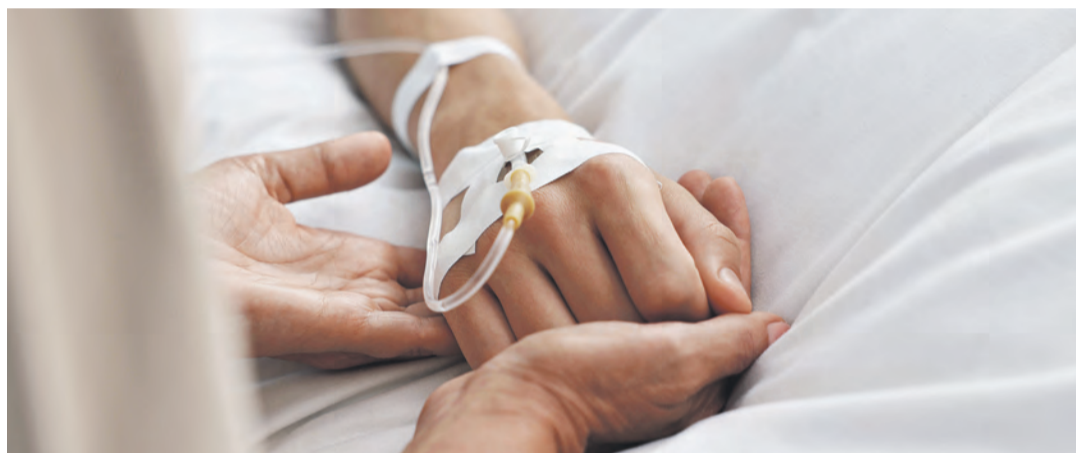
Seit 2020 ist gewerbsmäßiger Suizid in Deutschland unreguliert.