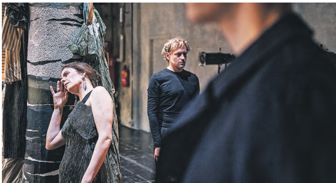
Anton Tschechows Stück »Der Kirschgarten«, das seit dem 18. April am Theater Konstanz zu sehen ist, stellt unter anderem die Frage, wie schwer es ist, die eigene Vergangenheit hinter sich zu lassen und die Realität zu akzeptieren.

Diese emotionale Achterbahnfahrt, welche die Familie hierbei durchlebt, inszenieren das Regie-Duo Henri Hüster und Bea Carolina Remark mit tiefgehenden wie eindrucksvollen Choreographien, die dadurch diese menschliche Tiefe auf sehr einfühlsame Art und Weise dem Publikum offenbaren. So ist es auch die sichtlich im Stück erkennbare Melancholie, der hierdurch ein besonderer Ausdruck verliehen wird. Auch die hastigen Handbewegungen einiger Figuren zeigt die Nervosität dieser vor der aktuell für sie herrschenden Realität. Ein weiteres Merkmal für Tschechows Stücke ist die Wider-