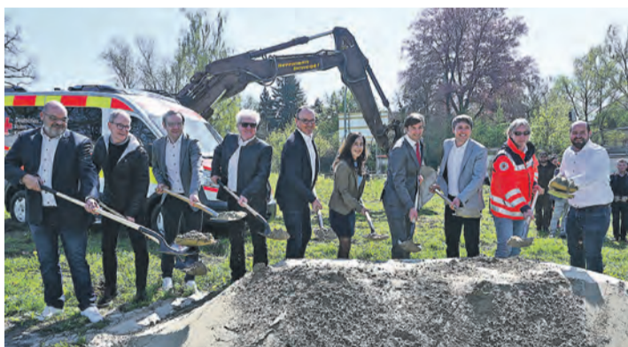
Mit der neuen Rettungswache sollen sowohl bessere Arbeitsbedingungen, als auch Erholungsmöglichkeiten für die Einsatzkräfte geschaffen werden. Hierüber freuen sich alle Beteiligten beim Spatenstich

Konstanz. Ein besseres Wetter hätte man für den Spatenstich der Rettungswache des Deutschen Roten Kreuzes am 17. April kaum erwarten können. In der Mainaustraße 33a, rund 300 Meter vom Krankenhaus entfernt, soll sie künftig stehen. Der Neubau wird notwendig, da die bestehende Wache den heutigen Anforderungen nicht mehr gerecht wird. »Wir haben im Rettungsdienst insgesamt 300 Mitarbeiter. In Konstanz sind es auf der Wache 44«, erklärt Landrat Zeno Danner. Insgesamt werden rund 50.000 Einsätze pro Jahr bewältigt. Umso wichtiger sei es, dass Arbeitsbedingungen, Umfeld und auch Erholungsmöglichkeiten für die Einsatzkräfte stimmen. Auch OB Uli Burchardt hebt die Bedeutung des Standorts her-