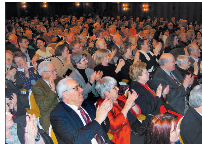
Sie waren begeistert: Die Freunde und Förderer der Poppele-Zunft beim Poppele-Kabarett 2004, bei dem kräftig die Werbetrommeln gerührt wurden.