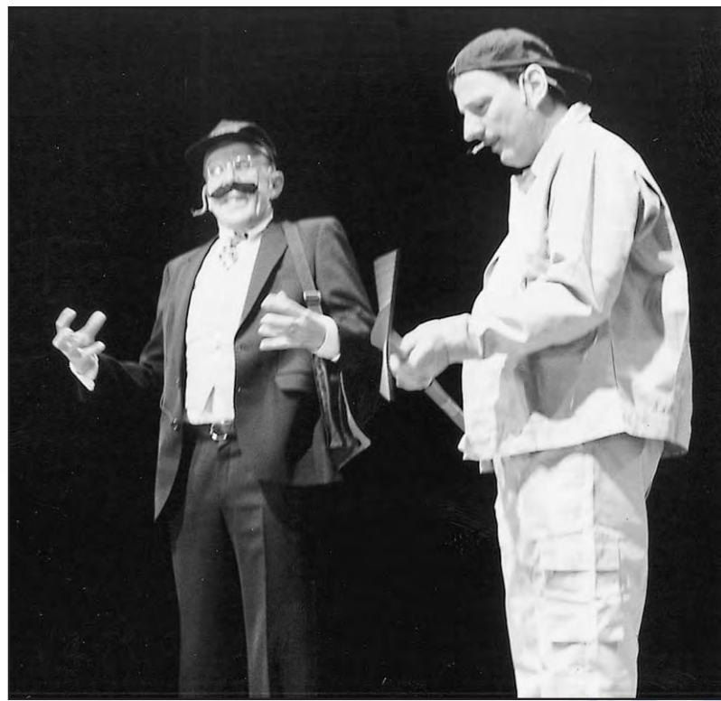
In ibrem Element beim Narrenspiegel 2003: Fidele und Nazi.

Manager, ja no isch us Dir doch no ebbis worre. Wie bisch au zu dem Titel kumme?