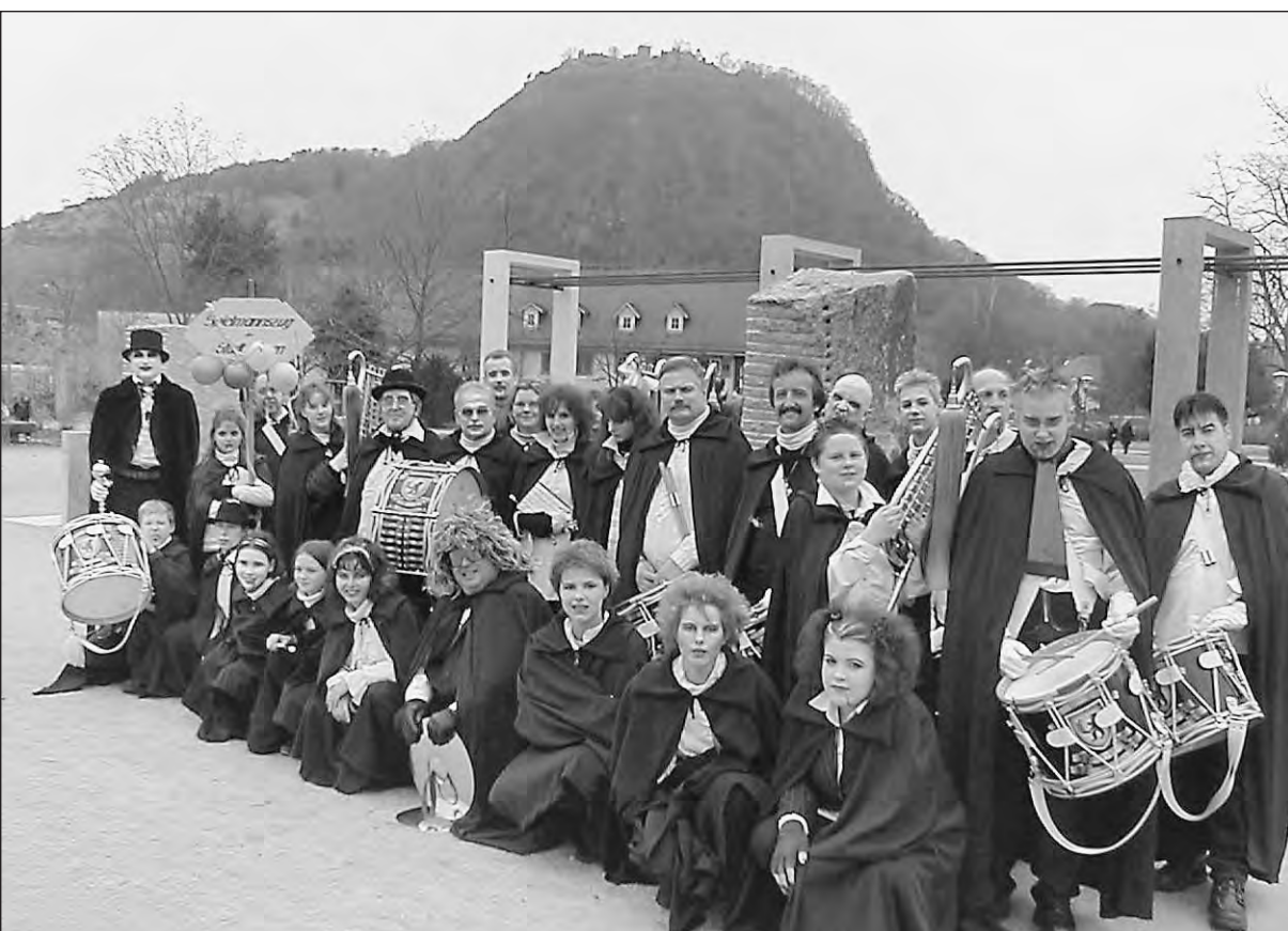
Sie schlüpfen an Fasnacht in manches Häs: Der Spielmannszug der Stadt Singen begab sich hier unter die Vampire.

im Jahr 1969 ist der Spielmannszug immer wieder zu Tournées in das europäische Ausland gereist, so u.a. mehrfach nach Südfrankreich und Monaco, nach Paris, nach Rom, in die Bretagne, nach Mallorca und an die Costa Brava. Bei unzähligen musikalischen Wettkämpfen, bei der deutschen Meisterschaft und anlässlich Hunderter von Auftritten in Deutschland konnten die Musikerinnen und Musiker ihre Klasse beweisen.