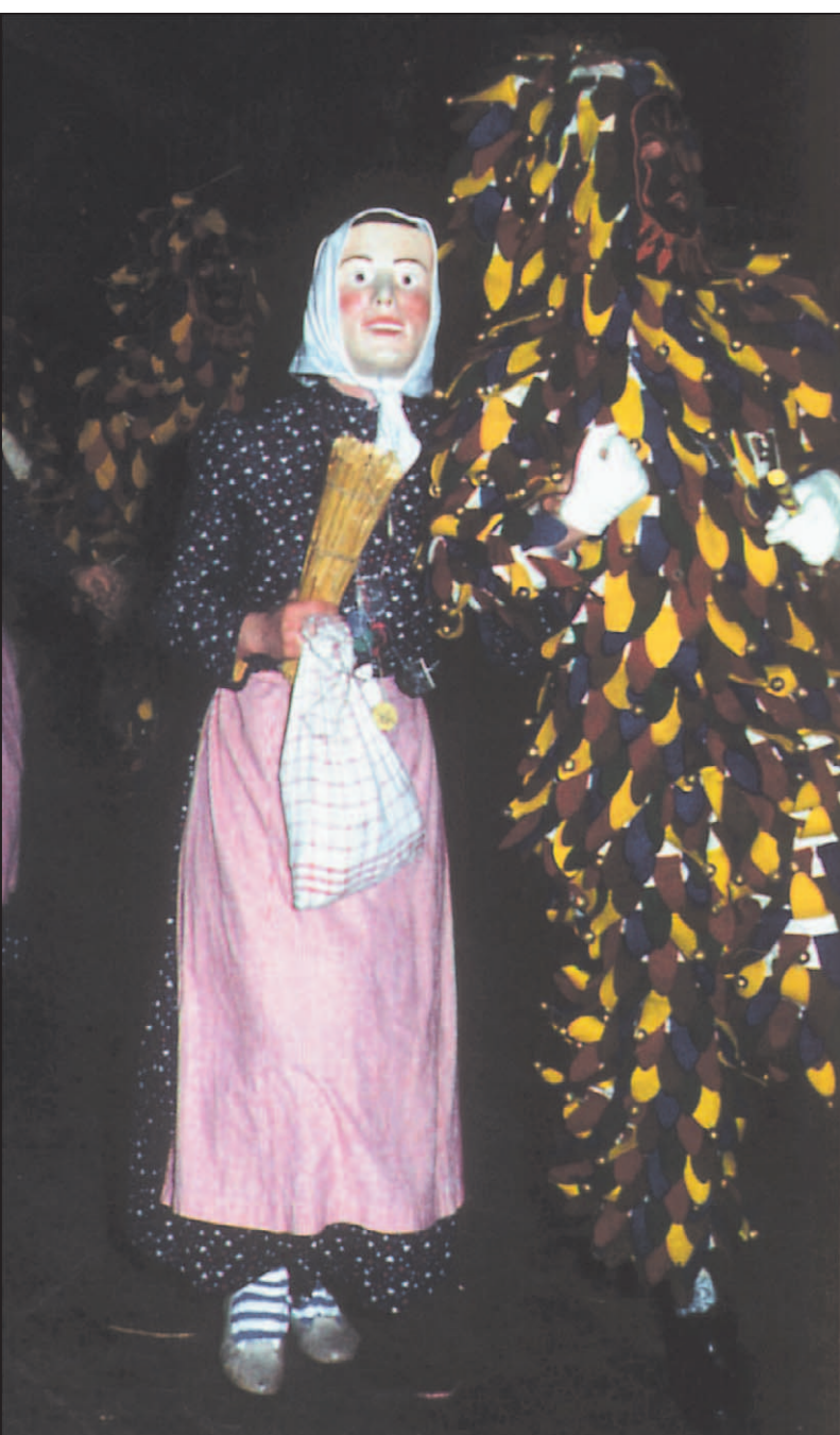
Was ist denn da passiert? Dieses Bild stammt aus dem Jubiläumsjahr 1960 und zeigt in der Tat ein Rebwieber unter der Larve beim Einmarsch mit den Hanseles.