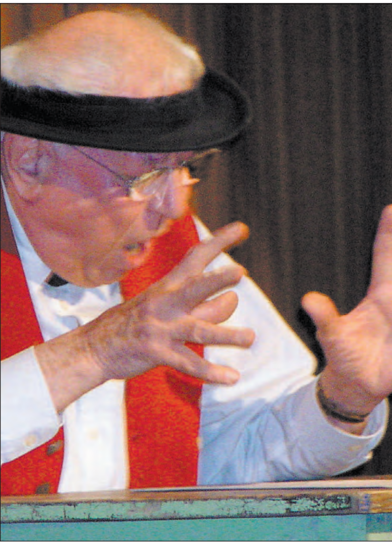
Ovationen ertete Wafro für seine Ode an die Sponsoren beim Poppele-Kabarett in der Kunsthalle.

Meine Damen und Herren, ich finde Sie toll! Ich meine das absolut ehrlich, jawoll, ich sag es noch einmal, ich finde Sie Spitze, die Kunsthalle voll, über dreihundert Sitze, und wohin ich auch schau, keine einzige Niete, handverlesenes Singen, totale Elite! Die Singemer Sahne, keine trüben Tassen,