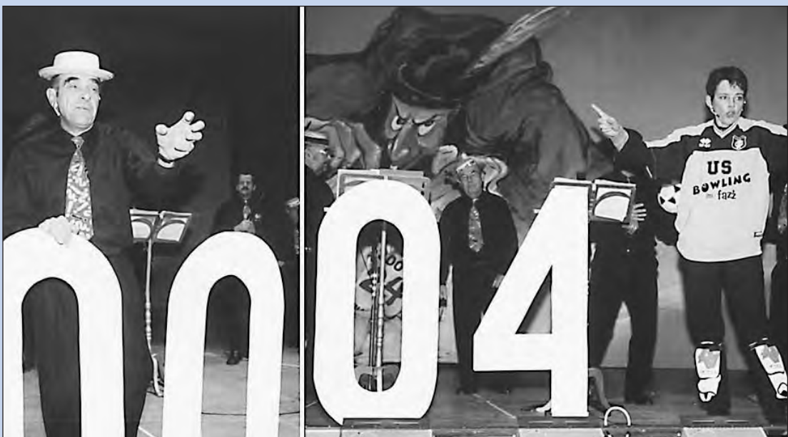
Der Lehrchor entführte 2003 ins Land der Nullen. Nul Null herrscht im Haushalt der Stadt und auch der FC Singen schießt wenige Tore

Und dann stolzier ich rum und setz mich in die Loge Und zeige allen mein Profil, Mich zu sehen ist eine wahre Pracht. Die feinsten Delikatessen lass ich mir servieren aus dem Hotel nebenan, scheuch' das Personal bei Tag und Nacht!