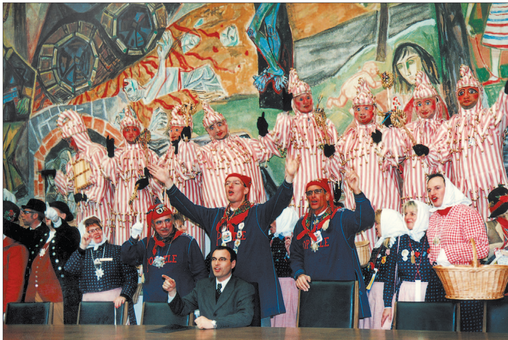
Das war ihr großer Auftritt: Die Schellenhansel bei der Machtübernahme der Poppele-Zunft im Singener Ratssaal.

Am Fasnetszieschdig beim Kinderball konnte uns der Narrensamen in der Scheffelhalle eingehend bestaunen. Der krönende Abschluss dieser supertollen Fasnet war für uns der Abend auf der Empore in der Scheffelhalle bei der Narrenbaumversteigerung. Wir bekamen den Zuschlag für das Narrenloch. Darauf sind wir natürlich besonders stolz und haben am Aschermittwoch traditionsgemäß eine volle Schnapsflasche in das Narrenloch versenkt. Uns bleibt die Erinnerung und Freude über die erste Fasnet in der neuen Gruppe. Wir sind außerordentlich dankbar dafür, dass der Poppele besonders gute Beziehungen zu Petrus pflegt. Obwohl die Wetterlage über die diesjährige Fasnet unbeständig war: bei allen Umzügen schien die Sonne, und das nicht nur in unseren Herzen.