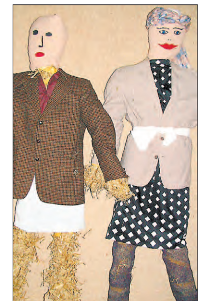
2004 wird Singen zum bunten Narrenfest. Was sich der Dekorations-Ausschuss so alles ausgedacht hat, zeigen unsere Bilder. Beginnend an den Ortseingängen werden überall menschengroße Narrenfiguren begrüßen. Und auch in den Festzelten werden die närrischen Kameraden für eine durchgehende optische Linie sorgen. Genäht, gebastelt und gezimmert wird seit Monaten.