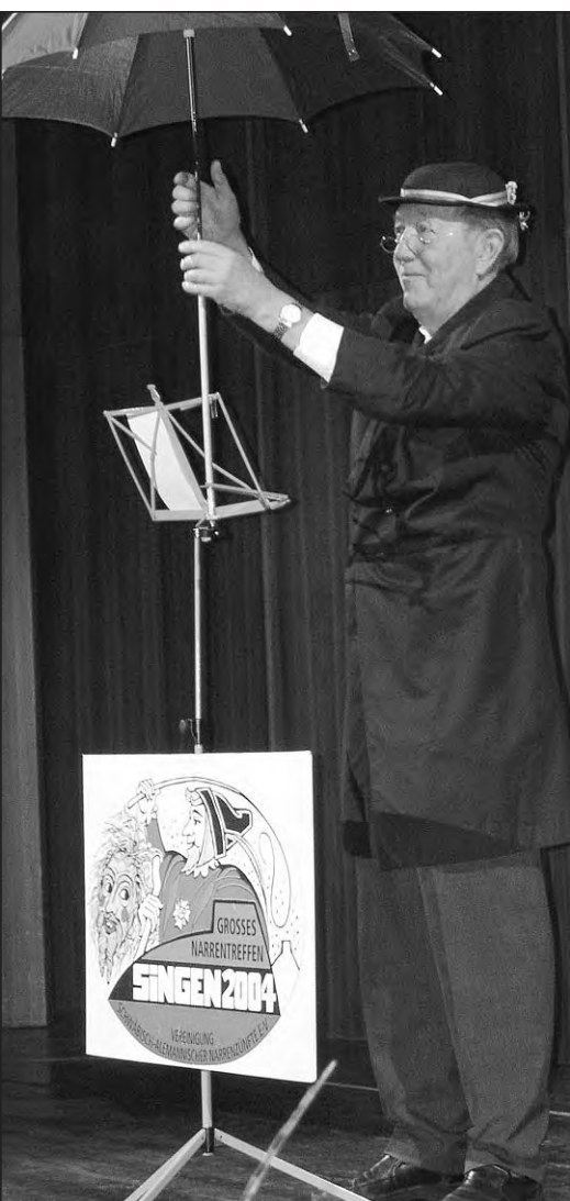
Der Debeka ist wieder da und trommelt für 2004.