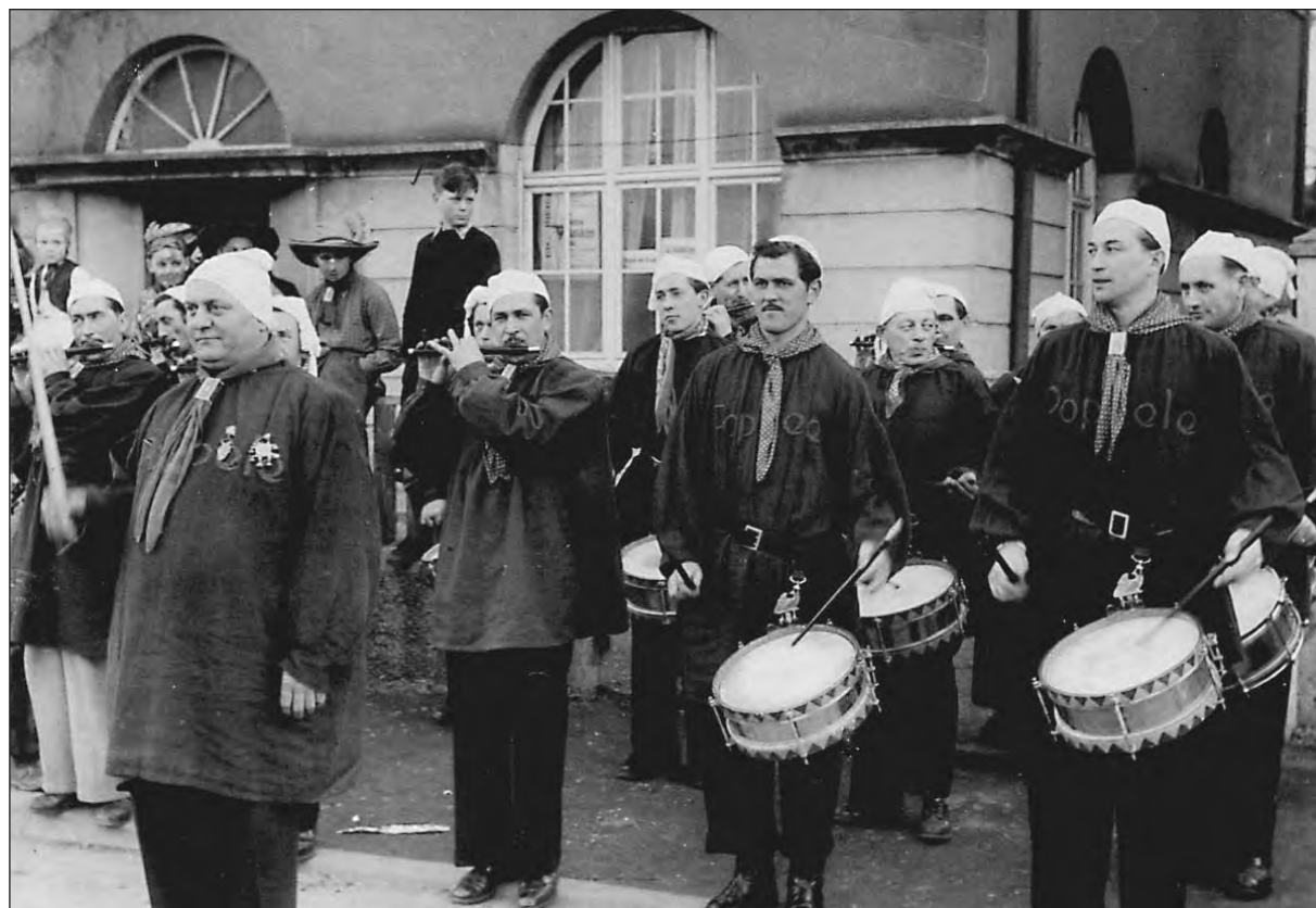
Ein Bild aus den fünfziger Jahren: Der Spielmannszug spielt vor dem ehemaligen Gasthaus Bären auf. Später waren es die Bilger-Stuben. Und heute ist die Commerzbank hier untergebracht.

Der Spielmannszug ist das ganze Jahr über aktiv; nur etwa 1/3 aller Platzkonzerte, Auftritte und Umzüge fällt in die Fasnachtszeit. Ansonsten sind die Musiker und Musikerinnen in ihren schicken Uniformen im In- und Ausland unterwegs. Erst im Oktober 2002 unternahmen sie eine einwöchige Konzertreise nach Rom und Pomezia, wo sie von der italienischen Bevölkerung begeistert aufgenommen wurden. Seit seinem 50-jährigen Bestehen