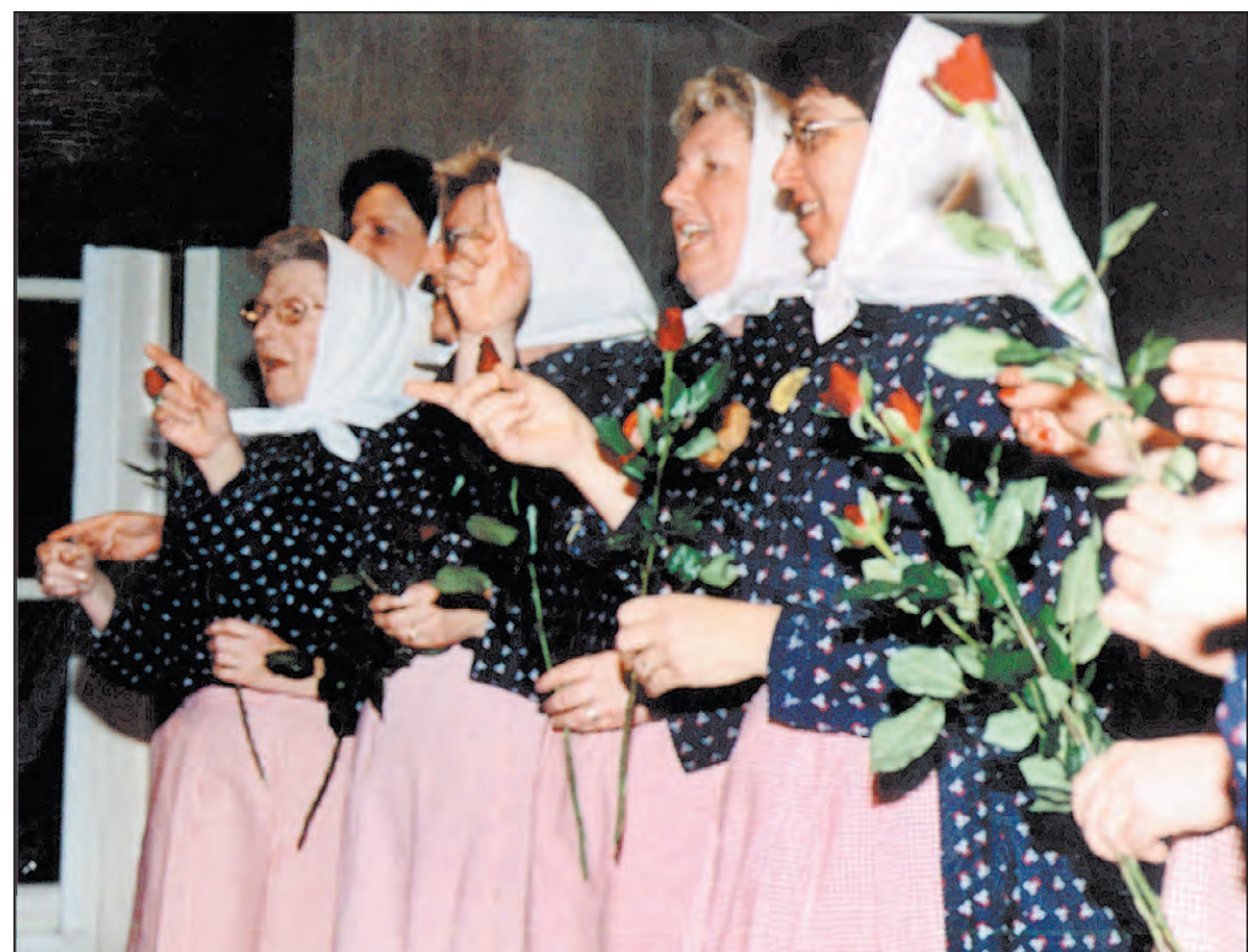
So freuen sich Rebwieber, wenn sie am Ordensabend der Zunft närrisch dekoriert werden. In den fünfzig Jahren sind die Rebwieber zu einem wichtigen Faktor in der Fastnachtslandschaft geworden.