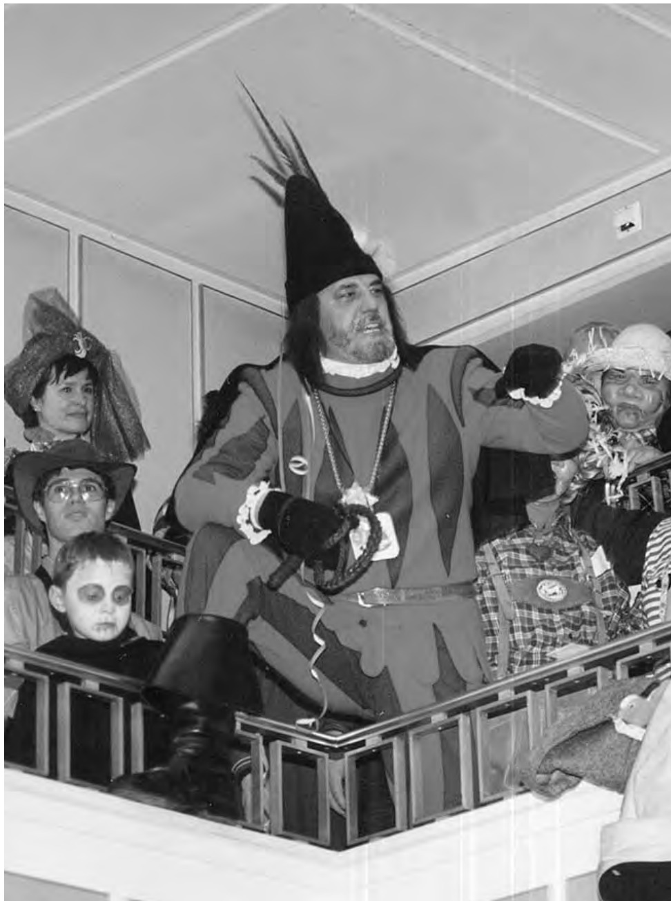
Zu singen auf die Melodie von »S goht degege, Mamme, häng de Schurz a d'Wand«

gesungen am 22. Dezember 2002 vom Hohen Rat der Poppele-Zunft