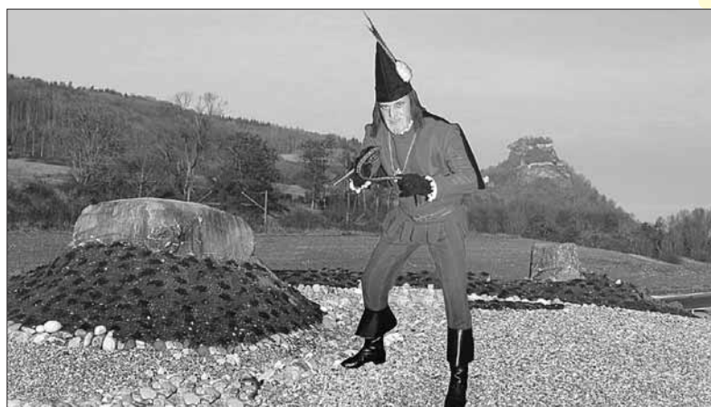
Einen eigenen Kreisel zwischen Hohentwiel und Hohenkräben besitzt jetzt der Poppele.

Jahr den Aufstieg geschafft in eine überregionale Klasse: der neue Kunstrasenplatz des FC Singen. Sollte die Mannschaft es schaffen den gleichen Standard zu erreichen wie der Platz, dann sind nach oben keine Grenzen gesetzt.