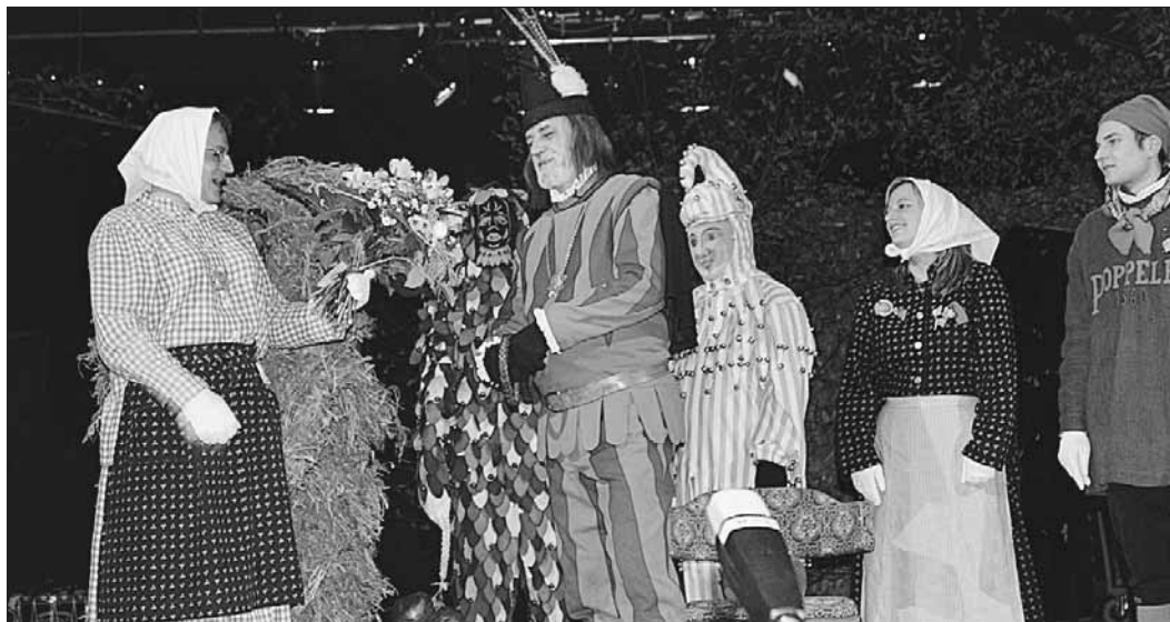
Wer gratuliert dem Poppele als Erster? Natürlich das Eierwieb.