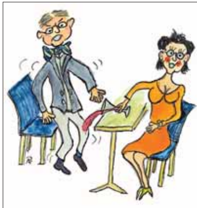
Pech gehabt: Schwupp da taufte die Gattin des Zunftmeisters just mit Rotwein einen der feiernden Firmenchefs.

FRÜHER HOMMIR NO I D'HOSE GSEICHT, ETZED HOMMIR DES ERREICHT: HALLELUJA KLINGT'S DURCH D'STADT, DIE ENDLICH IHRE HALLE HAT.