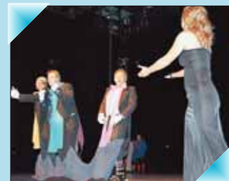
Die drei Tenöre singen zur Premiere in der Stadtballe »Ob, Cara mia«. Die Damenwelt ist hin-und bergerissen.