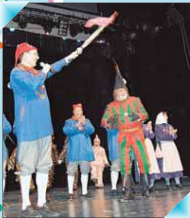
Der Zunftmeister als Fremdenführer: Von der Scheffelballe führt der Weg in die Stadtballe zum Poppele-Narrenspiegel. Da gibt es heiße Soblen beim Zunftgeist!