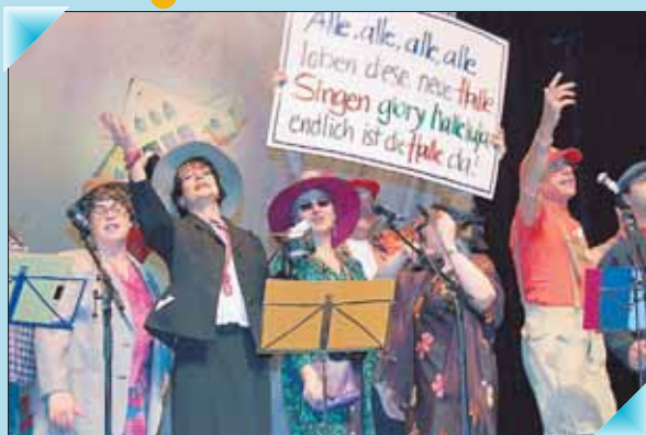
Fast schon ein Lehrerinnenchor: Frisches Blut und setzige Rhythmen bietet das verjüngte Ensemble der Traditionsnummer - übrigens der einzige Chor dieser Art im ganzen Land!