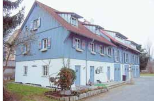
Das Schmuckstück der Poppele-Zunft ist die erweiterte Zunftschüür im Alten Dorf von Singen.

2005 wurden die Planungen für den Anbau begonnen, Gespräche mit der