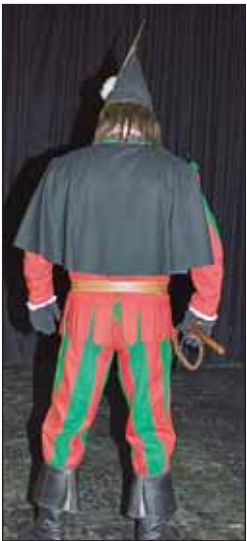
Der Poppele ist nur ein Maskentrager, der sich nicht aus dem Festnetz löst. Er ist ein Maskentrager, der sich nicht aus dem Festnetz löst. Er ist ein Maskentrager, der sich nicht aus dem Festnetz löst.

Hier gibt es noch eine weitere Figur, die als 'Hohekrähe' bezeichnet wird. Sie trägt eine hohe, spitze Krone und eine dunkle, gemusterte Kleidung. Diese Figur ist ein Maskentrager, der sich nicht aus dem Festnetz löst.