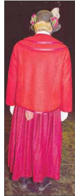
Die Wodde ist eine Figur, die aus einem roten Stoff gefertigt ist. Sie trägt eine weiße Mütze und eine weiße Schürze. Diese Figur ist ein Maskentrager, der sich nicht aus dem Festnetz löst.