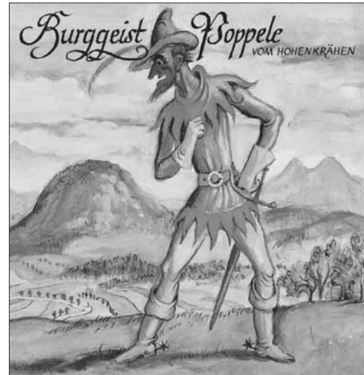
Das neue Poppele-Buch fasst seine Streiche zusammen.