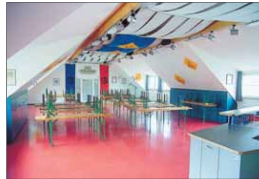
Herzlich willkommen: Die Zunftschüür bietet mit ihrem neuen Saal Platz für allerlei Feste und Treffen der Narren.

angehoben. Zusammen mit einer stützenfreien Dachkonstruktion ergab sich ein großzügiges Raumangebot. Schallschutzmaßnahmen, eine Lüftungsanlage sowie moderne Beschallungstechnik ermöglichen es nun, den Raum sowohl für Bastelarbeiten oder Narrenspiegelproben, aber auch als Raum für Veranstaltungen aller Art zu nutzen. Eine im Dachgeschoss neu geschaffene WC-Anlage soll auch diesen Bedürfnissen für die Zukunft gerecht werden. All diese Arbeiten sowie die vollständige