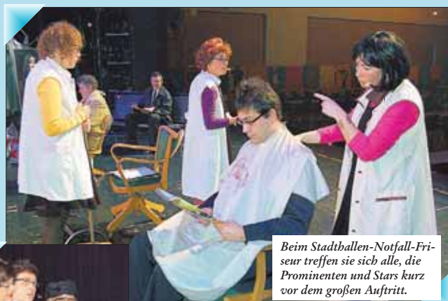
Beim Stadtballe-Notfall-Friseur treffen sie sich alle, die Prominenten und Stars kurz vor dem großen Auftritt.