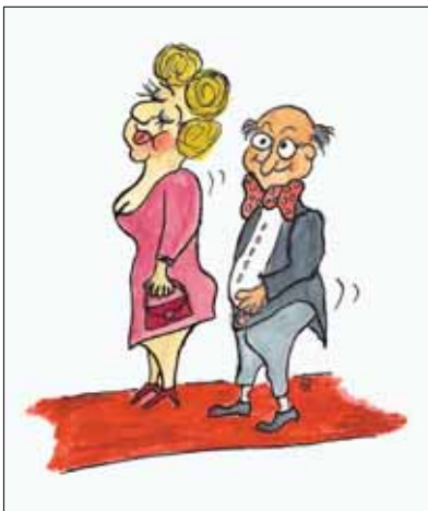
Auf dem roten Teppich in die neue Stadthalle: da war der Genuss groß geschrieben.

Lust als auf das angekündigte Feuerwerk. Dieses wurde schließlich doch um einige Minuten verschoben, aber nicht mehr, weil der Groll des gemeinen Publikums, das sich im Stadtpark versammelt hatte, sonst zu groß geworden wäre.