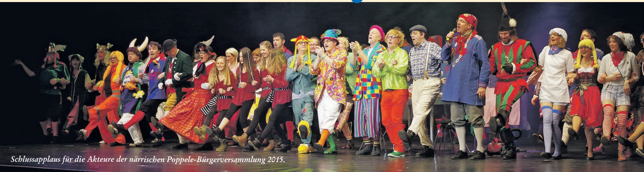
Schlussapplaus für die Akteure der närrischen Poppele-Bürgerversammlung 2015.