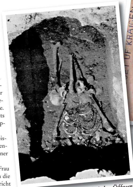
1936 entstand dieses Bild bei der Öffnung des Poppele-Grabes.