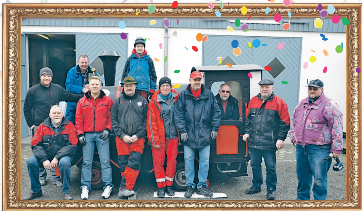
Beim Närrischen Jahrmarkt am Fasnetsamstag ist in Singen wieder das beliebte Bähmle unterwegs, nachdem es mit Unterstützung der Volksbank »technisch runderneuert« werden konnte. Auf das Fahrvergnügen vieler Kinder freuen sich die Zunftgesellen, die hier kräftig Hand angelegt hatten. Oft sind es die einfachen Dinge im Leben, die Begeisterung auslösen und das Narrenberz böher schlagen lassen. Mit dem gelungenen Werk präsentieren sich die Helfer vor der Zunftschür im Alten Dorf auf unserem Bild.