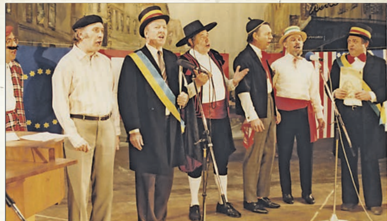
Der Lehrerchor auf der Scheffelballen-Bühne im Narrenspiegel 1984.

war der vom Südkurier oben erwähnte TORERO - sangen die Kollegen ihrem neuen Chef noch ein lustiges Ständchen, und dazu setzte sich der in offizieller Aufgabe anwesende Schulamtsdirektor ans Klavier und begleitete sie in schmissiger Weise, die das anwesende Publikum begeisterte. Unter den Anwesenden war auch der amtierende Zunftmeister der Singener Poppele-Zunft in seiner Eigenschaft als Direktor des Gymnasiums und warb dann unter seinen Kollegen für die Gründung eines närrischen Chors bei einem jährlichen Auftritt im sogenannten Narrenspiegel, einer Art »Mainz bleibt Mainz« im kommunalen Rahmen, einer öffentlichen Veranstaltung an Fasnacht, die von der Presse als die »einzig wahre Bürgerversammlung« beurteilt und gefeiert wurde.