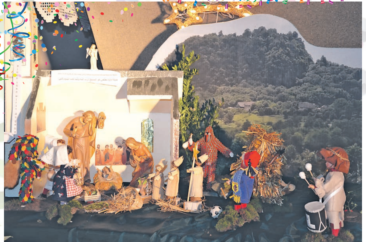
Zuwachs bekommen haben die Krippenfiguren in der altkatholischen Kirche von St. Thomas in Singen. Der Anbetung des Christuskindes haben sich die Zunftfiguren angeschlossen, womit sich der Themenkreis im Jahreslauf schließt. Dafür ist es schließlich nie zu früh oder zu spät. Und bunt war unsere Welt schon immer ...