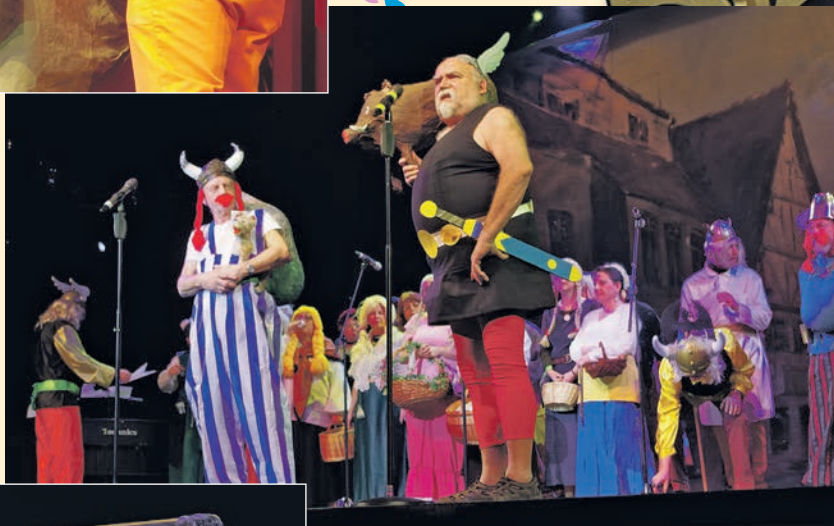
Bei Asterix & Obelix landet der Poppele-Chor und macht Werbung für die tolle Stadt Singen. Troubadix wettet gegen die ungebildeten Römer aus Constanzia.