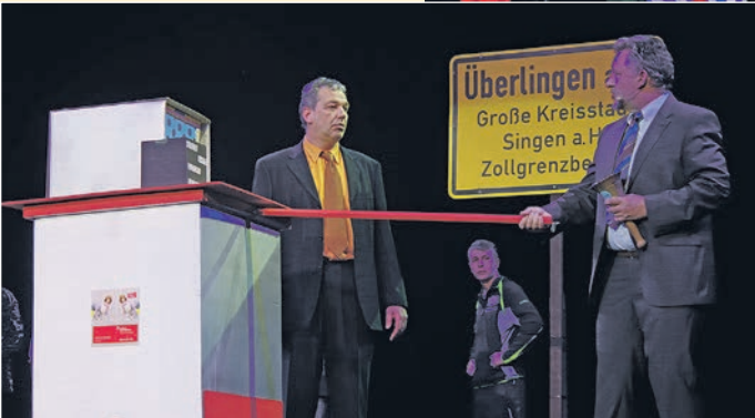
Am Klopfi-Mobil ist die Sprachidentifikation Trumpf; und als Aufsichtsrat bekommt man hier kein Geld ausbezahlt.