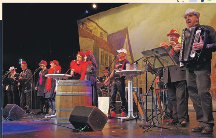
Nach 35 Jahren zum letzten Mal auf der Bühne: der Lehrerchor.