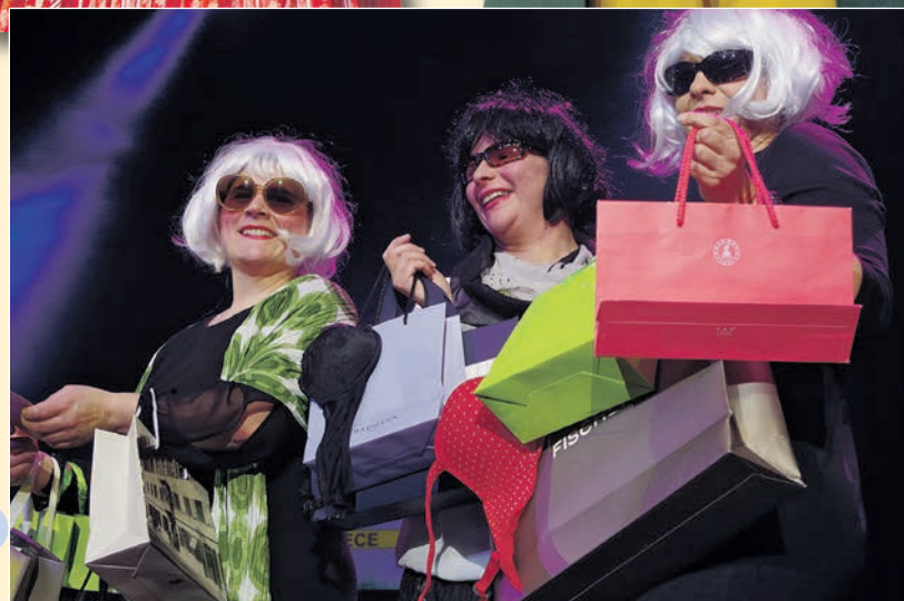
Bei einem Besuch im ECE sind diese Rebwieber zu entdecken; sie tummeln sich voller Freude im Einkaufsvergnügen.