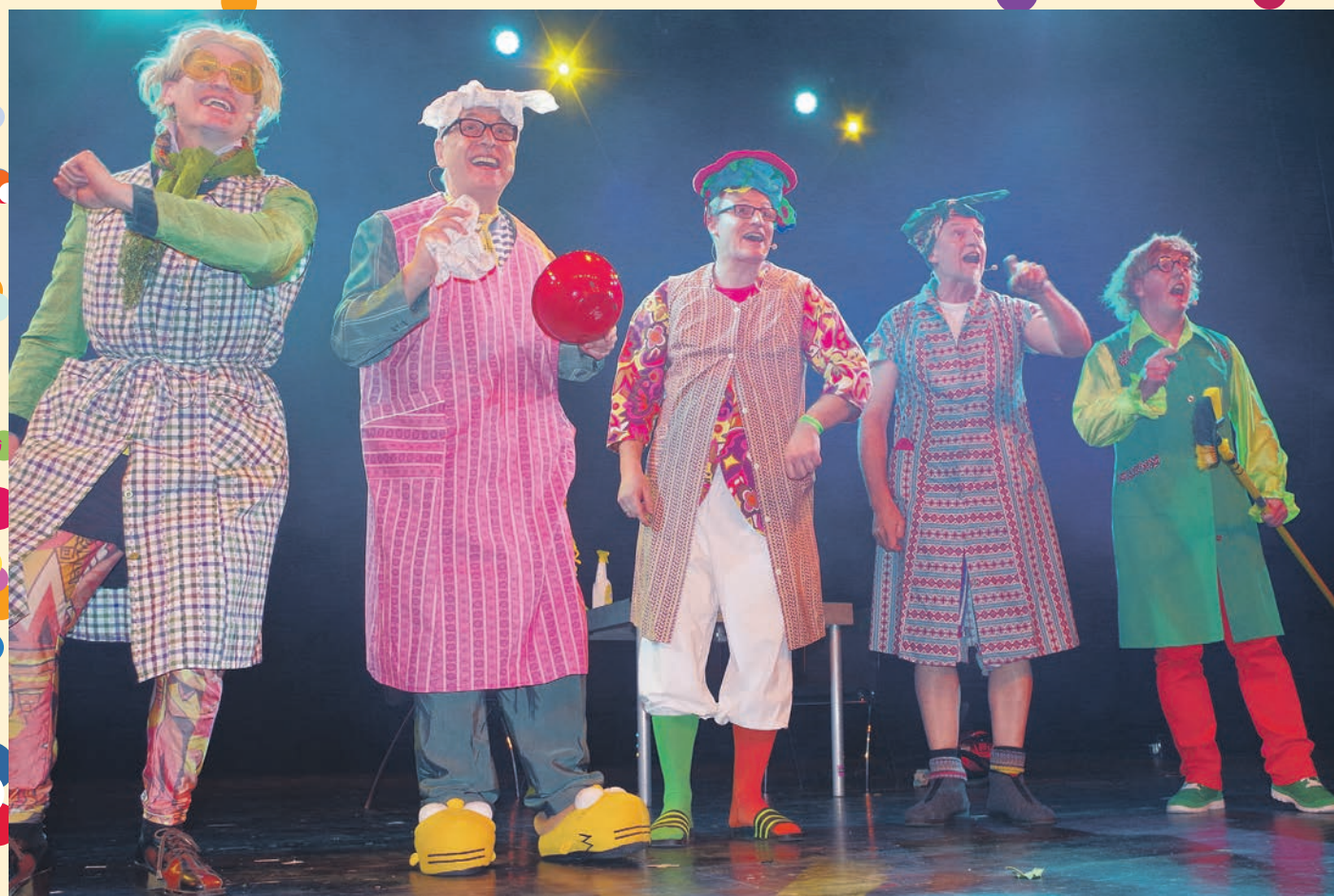
Die »Dramatischen Vier« in ihrem Element: im Hausfrauen-Häs bringen sie den Saal in Stimmung mit »Jetz leg' ma lo lo los«.