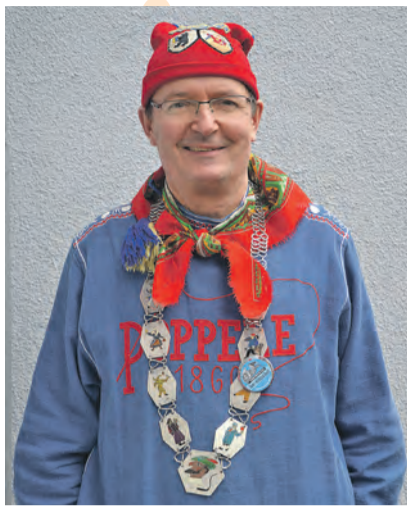
also: „Wo geht es hin?“ Diese Version stellt ein mögliches Ziel ins Zentrum der Überlegung, wir waren uns aber dann ei-

Und Sie haben ja bestimmt auch das Motto der Poppele-Zunft für diese Fasnet zur Kenntnis genommen - es heißt: „Wo goht's lang?“, und ich behaupte, dass unser Motto (wie die früheren Mottos auch) auf einzigartige Weise in der Kürze und auf Alemannisch die Befindlichkeit von uns Singemern, ja vielleicht aller deutschen Bundesbürger widerspiegelt. Scheinen doch die Probleme in der Welt so vielfältig und so schwierig, dass der Eindruck entsteht, dass niemand mehr so recht weiß, was denn die Lösungen sind und wie diese zu finden sind. In unserer Ratssitzung im Oktober, in der wir das Fasnetmotto festlegten, stand zur Debatte auch die Version: „Wo goht's ani?“