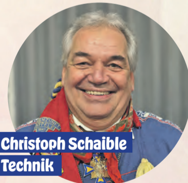
Christoph Schaible Technik