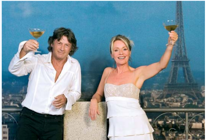
Paris ist einer der Klassiker für eine Hochzeitsreise.

Egal, wofür man sich entscheidet, die Profis vom Reisebüro richten sich ganz nach den Wünschen