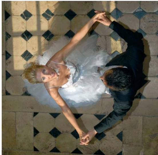
Der Hochzeitstanz, einer der schönsten Augenblicke eines großen Tages.

Wege leiten wollen, um diesem zu entgehen, gibt es eine ganz einfache Lösung: Wer vorher einen