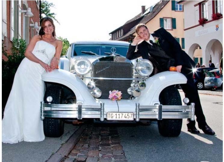
Ein stimmungsvolles Bild des Brautpaares gehört in die Hände von professionellen Fotografen.

Es lohnt sich auf jeden Fall, für die Hochzeitsfotos einen professionellen Fotografen zu engagieren, und manche können auch gleich das Fotostudio dafür mitbringen. Profis bringen einen großen Erfahrungsschatz mit und wissen, welche Fotos später am besten wirken, sie können die »offiziellen« Fotos auch im entsprechenden zeitlichen Rahmen bewältigen, ohne dass die Hochzeitsfeier aus den Fugen gerät. Vor allem: sie sind nicht so in die Feier involviert, dass man sie ständig suchen muss, wenn etwas fotografiert werden soll. Die meisten Brautpaare, so die Erfahrung, wählen bereits den Vormittag vor der kirchlichen