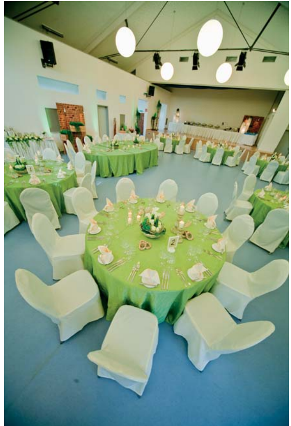
Eine festlich gedeckte Tafel ist eines der Highlights einer jeden Hochzeitsfeier.

Auch beim Catering-Service sind übrigens oft Pro-