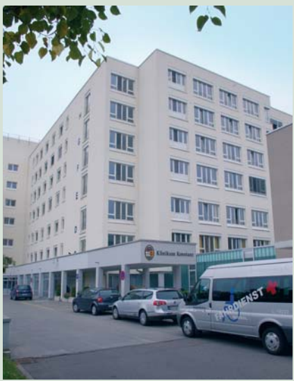
Die Frauenklinik im Klinikum Konstanz bietet ihren Gästen sogar Seesicht.

fach eine innige Atmosphäre nötig. Und das fängt schon im Wochenbett an: Der Förderverein hat dafür speziell entwickelte Holzbettchen beschafft, die die Mutter bequem zum Stillen öffnen kann und die auch direkt an das Bett der Mutter gestellt werden können. So ist für größtmögliche Nähe gesorgt, schließlich will die Mutter das Kind ja auch ganz nah bei sich haben. Hier ist es möglich. Möglichkeiten der Geburt gibt es im Konstanzer Klinikum viele. Im frisch renovierten Kreißsaal kann man sein Kind ganz klassisch auf die Welt bringen oder auch im Wasser oder in einer regelrechten Gebärlandschaft. Auch verfügt der Kreißsaal über extrabreite Betten, so dass sich auch der Vater dazu legen kann. Doch was gut ist, das kann auch noch besser werden. Dr. Andreas Zorr will die Frauenklinik noch stärker für Alternativmedizin öffnen und auch verstärkt mit Beleghebammen zusammen arbeiten, damit die Betreuung vor der Geburt in Kooperation mit der Klinik auch schon Zuhause beginnen kann. Auch legt er größten Wert auf eine gute Kooperation mit den niedergelassenen Ärzten, bei denen er sich