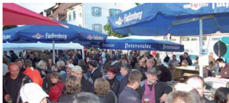
Beim Straßenfest im Rahmen des »Schweizer Feiertags« am Samstag, 2. Juli, organisieren die »Yetis« eine Riesensause auf dem Gustav-Hammer-Platz.

Führungen bietet Museumschefin Dr. Yvonne Istas donnerstags am 7. Juli, 4. August, 1. und 29. September sowie am 27. Oktober jeweils von 18 bis 19 Uhr an. Samstags führt sie am 9. Juli und 5. November von 10 bis 11 Uhr durch die Ausstellung. Führungen gibt es aber auch auf Nachfrage. Infos bei Yvonne Istas unter 07771/80 23 03 oder stadtmuseum@stockach.de und unter www.stockach.de.