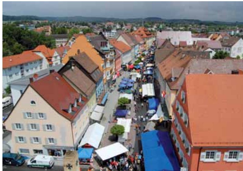
Egal, ob von oben oder unten betrachtet: Das Straßenfest zum »Schweizer Feiertag« am Samstag, 2. Juli, ab 8 Uhr ist von allen Seiten her ein anziehender Publikumsmagnet.

Stockach, wie es klingt und schwingt. Ein Kracher nach dem anderen wird zum »Schweizer Feiertag« gezündet.