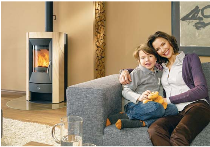
Wohlige Wärme vom Kaminofen: Mit moderner Technik kann er sogar eine Heizzentrale für die Wohnung werden.

Wer Besitzer eines schönen und modernen Kaminofens ist, kann sich glücklich schätzen. Denn verregnete Tage, kalte Abende oder auch Feierabende, die nach mehr Gemütlichkeit rufen, werden mit einem energieeffizienten Wärmespender unvergesslich schön. Schon seit vielen Jahren bereits gibt es so genannte wasserführende