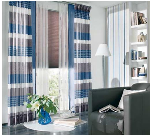
Licht wird mit schönen Gardinen oder Stores zum Erlebnis in der Wohnung.

Wohnkultur ist Lebenskultur. Sich in den eigenen vier Wänden zeitgemäß und stilvoll einzurichten, ist eine Frage von Wohlfühlkomfort. Dazu gehören auch immer wieder Gardinen oder Stores, mit denen eine Wohnung stilvoll eingerichtet wird. Die sind viel mehr als profaner Sonnenschutz, denn sie modellieren das Licht, das in die Wohnung kommt. Und das schafft Stimmung. In diesem Jahr spielen fröhliche Muster, fließende Stoffe sowie auffällige oder gedeckte Farben die Hauptrolle. Doch auch mit Schiebegardienen und Rollos setzt man die Wohnung gekonnt in Szene. Gerade Schiebegardienen nehmen an Beliebtheit zu. An