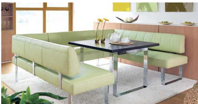
Das neue Sofa passt sogar zum Esstisch.

Kaum ein Möbelstück in der Wohnung ist so mit dem Begriff Gemütlichkeit verbunden. Und gemütlich sollen sie sein, die Sofas der neuesten Generation. Es herrscht mächtig Bewegung in der Sofa Szene, denn neue Ideen sind gefragt, wenn die Menschen dazu bewegt werden sollen, Abschied von ihrem alten Sofa zu nehmen.