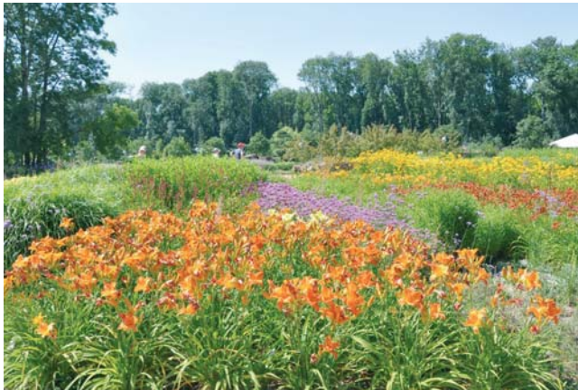
Für eine solche schöne Blütenpracht in Frühjahr und Sommer legt man den Grundstein im Herbst.

Wer hofft nicht, dass das Wetter im Herbst noch einmal anhaltend schön wird? Denn gerade jetzt gibt es im Garten und in der Natur viel zu ent-