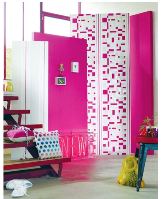
Wohnen macht mehr Spaß mit Mustern an der Wand.

Querstreifen beleben die Wand und wirken jung und zeitgemäß. Wenn eine ganze Wand in auffälligem Muster zu dominant wirkt, sind Paneele eine passende Alternative. Keine Frage: Rauhfasertapeten sind immer nur ein »Basic« für die Raumgestaltung. Muster oder Wandtattoos machen einfach mehr her.