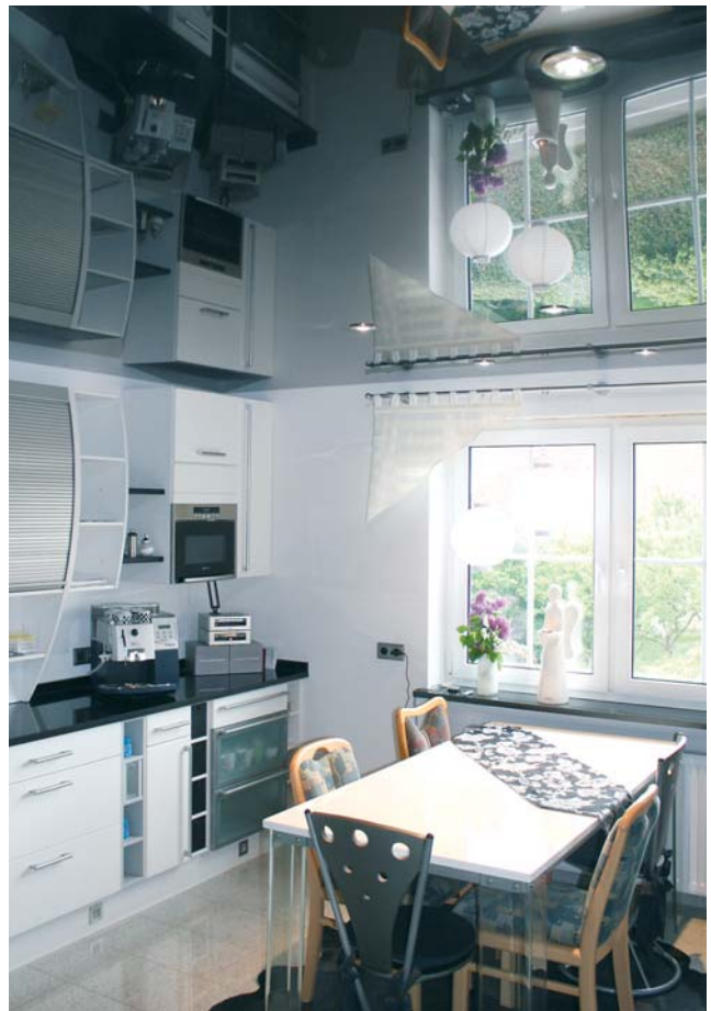
Die klassische Küche gibt es nicht mehr: sie verschmilzt immer stärker mit den Wohnräumen.

Oft geht es auch um neue Geräte, bei denen Induktionskochflächen, Dampfgarer oder auch Backöfen mit Steineinlagen für die beste hausgemachte Pizza ganz hoch im Kurs liegen. Die Farbtrends sind auch klar: hell soll die neue Küche sein, und glänzen. Damit ist der Wunsch nach Pflegeleichtigkeit verbunden, für den oft robuste Kunststoffe in Lackoptik sorgen. Ein ganz neuer Trend, der immer wieder auftaucht, sind Holzküchen. Ganz aktuell sind hier sogar sägeraube Oberflächen an den Schränken, die freilich ihren Pflegebedarf haben. Zeit zum Träumen sollte man sich nehmen, in einem guten Küchenstudio.