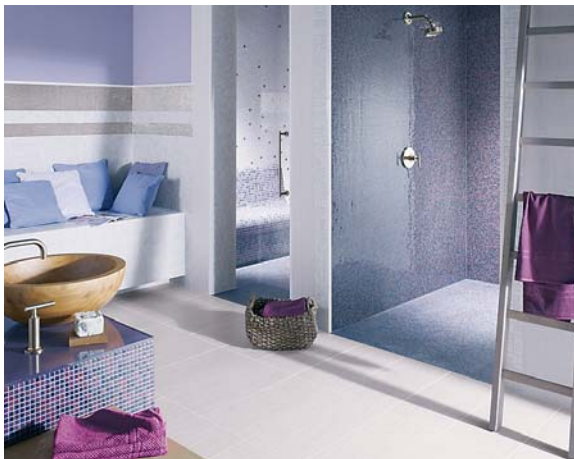
Die Fliese sucht die Natur als Vorbild: zum Beispiel in Tönen wie Pflaume, Haselnuss, Muschelweiss.

Die keramische Fliese zählt zu den traditionsreichsten Baumaterialien. Sie hat sich in den vergangenen Jahren unbemerkt von weiten Teilen der Öffentlichkeit zu einem hochwertigen Designprodukt entwickelt, das es nun »neu« zu entdecken gilt. In Fachkreisen besteht kein Zweifel: 2011 sind die schönsten, stilistisch vielfältigsten und mit zahlreichen technischen Feinheiten versehenen Fliesenkollektionen im Handel, die es jemals gab. Die keramische Fliese eignet sich für Wand und Boden und ermöglicht verschiedene Wohnstile.