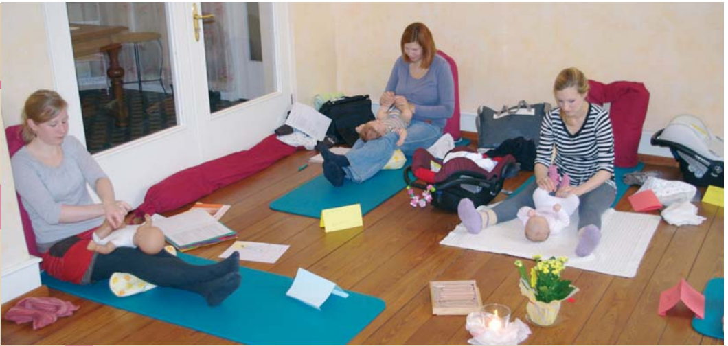
Nach der Geburt werden im Geburtshaus Roseninsel auch Kurse für vedische Babymassage mit den jungen Müttern gegeben.