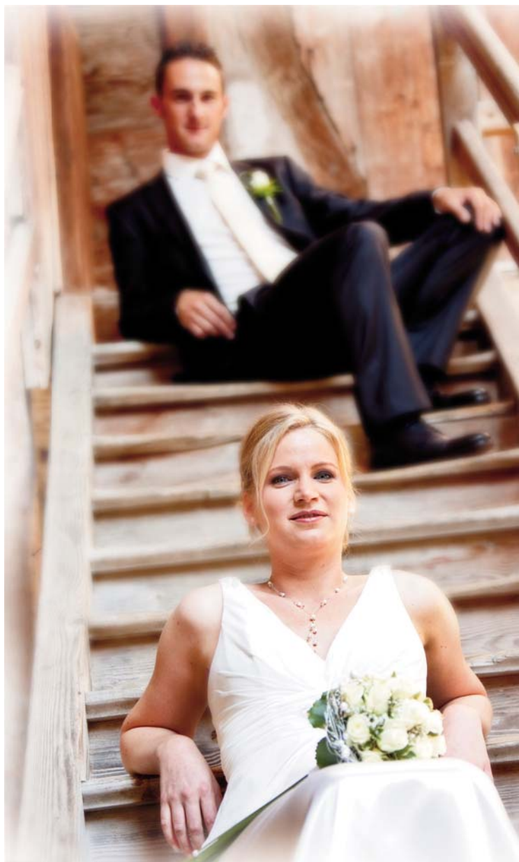
Einen Tag lang stehen die Braut und ihr Brautkleid am Hochzeitstag im Mittelpunkt.

Für die Anprobe des Kleides sollte die Mutter dabei sein, vielleicht auch ein paar Freundinnen. Und: Es sollte ein Geheimnis bleiben können, bis zum letzten Augenblick – bis der große Moment kommt und alle die Braut sehen dürfen.