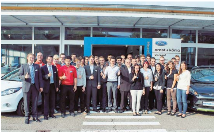
Bei ernst+könig in Freiburg wurde die Ausbildung mit einem Azubi-Tag gestartet.

Kfz-Mechatroniker/in jetzt auch die Möglichkeit, eine Ausbildung zur/m Bürokauffrau/mann zu absolvieren. Im Marktgebiet von Offenburg über Weil am Rhein bis hin zum Bodensee werden die 40 neuen Azubis auf die 12 Filialen verteilt. Davon werden 5 in der Region Hochrhein-Bodensee, 4 in Offenburg, 9 im Markgräflerland und 22 im Breisgau eingesetzt. Zum Start in die Ausbildung wurden alle Neuankömmlinge zu einem gemeinsamen AZUBI-Tag im Seminarhotel Heuboden in Umkirch sowie zu einem Empfang in die Hauptfiliale in Freiburg Nord eingeladen. Los ging's am Dienstagmorgen. Zu Beginn wurde den Neuen die ernst+könig-Historie sowie -Philosophie vermittelt. Nach dem Mittagessen hatten die Azubis die Möglichkeit, aktiv