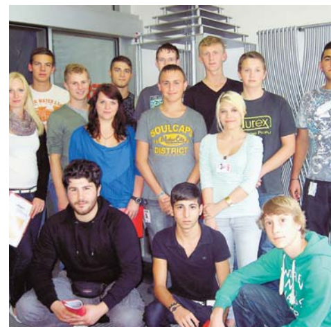
14 junge Auszubildende sind in diesem Jahr bei TRW gestartet. Der Radolfzeller Automobilzulieferer bietet eine Ausbildung in sieben Berufsfeldern an.

Auch 2013 stellt TRW in Radolfzell wieder Ausbildungsplätze in den oben genannten Berufen zur Verfügung.