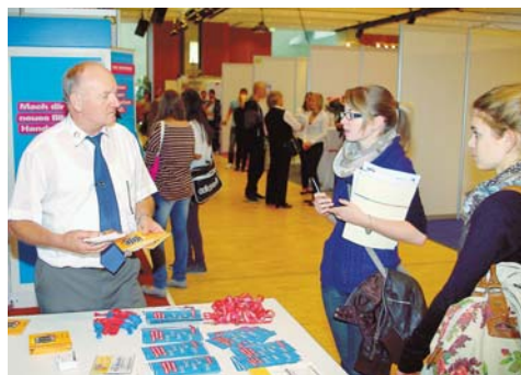
Die Handwerkskammer wirbt auf vielen Berufsmessen wie hier bei den JobDays in Singen um Nachwuchs, der bei der Fortsetzung der Erfolgsgeschichte des Handwerk mit anpacken will.