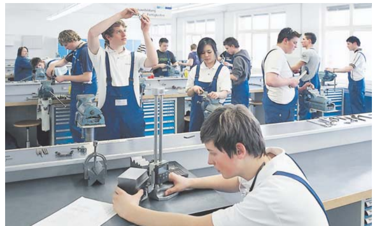
In speziellen Ausbildungswerkstätten werden die gewerblichen Auszubildenden auf ihr Berufsleben vorbereitet.

Neben Sozial- und Methodenkompetenz ist die fachliche Kompetenz eine wichtige Komponente für Aesculap und stellt deshalb ein wichtiges Ausbildungsziel dar, welches durch ein speziell konzipiertes Bildungsprogramm vermittelt wird. Die Inhalte gehen über die Ausbildungsordnungen hinaus und umfassen Produkt-schulungen, Hospitationen in Krankenhäusern, EDV-Kurse