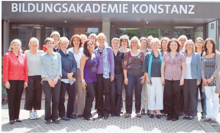
Der letztjährige BESS-Kurs der Bildungsakademie wurde noch in Konstanz abgeschlossen. Dieses Jahr starten die Kurse am neuen Standort in Singen.

Konstanz (swb). Die IHK in Konstanz startet am 16. November einen völlig neuen Lehrgang mit öffentlich-rechtlichem Abschluss: der/die Geprüfte Buchhalter/in. Damit schließt sich die Lücke zwischen kürzeren Zertifikatslehrgängen im Bereich Buchführung und dem Geprüfte/r Bilanzbuchhalter/in mit internationaler Ausrichtung. Teilnehmer/innen qualifizieren sich mit diesem Lehrgang dafür, Aufgaben in der Buchhaltung eigenständig und verantwortlich wahrzunehmen. Sie wirken bei der Erstellung von Zwischen- und Jahresabschlüssen mit, haben umfassende Kenntnisse in der Lohn- und Gehaltsbuchhaltung, werten das Zahlwerk für Planungs- und Kontrollentscheidungen aus, erstellen eine Kosten- und Leistungsrechnung und planen die Abwicklung finanzwirtschaftlicher Vorgänge. Dieser Lehrgang richtet sich an Mitarbeiter/innen aus dem Finanz- und Rechnungswesen mit kaufmännischer Berufspraxis, die ihr Fachwissen in der Buchhaltung ergänzen und weiter vertiefen möchten. Ein Übertritt in den Lehrgang zum/zur Geprüfte/r Bilanzbuchhalter/in unter Anrechnung der Prüfungsleistungen einer Teilprüfung ist nach Bestehen möglich, teilt die IHK in ihren Presseerklärung mit. Es sind noch wenige Plätze im Lehrgang frei. Information und Anmeldung: Sabrina Krieg (07531/2860-133, sabrina.krieg@konstanz.ihk.de).