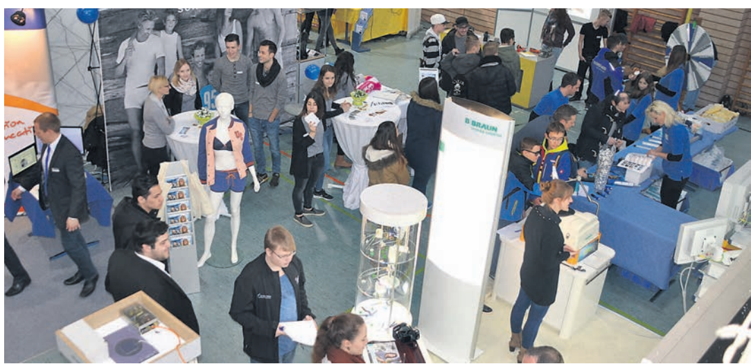
Kompakt, konzentriert, komprimiert - der »Karrieretag« am Stockacher BSZ.

Infos unter www.karrieretag-stockach.de und www.wochenblatt.net .