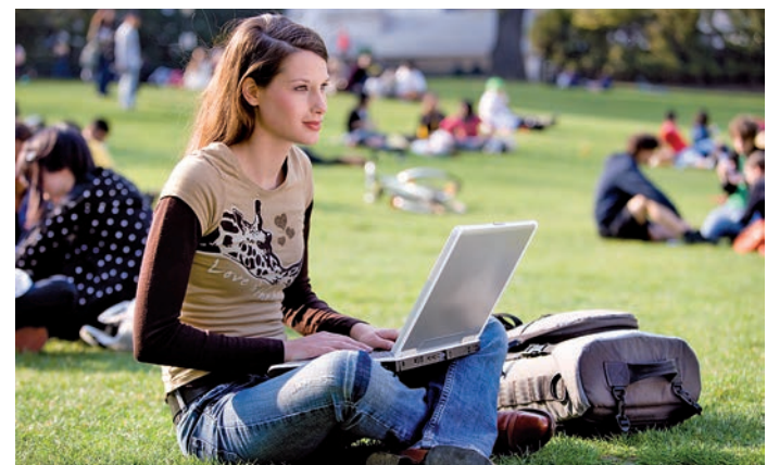
Das WOCHENBLATT sucht kontaktfreudige, leistungsbereite, wissbegierige und freundliche junge Leute zur