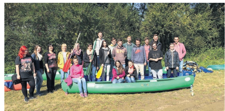
Der Ausflug der Rieker-Auszubildenden und Studenten aus Tuttlingen führte nach Riedlingen. Auf einem Gelände direkt an der Donau wurde die Gruppe in verschiedene Teams aufgeteilt. In Zweier-, Dreier- und Vierer-Kanus wurde dann eine elf Kilometer lange Strecke auf der Donau zurückgelegt.