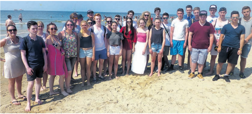
Für Sprache und Landeskunde: Reisen in verschiedene Länder wie die Niederlande.