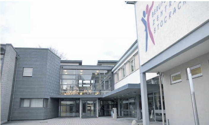
»Karrieretag« ist am BSZ und der benachbarten Kreissporthalle.