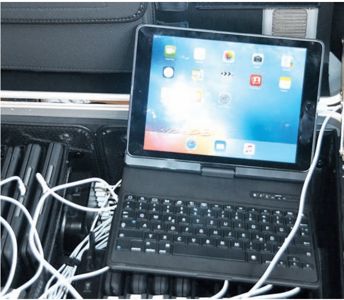
Mehr als Kabel und Module: Computer können auch die schönen Künste fördern. sub-Bild: sw