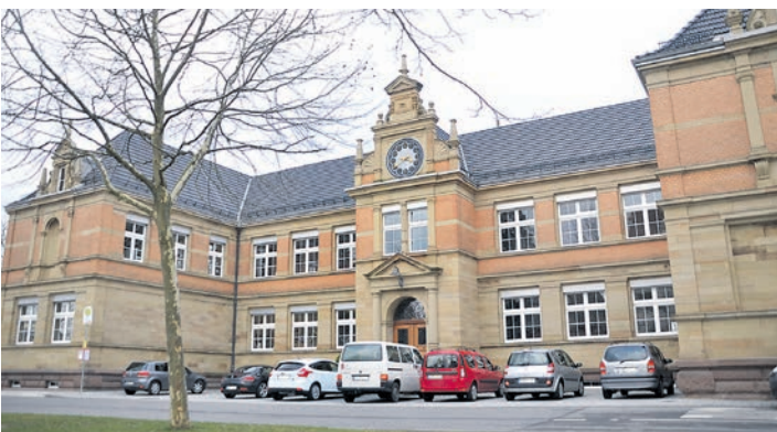
Mehr Infos gibt es in der Mensa bei der Grundschule (unser Foto).

und im Mensagebäude der Grundschule in der Tuttlinger Straße. Im Mensagebäude ist der Extra-Teil für Schüler mit Abitur und Fachhochschulreife. redaktion@wochenblatt.net