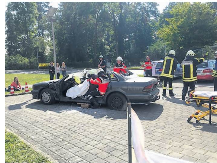
Die Schülermitverantwortung am BSZ ist sehr aktiv. Ihr Sahnestück im letzten Jahr – der Verkehrssicherheitstag.