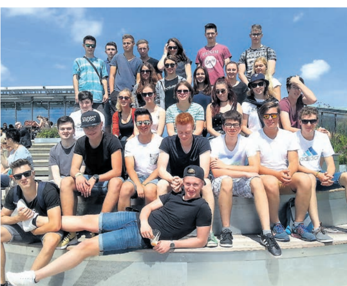
Schulische Exkursionen, etwa in die Niederlande, stehen auf der Agenda des Stockacher BSZ.