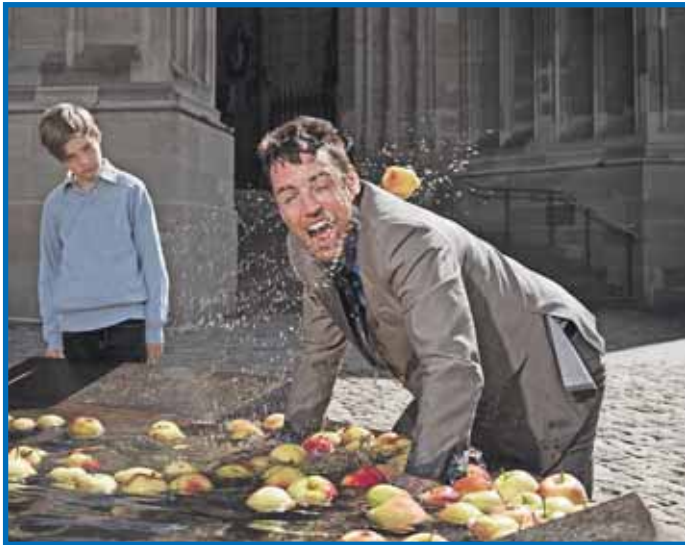
Wilhelm Tell - Großes Freilichttheater auf dem Münsterplatz

In unruhigen Zeiten hilft uns das Theater, eine Heimat zu entdecken und zu schaffen, in der auch das Fremde seinen Platz hat. Nicht weil es die Antworten kennt, sondern weil es seit jeher die Fragen stellt, nach dem, was uns fremd und doch eigen ist, was unsere Ängste beherrscht und sie vielleicht begreifbar macht. Die Spielzeit 2016/2017 präsentiert klassische und moderne Stoffe, außergewöhnliche und junge Regien. Eine Spielzeit mit Musik und Wortgewalt, mit Helden und Verzweifelten, mit Gut und Böse. Auf dem Münsterplatz wird ab 23. Juni der Schweizer Nationalmythos um Wilhelm Tell und den Rütlichschwur als große Freilichtinszenierung in Szene gesetzt.