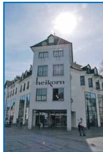
Heikorn Singen – steht für starke Marken und eine Riesenauswahl an Mode.

lerische Mode vom schwedischen Modelabel Dedicated