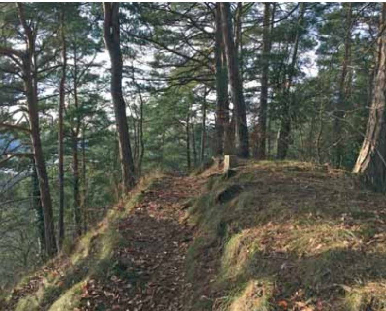
Zahlreiche Wanderwege führen durch die Überlinger Schluchten. Imposante Aussichten entschädigen für den Aufstieg am teils steil abfallenden Überlinger Seeufer.

Der Hödinger Tobel ist eine wildromantische Schlucht, die sich 300 m westlich vom Überlinger Ortsteil Hödingen befindet.