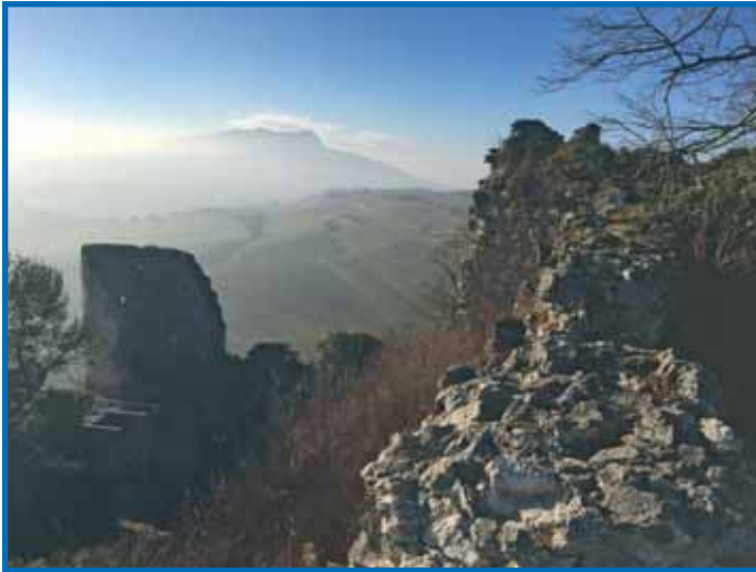
Eindrucksvoller Weitblick übers Land mit dem Hohenstoffeln in der Ferne. Wie von Nebelschwaden umhüllt, entsteht ein fiktives Bild, das den Berg kleiner erscheinen lässt, als er in Wirklichkeit ist.

Die Dreiburgentour ist unglaublich abwechslungsreich und entführt tief in die faszinierende Vulkanwelt des Hegaus. Wer sich auf diese Tour begibt, entdeckt gleich drei Hegauberge auf einmal und fährt im Anschluss bequem mit dem Seehas zurück zum Ausgangspunkt. Mit ihrer Streckenlänge von 21,2 km eignet sich die Tour gut als Tagesausflug.