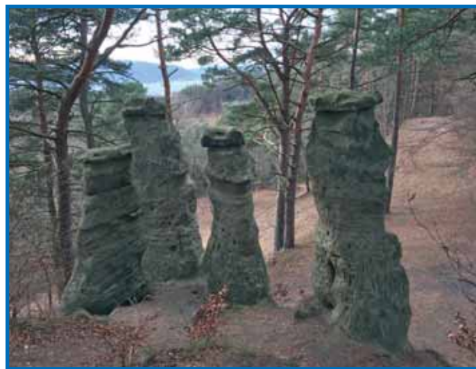
Oberhalb von Sipplingen stehen die fünf bis sieben Meter hohen »Churfürsten vom Bodensee«.