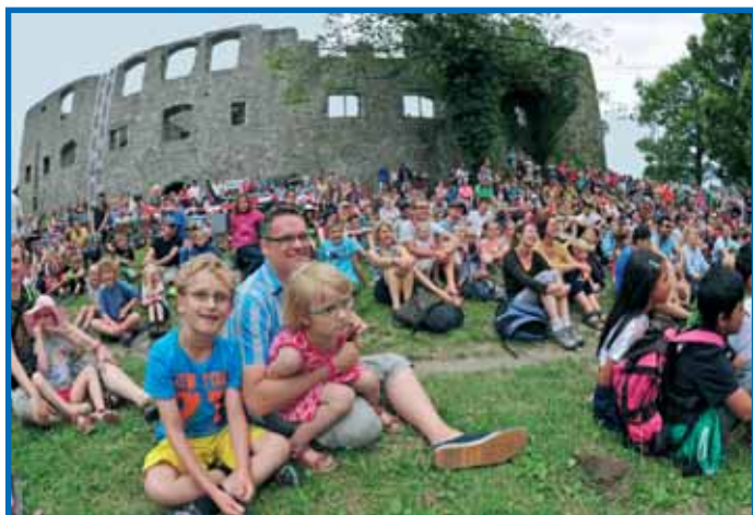
Das Singener Burgfest ist das Ereignis für die ganze Familie.

Vorverkauf fürs Burgfest ab Mai bei der Tourist Information Singen, Stadthalle oder Marktpassage, Tel. 07731/85-262, bei allen anderen Reservix-Vorverkaufsstellen oder im Internet. Bei den Vorverkaufs-Karten ist die An- und Rückfahrt mit Bahn und Bus im Verkehrsverbund Hegau-Boodensee (VHB) inklusive.