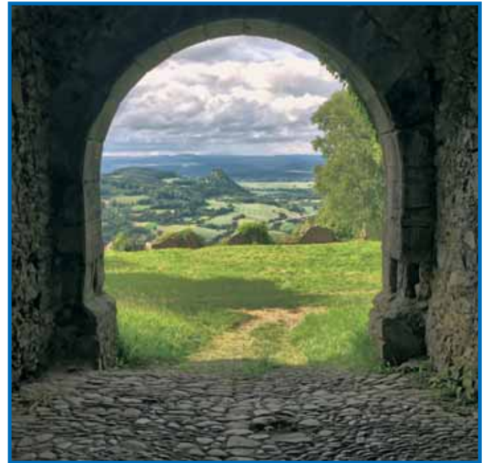
Wolkenstimmung im Hegau mit dem Hohenkrähen in der Ferne. Mystisch, gar wie ein Tor zu einer anderen Welt, wirkt der Blick in die hügelige, grüne Landschaft.

Mehr zu diesem und zu weiteren Premium-Wanderwegen in der kostenlosen App „Wochenblatt to go“. Die App beinhaltet eine Vielzahl an Wandertouren mit unterschiedlichen Schwierigkeitsgraden und Streckenangaben. GPS Navigation und Wegpunkte sorgen zusätzlich für eine leichte Start- und Zielsuche. (Kostenloser Download bei Google Play Store/ App Store). Diana Engelmann