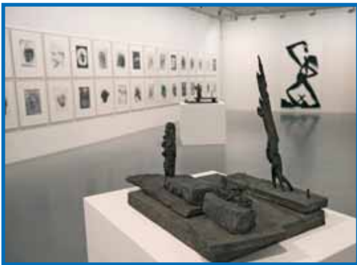
... sowie zeitgenössische Kunst aus der Bodenseeregion.

Ergänzt wird es durch Führungen, spezielle Angebote für Schulen und Kindergärten sowie Museumsworkshops für Kinder, Jugendliche sowie Erwachsene.