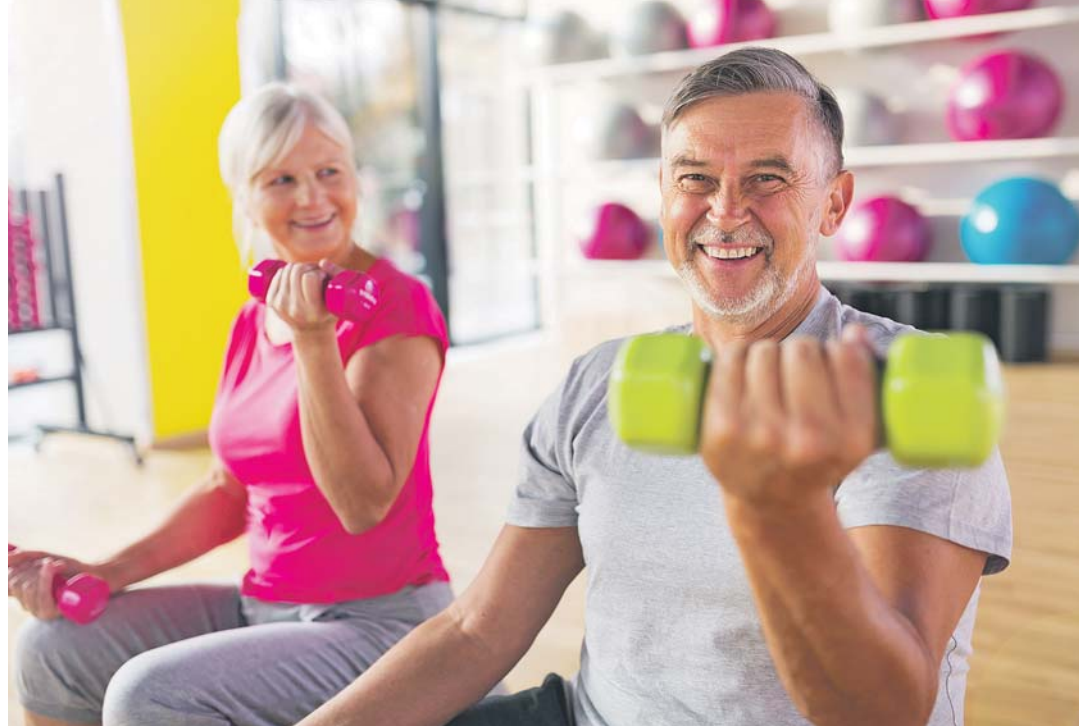
Eine durchgeführte Studie hat gezeigt, dass geistige und körperliche Fitness eine Krankheitsverzögerung von bis zu sieben Jahren bewirken kann.

zen sowie im Rahmen der kognitiven Förderung das Lesen erwiesen. Falls das Augenlicht nicht mehr ausreichend ist, können selbstverständlich auch interessante Hörkassetten einen ähnlichen Effekt beinhalten.