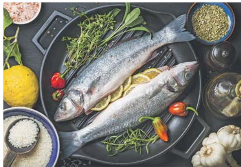
Die mediterrane Kost trägt effektiv zur Demenzprävention bei.

Ganz besonders effektiv haben sich im Rahmen der Bewegung das Tan-