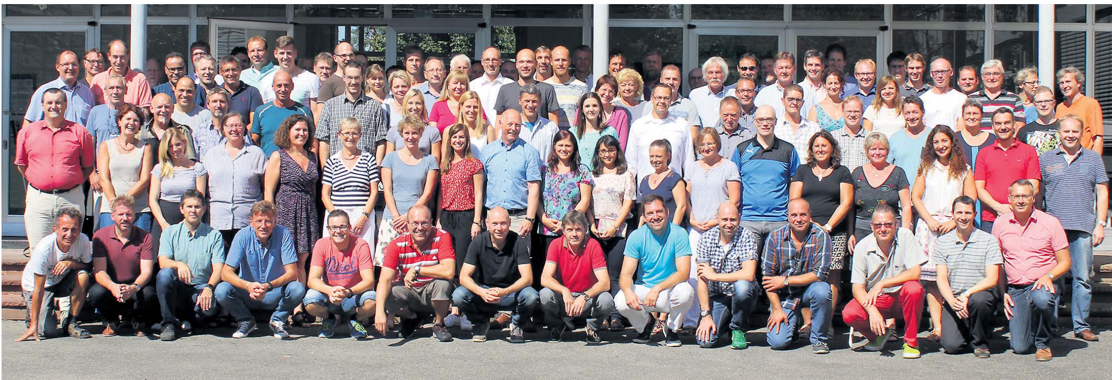
Das Kollegium an der Hohentwiel-Gewerbeschule umfasst 126 Mitarbeiter – davon 110 Lehrer.