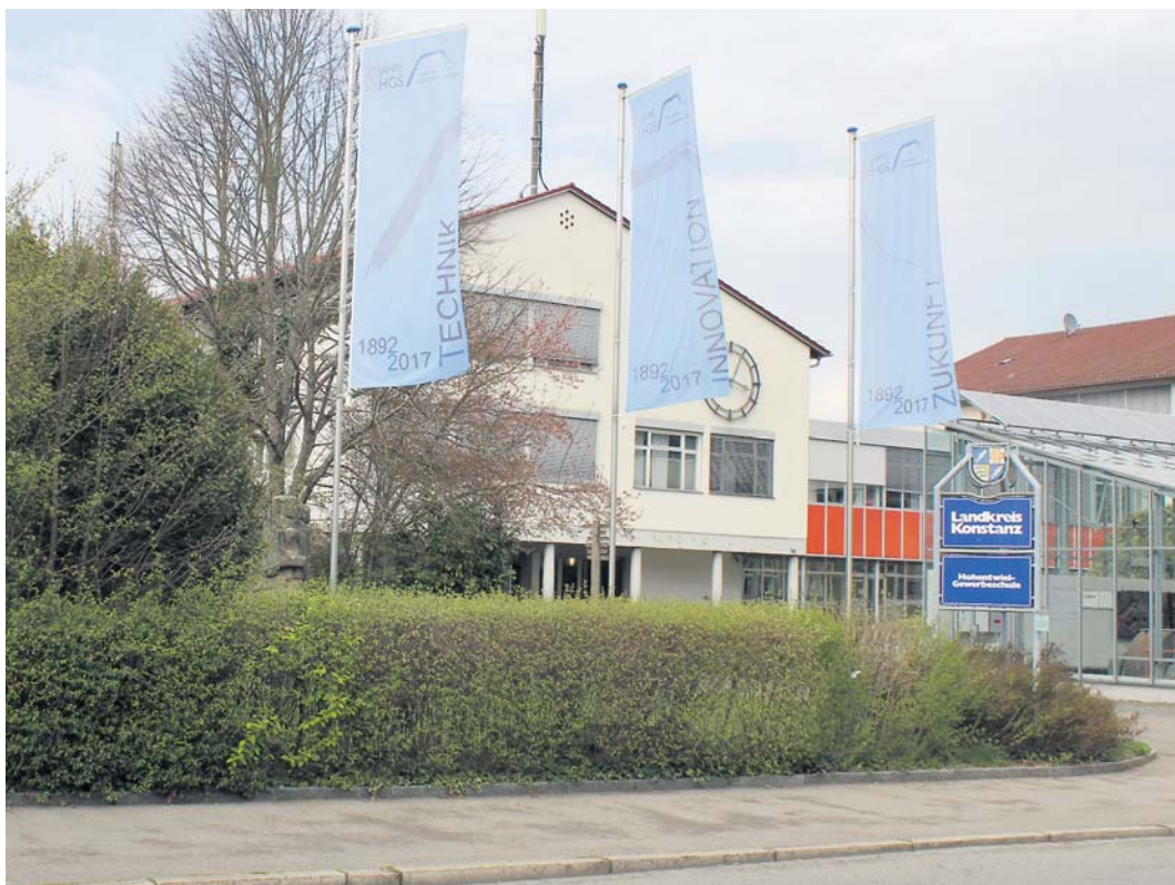
Die Hohentwiel-Gewerbeschule feiert 2017 ihr 125-jähriges Jubiläum. Hierzu lädt sie am 1. Juni alle interessierten Besucher zum »Tag der Technik« ein.