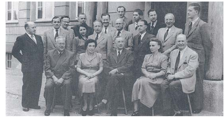
Das Kollegium der Gewerbeschule vor dem Osteingang der Oberrealschule (heute Hegau-Gymnasium) vor dem Umzug in den Neubau 1953.