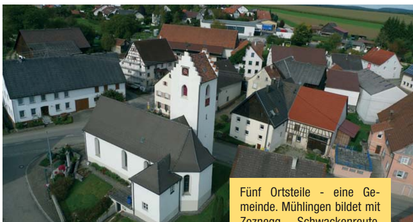
Fünf Ortsteile - eine Gemeinde. Mühlingen bildet mit Zoznegg, Schwackenreute, Mainwangen und Gallmannsweil (unser Foto) sowie der Kerngemeinde ein funktionierendes Gemeinwesen.