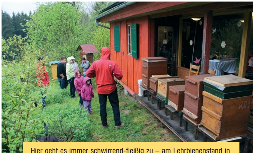
Hier geht es immer schwirrend-fleißig zu – am Lehrbienenstand in Zoznegg.