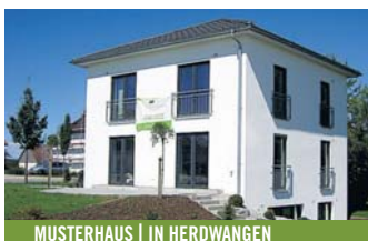
MUSTERHAUS I IN HERDWANGEN

Aufkircher Straße 1a · 88662 Überlingen Fon +49 (0) 7551 308 59 77 · Fax +49 (0) 7551 91 63 08 info@leberer-perfekthaus.de · www.leberer-perfekthaus.de