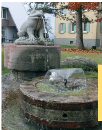
Ein reiches Vereinsleben zeichnet Mühlingen aus. Und das nicht nur zur Fasnet, in der auch die Hobixer aus Mainwangen aktiv sind.