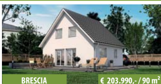
BRESCIA € 203.990,- / 90 m 2

Besuchen Sie uns in unseren Musterhäusern in Herdwangen, Bodenseestraße!