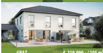
GRAZ € 219.990,- / 105 m 2