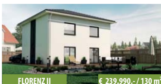
FLORENZ II € 239.990,- / 130 m 2