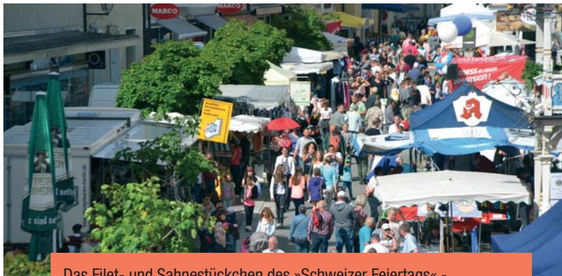
Das Filet- und Sahnestückchen des »Schweizer Feiertags« - das Straßenfest am Samstag.