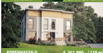
KOPENHAGEN II € 261.990,- / 138 m 2