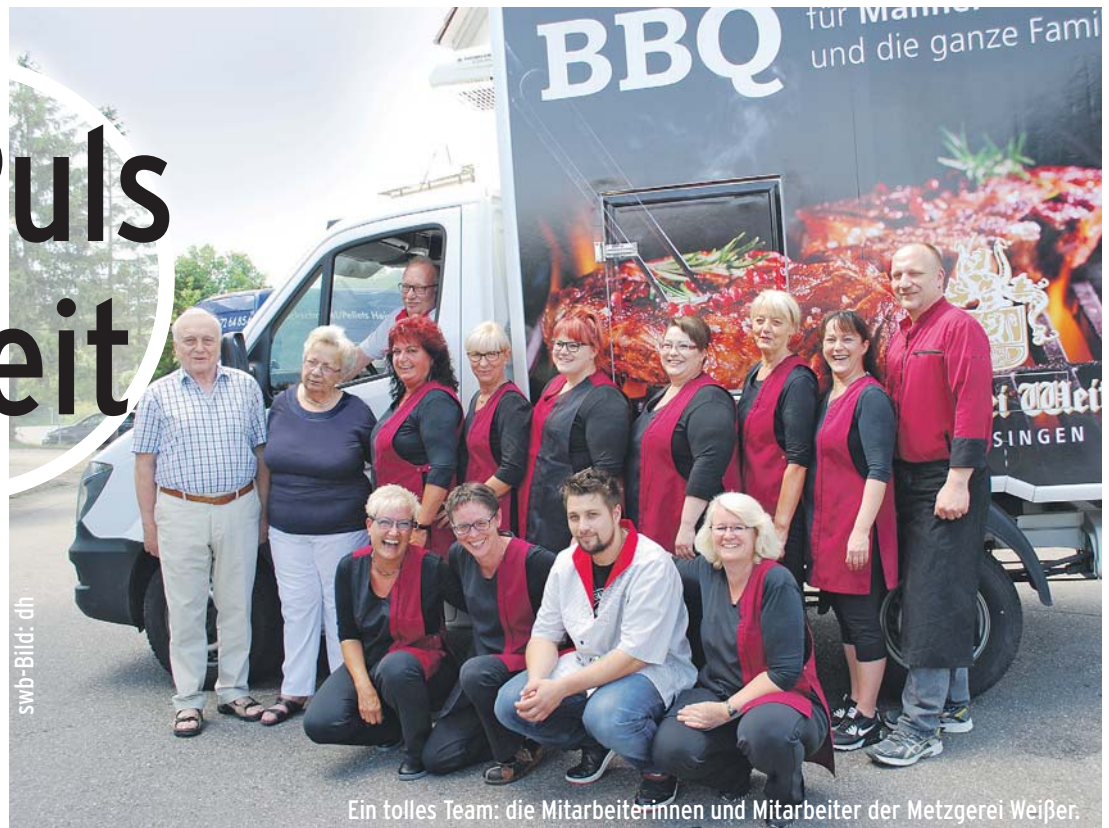
Ein tolles Team: die Mitarbeiterinnen und Mitarbeiter der Metzgerei Weißer.

Qualität wird bei Weißers großgeschrieben, und das schon in der zweiten Generation.