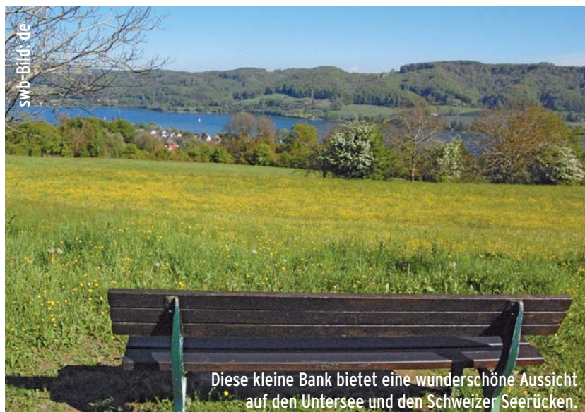
Diese kleine Bank bietet eine wunderschöne Aussicht auf den Untersee und den Schweizer Seerücken.