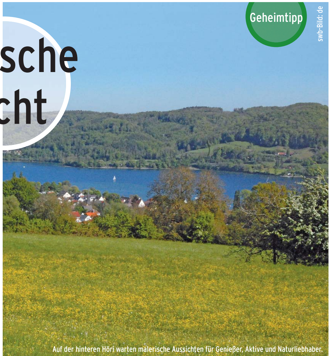
Auf der hinteren Höri warten malerische Aussichten für Genießer, Aktive und Naturliebhaber.

Reichlich Tipps gab es auch von Wochen- blatt-LeserInnen.