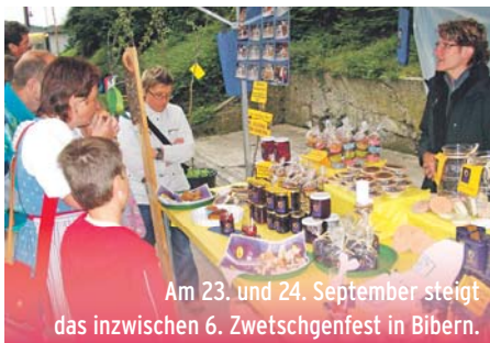
Am 23. und 24. September steigt das inzwischen 6. Zwetschgenfest in Bibern.

Das Dörfchen Biber, nördlich von Thayngen, am gleichnamigen Bach gelegen, hat seiner »Schönen von Bibern« sogar ein Kunstwerk gewidmet. In der Dorfstraße hat Künstler René Eisenegger aus Schaffhausen mit Granit und Blattgold diese Wunderfrucht sehr effektiv in Szene gesetzt.