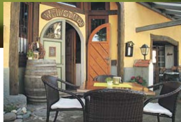
Neben der Weinverköstigung gibt es auch verschiedene Salate, Gerichte vom Grill und aus dem Ofen sowie Vesper- und Käsevariationen.

hier in nostalgischem Ambiente den Feierabend entspannt ausklingen lassen. Öffnungszeiten: Dienstag bis Samstag ab 18 Uhr. Sonntag und Montag Ruhetag. Feiertags geschlossen.