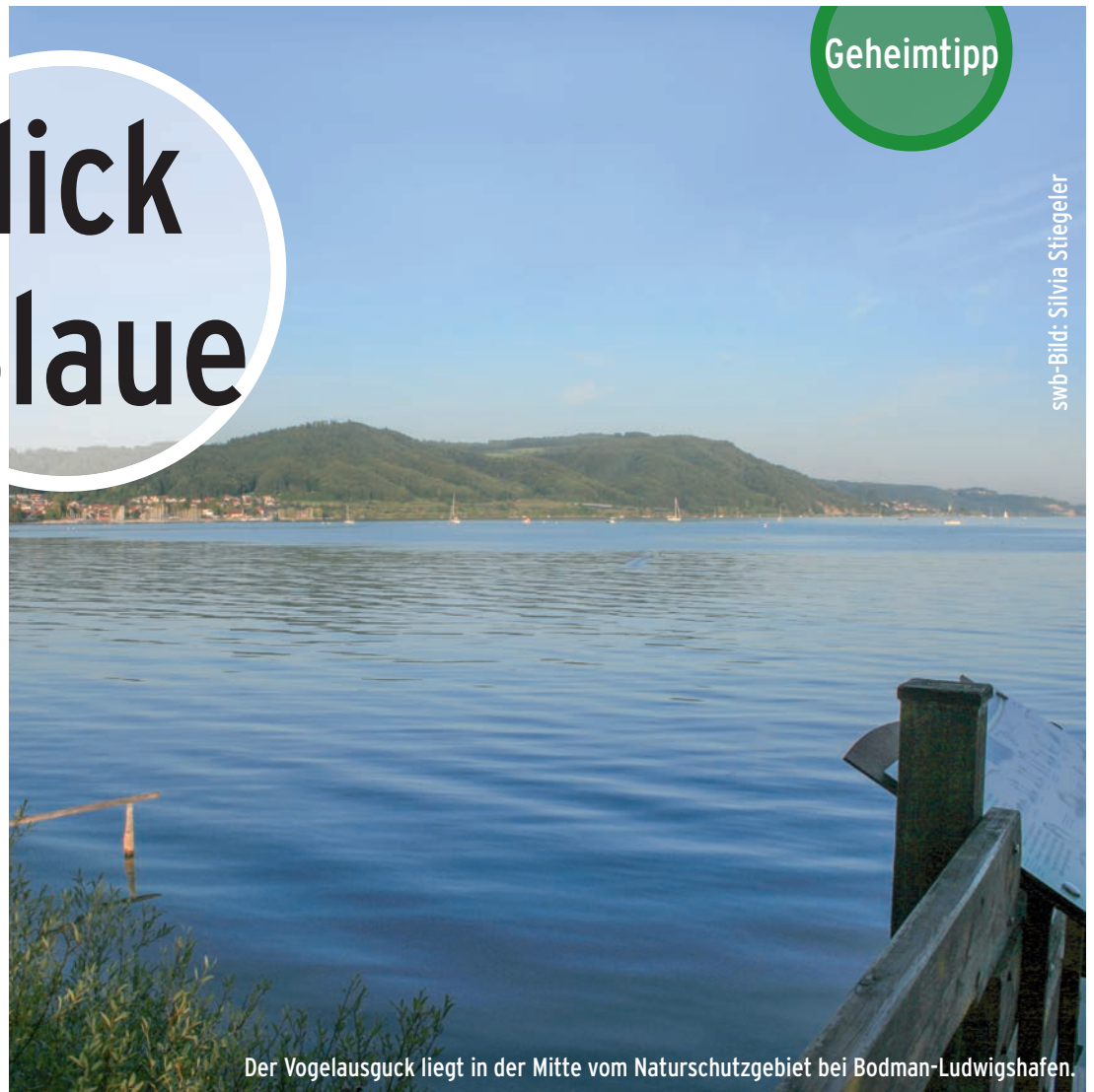
Der Vogelausguck liegt in der Mitte vom Naturschutzgebiet bei Bodman-Ludwigshafen.

Reichlich Tipps gab es auch von Wochen- blatt-LeserInnen.