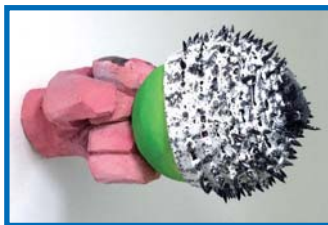
Daniel Wagenblast, handufo 3, 2016, Holz, bemalt, 25 x 10 x 10 cm, © VG Bild-Kunst, Bonn

Zu Beginn des Jahres 2018 werden die neuen Ausstellungen »Eingraben und Aufschichten. Drucke vom Holz.« des Münsteraner Künstlers Andreas