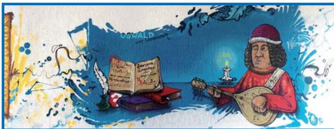
Ausschnitt des Kunstwerks unter der Rheinbrücke. © www.eminhasirci.com

2018 richten sich die Scheinwerfer auf Oswald von Wolkenstein. Der Ritter, Minnesänger, Komponist und Diplomat war quasi der Superstar des Konstanzer Konzils und ist 2018 Schirmherr des »Jahres der Kultur«.