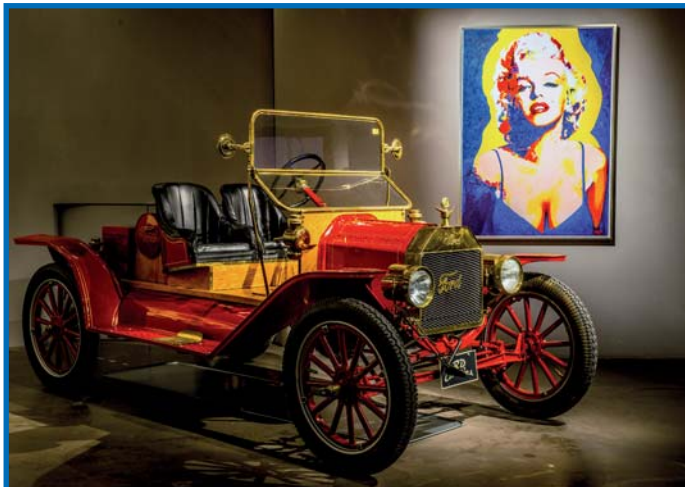
Fahrzeuge und Kunst vereint.