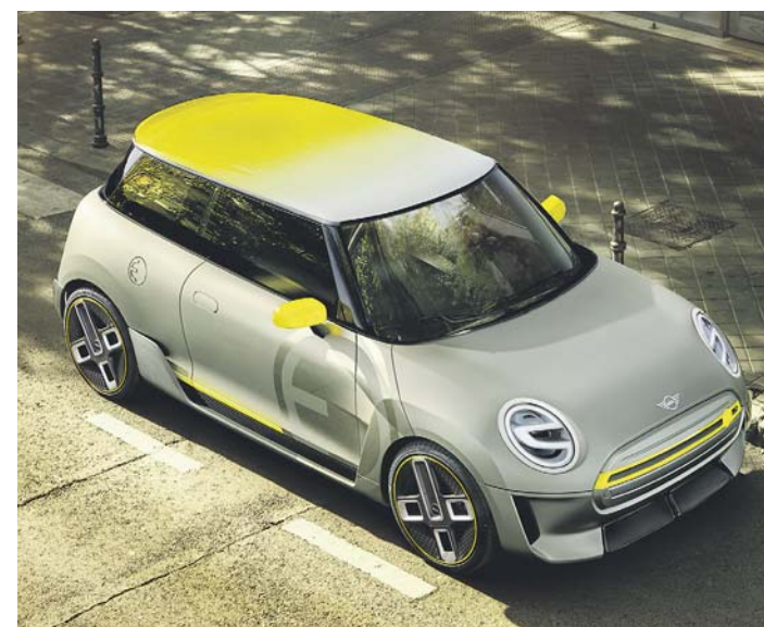
Genauere technische Details gibt es noch nicht für die Mini E, aber das Design das doch irgendwie an den sagenumwobenen DS von Citroen erinnert.

Das Mini Electric Concept soll den markentypischen Stil des Fahrspaßes auf kleiner Grundfläche mit nachhaltiger urbaner Fortbewegung verbinden – und ein bald folgendes Serienmodell einläuten – so die Ankündigung einschließlich Vormodell auf der IAA jüngst in Frankfurt. Der erste in einer Großserie produzierte Mini mit rein elektrischem Antrieb wird 2019 – und damit exakt 60 Jahre nach dem Verkaufsstart des classic Mini – auf die Straße kommen, wurde angekündigt. Der Antrieb des Mini Electric Concept bezieht seine Energie aus einer Lithium-Ionen-Batterie. Das auf der Basis des Mini Dreitürers konzipierte Elektrofahrzeug wird im Werk Oxford/GB vom Band laufen. Sein Antriebsstrang entsteht an den Standorten Dingolfing und Landshut, den Kompetenzzentren für E-Mobilität innerhalb des Produktionsnetzwerks der BMW Group.