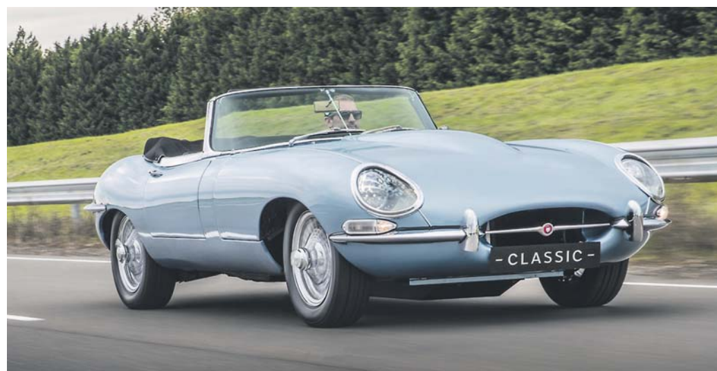
Aus einem Originalen E.Type wurde nun »Zero« geboren, was die Herzen vieler Jaguar-Fans bis an den Hals schlagen lässt.

1 Zwei Jahre Neuwagengarantie des Herstellers sowie Ford Protect Garantie-Schutzbrief (Neuwagenanschlussgarantie) inkl. Ford Assistance Mobilitätsgarantie für das 3.-5. Jahr, bis max. 50.000 km Gesamtlauflistung (Garantiegeber: Ford Werke GmbH) kostenlos. Gültig für Privatkunden beim Kauf eines noch nicht zugelassenen Ford Fiesta Neufahrzeuges innerhalb von drei Wochen nach erfolgter Probefahrt und Vorlage des von uns ausgestellten Original-Gutscheins. Es gelten die jeweils gültigen Garantiebedingungen. 2 Bei Abgabe und zertifizierter Verschrottung Ihres Dieselfahrzeuges bis Euro 4 und älter erhalten Sie bei uns bei Neufahrzeugbestellung eines Ford Fiesta eine Prämie von € 4.000,-. Zulassungsdauer Altfahrzeug mindestens 6 Monate auf den Käufer des Neufahrzeuges. Die Prämie wird auf den Kaufpreis angerechnet. Angebot gilt für Privatkunden und Gewerbekunden (ausgeschlossen sind Großkunden mit Ford Rahmenabkommen sowie gewerbliche Sonderabnehmer wie z.B. Taxi, Fahrschulen, Behörden). 3 Gilt für einen Ford Fiesta Trend 3-Türer 1,1l-Benzinmotor 52 kW (70 PS). Irrtümer vorbehalten. Inkl. Überführungskosten von 645€.