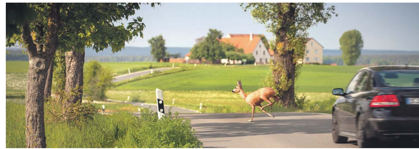
Der Herbst ist von Wetterwechseln geprägt und von Wildwechseln. In beiden Fällen können Überreaktionen den größten Schaden anrichten.