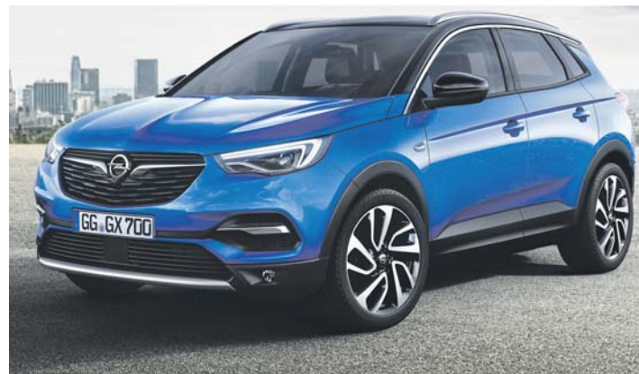
Ein höchst interessanter Neuling ist der aktuelle Opel Grandland, der nach der Premiere auf der IAA nun in den Opel-Autohäusern ankommt.

kehrsschilderererkennung, intelligenter Geschwindigkeitsregler, Berg-Anfahr-Assistent, Radio R 4.0 mit Freisprecheinrichtung via Bluetooth-Schnittstelle, Klimaanlage mit Partikel- und Geruchsfilter, Komfortsitze mit zahlreichen Einstellmöglichkeiten sowie eine 40:60 umklappbare Rücksitzlehne. Infotainment- und Komfort-Features sind Frontkollisionswarner mit automatischer Gefahrenbremsung sowie Fußgängererkennung, Müdigkeitsalarm, automatischer Parkassistent und 360-Grad-Rundum-Kamera.