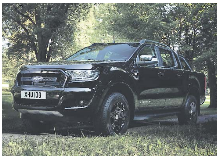
In der »Black Edition« wird der Ford Ranger zum »Schwarzarbeiter«, mit streng limitierter Auflage.

unter anderem das sprachgesteuerte Kommunikations- und Entertainmentssystem Ford SYNC 3 mit hochauflösendem 8-Zoll-Touchscreen, eine Zwei-Zonen-Klimaanlage, Ledersitze sowie elektrisch anklappbare und beheizbare Außenspiegel. Zusätzlich hat die Sonderedition ein Navigationssystem, Parksensoren vorne sowie eine Rückfahrkamera an Bord.