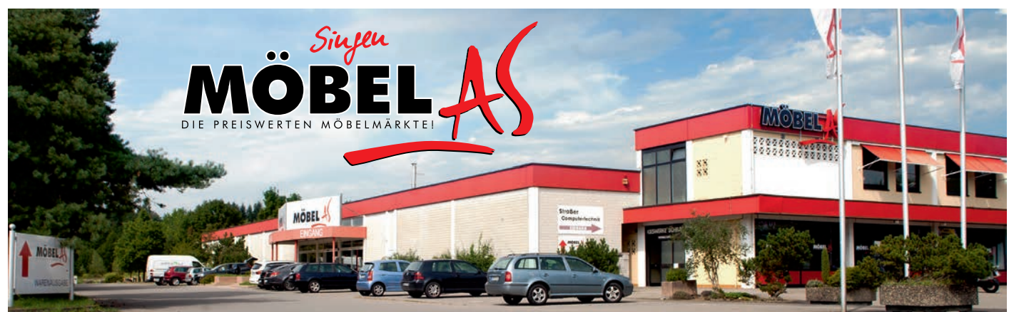
Seit vielen Jahren eine starke Gemeinschaft – 50 Jahre gibt es das EKZ in Singen, ein guter Grund zum Feiern und Möbel AS feiert natürlich mit!

bündelt, enorm günstige Konditionen sind die Folge. So sind wir in der glücklichen Lage, unsere Möbel zu sensationell günstigen Preisen an unsere Kunden weitergeben zu können. Wir genießen den Schutz der Gemeinschaft, unsere Kunden die günstigen Preise: Eine Win-Win-Situation für alle!