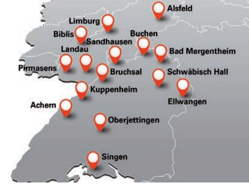
Möbel AS – einer der führenden Möbel-Discounters im Südwesten Deutschlands!

allen Wohnbereichen zu äußerst günstigen Preisen. Mit diesem Konzept sind wir seit Jahren erfolgreich und expandieren seit unserer Firmengründung.