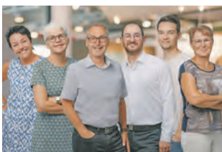
Das Küchenhaus Schwarz-Team

Küchenhaus Schwarz: Rundgang durch Musterküchen