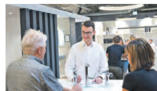
Professionelle Beratung und das Eingehen auf den Kunden haben bei uns oberste Priorität.

Bei FX Ruch in der Industriestr. 11 bis 15 in Singen erhalten die Besucher im Rahmen der Leistungsschau