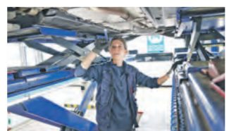
Prüferin bei der Arbeit.

Bei der Leistungsschau können die Besucher erfahren, was der TÜV SÜD in der Laubwaldstr. 11 in Singen alles bietet. Über die Fahrzeugprüfung hinaus berät der TÜV SÜD, was rund um das Auto, Motorrad, E-Bike, ... wichtig sein könnte. Unfallschaden, ein leichter Kratzer am Frontspoiler? Meist ist mehr defekt, als man sieht. Optimale Schadensabwicklung, die passende Werkstatt, womöglich Fachanwalt: Der TÜV bietet jedem eine kostenlose Beratung – neutral und unabhängig – an. Tuningfans und Oldtimerbesitzer bekommen an diesem Tag Tipps von den Fachleuten zu korrekten Umbauten oder zum Wertgutachten. Zu bestaunen sind auch Tuning- und Oldtimerfahrzeuge. Und beim Gewinnspiel »Schätze den Schaden« kann man am realen Objekt seine Kenntnisse testen. Text: © Werner Leber, Wochenblatt QR-Code scannen und direkt zu TÜV SÜD: