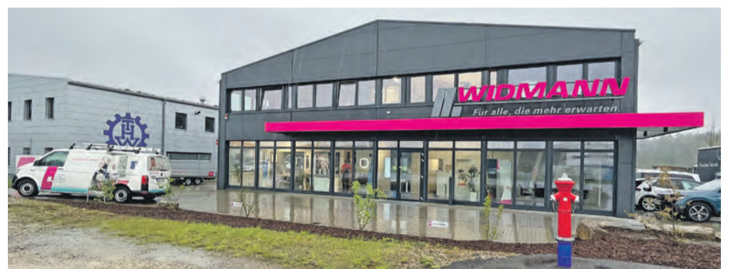
Die Firma WIDMANN in der Marie-Curie-Straße 15.

Wir öffnen die Türen und zeigen unsere Herzstücke – die Abteilungen Sanitär, Heizung, Blechnerei und der Kundendienst laden die Besucher ein, uns, unsere Arbeit und die Prozesse und unsere Handwerks-Power ein wenig näher kennenzulernen. Zusätzlich werden an diesem Tag die Firma Viessmann und die Firma KWB, die führenden Hersteller von Wärmepumpen und Holzheizungen, mit ihren Ausstellungsstücken vertreten sein. Auch gibt es an diesem Tag in der Ausstellung Sonderpreise und einen Abverkauf von Ausstellungs-möbeln, eine Verlosung mit hochwertigen Preisen von Hansgrohe wie zum Beispiel ein Hansgrohe