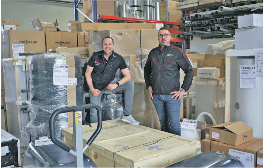
Im Lager von Widmann – als kleiner Blick hinter die Kulissen.