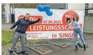
Das Team heißt Sie herzlich willkommen.

Besucher der Thüga Energie und Thüga Energienetze können in der Industriestraße 9 durch eine VR-Brille in die Energiegewinnung eintauchen oder den eigenen Körper mit