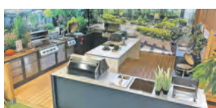
Outdoorküchen bei Grillfürst in Singen.

Die Leistungsschau ist ein moderiertes Event im Grillfürst Store Bodensee in der Georg-Fischer-Str. 17 . Der Tag steht im Zeichen der Kooperation mit der Feuerwehr Singen. Neben Brand-