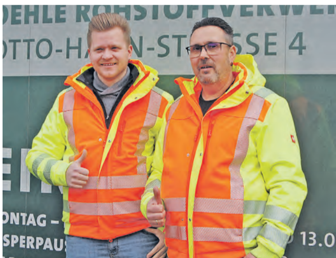
Die Firma Oehle präsentiert sich an der Leistungsschau nicht im eigenen Betriebsgelände, sondern bei der Widmann GmbH in der Marie-Curie-Straße.

Pro Monat verarbeitet das Oehle-Team rund 3.000 Tonnen unterschiedlichster Abfälle wie z. B. aus dem Rückbau von Häusern, von Industriebauten, Produktionsabfälle, Eisenschrott aus Wertstoffhöfen und Restmüll in Containern.