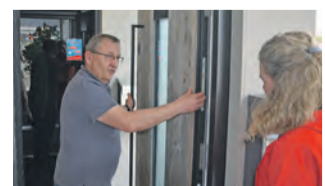
Fachberater unterstützen Bauherren und Renovierer bei der Ausstattung ihrer Häuser.

Lagerware hochwertiger Produkte. Der Mitnahmemarkt ist besonders interessant für Bauherren, Architekten und Renovierer. Der Haus-Ausstatter bietet Restposten von Bodenbelägen, Türen, Toren und Fenstern an. Das Besondere: Wer die Maße der Produkte für sein Haus-Projekt kennt, kann die Angebote der Sonderausstellung am Sonntag zu Leistungsschau-Preisen erwerben. Die Schelle-Fachberater nehmen sich Zeit für Beratung und Verkauf in dekorierten Ausstellungsbereichen. Bei Getränken und Snacks wird die Beratung über die zahlreichen Möglichkeiten der Haus-Ausstattung zum Wohlfühlerlebnis. Familie Schelle und das Team freuen sich auf viele Besucherinnen und Besucher. Text: © Ina Kletz, Wochenblatt QR-Code scannen – und Firma Schelle besuchen: