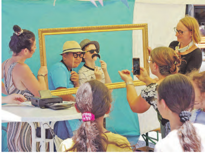
Die Zukunft der Innenstadt ist die eines sozialen Herzens. Im Bild eine Aktion des „Bewegten Sommers“ vom letzten Sommer in Singen. Die Aktion im Singener Süden am kommenden Sonntag zielt in die selbe Richtung - sich ganz persönlich vorzustellen.