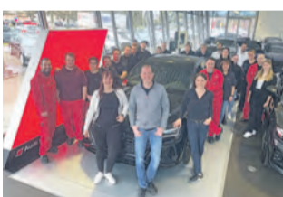
Team Audi Zentrum Singen

Die Besucher der Leistungsschau erfahren viel über Ausbildung und Perspektiven in der Graf-Hardenberg-Gruppe am Singener Standort in der