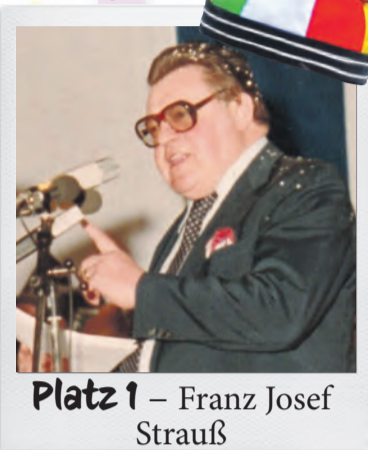
Franz Josef Strauß musste sich 1979 vor den Stockacher Narren verantworten und ist bis heute in Erinnerung geblieben.