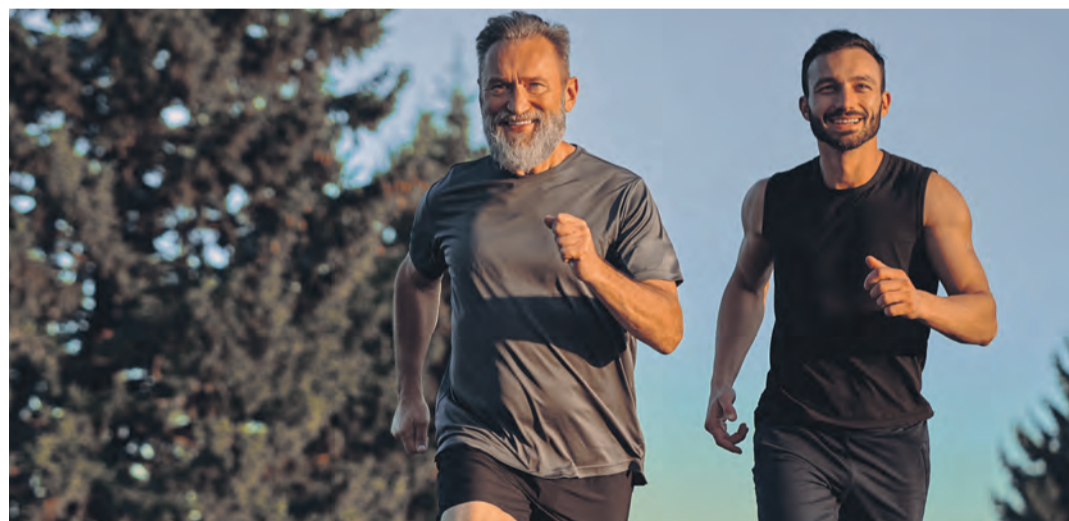
Endlich frei sein von Brille: eine ganz neue Lebensqualität

Was genau ist der Unterschied zwischen Multifokal- und Isofokallinsen? Mit beiden kann man in der Ferne und in der Nähe scharf sehen. Der Unterschied: Multifokallinsen haben zwei fixe Brennpunkte, d.h. man muss z.B. beim Lesen immer einen