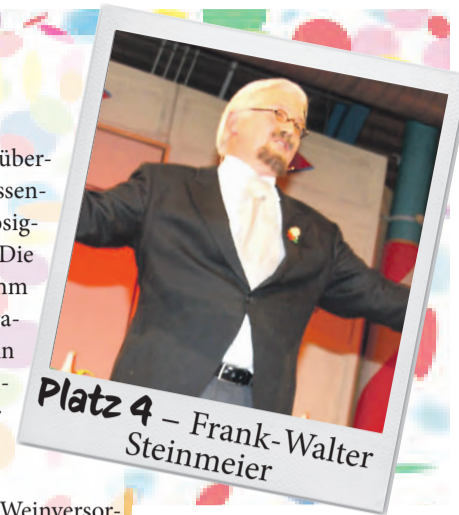
Als Friedrich Engels verkleidet versuchte Frank-Walter Steinmeier 2011, das Narrengericht von seiner Unschuld zu überzeugen.