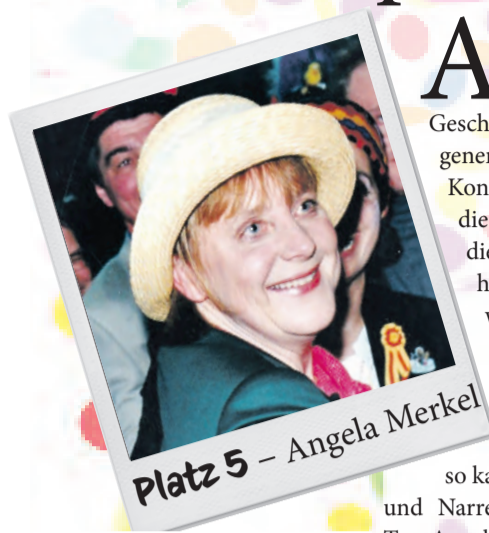
Angela Merkel stand 2001 vor dem Narrengericht.

Als das WOCHENBLATT seine Leser nach Bildern und Geschichten aus den vergangenen 50 Jahren Landkreis Konstanz fragte, waren es die Narren aus Stockach, die als erstes den Finger hoben. Überraschend war das nicht, blickt doch das Stockacher Narrengericht selbst auf eine illustre Geschichte zurück. Und so kamen WOCHENBLATT und Narren zusammen, um die Top-Angeklagten zu krönen.