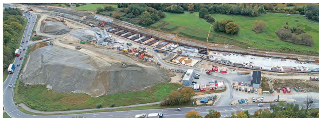
Der Ausbau der B33 und auch der Gäubahn muss schneller gehen, sagt Andreas Jung. An der Bundesstraße wird bereits seit Jahren gearbeitet.