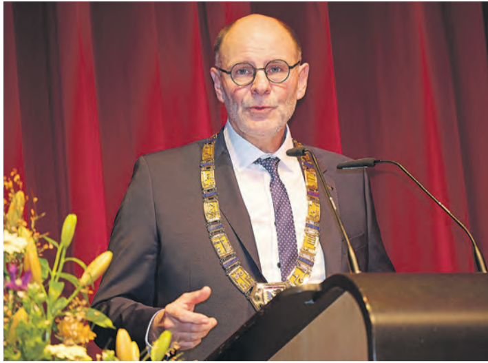
Singens Oberbürgermeister Bernd Häusler beim Neujahrsempfang 2024.

Die Liste von Oberbürgermeister (OB) Bernd Häusler für eine gute Zukunft im Jahr 2030 ist lang: Eine weiterhin ausreichende Zahl an Arbeitsplätzen. Mehr Menschen, die zu Fuß oder mit dem Fahrrad unterwegs sind. Eine regenerative Nahwärmeverorgung in mehreren Stadtgebieten. Eine klare Perspektive zur Umsetzung von Wasserstoff als Energieträger für die Industrie. Dass Singen weiterhin eine attraktive Einkaufsstadt ist. Und ausreichenden und bezahlbaren Wohnraum für die Menschen. Viele Themen, zu viele, um sie in dem einstündigen Gespräch mit dem WOCHENBLATT komplett zu vertiefen. Und doch genug, um in einige Entwicklungsbereiche der Stadt Singen einzutauchen.