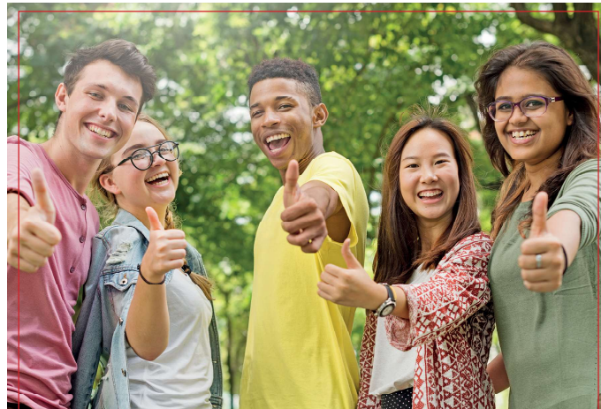
Im Team etwas für die Gesellschaft tun und dabei gemeinsam wachsen ist eines der Ziele eines FSJ.

Meine Arbeitsschwerpunkte sind die Verlässliche Grundschule, die Offene Jugendarbeit, die Unterrichtsbegleitung, die Ferienbetreuung, die Hausaufgabenbetreuung und verschiedene Gruppenangebote. Weitere Pflichten zur Anerkennung meines FSJ sind das regelmäßige Teilnehmen an Bildungen und Seminarwochen. Jeder Bildungstag und jede Seminarwoche bringt ein neues Thema mit sich, um persönliche Fähigkeiten weiterzuentwickeln. In der ersten Seminarwoche ging es viel um das gegenseitige Kennenlernen und gemeinsame Spaßhaben. Hier waren wir im Impulshaus in En-