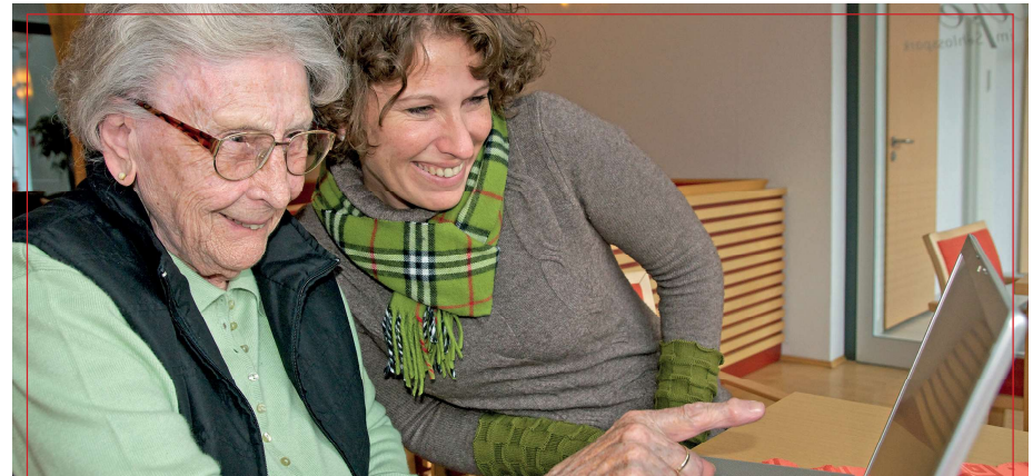
Alltägliche Aufgaben gemeinsam zu übernehmen und somit ein erfülltes Leben zu haben ist eine der Aufgaben der Seniorenassistenz.