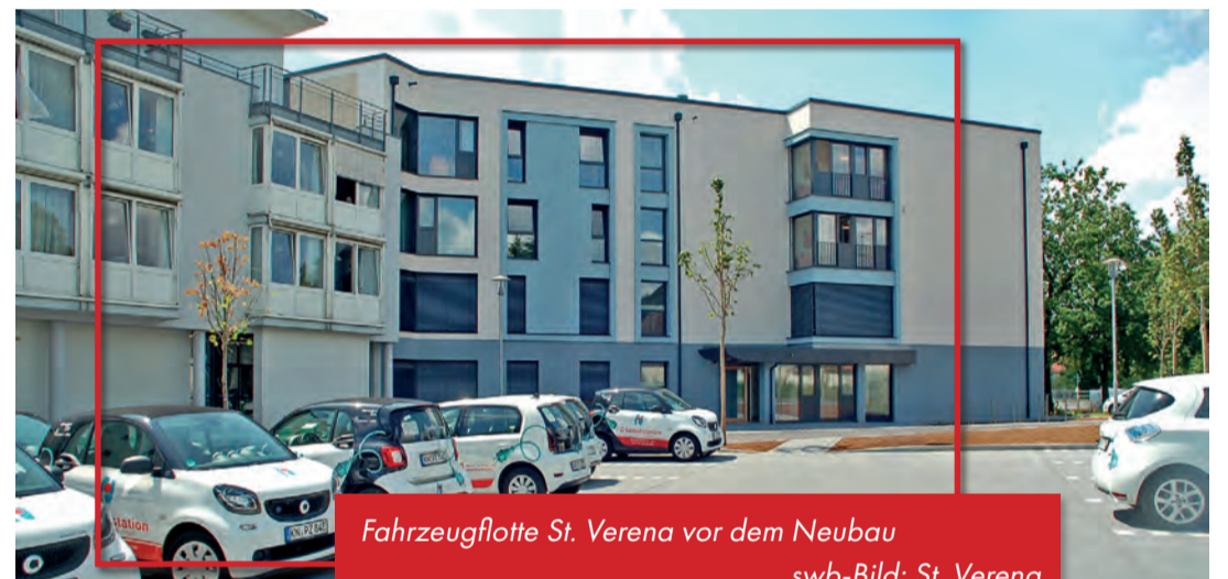
Fahrzeugflotte St. Verena vor dem Neubau