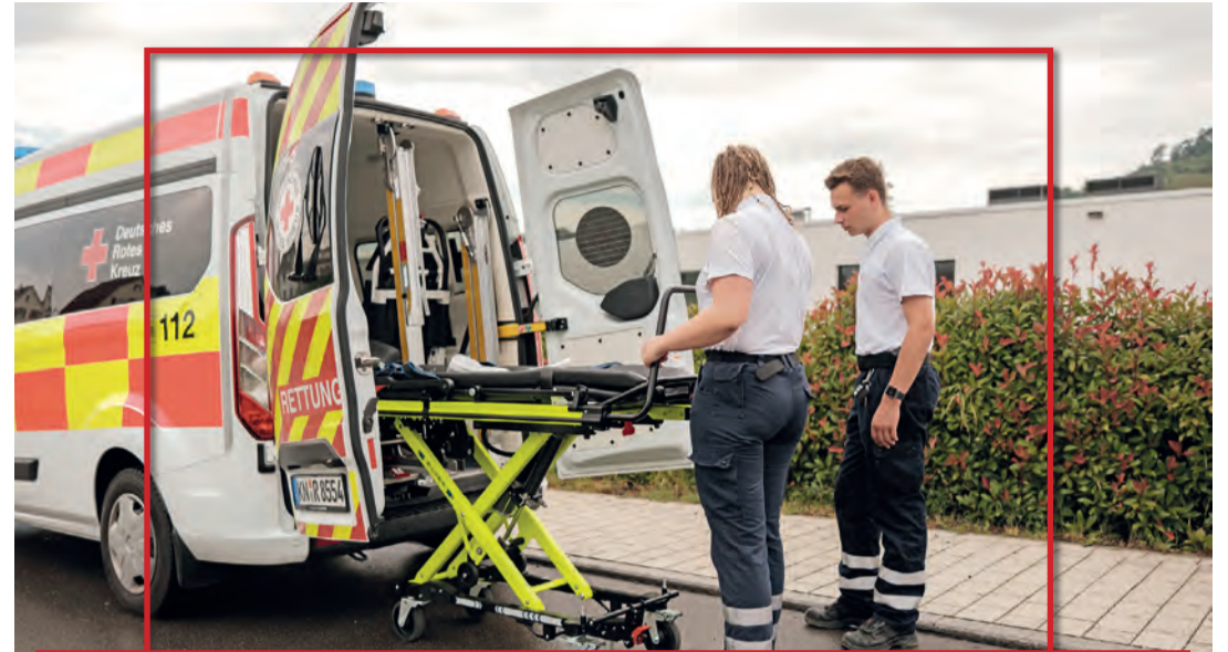
Die Vorbereitungen für den Krankentransport, um Patientinnen und Patienten sicher in Kliniken, Reha-Einrichtungen oder Praxen zu bringen, gehört zu einen der Aufgaben im FSJ.

Im Krankentransport ist kein Tag wie der andere – doch alle Einsätze haben eines gemeinsam: den direkten Kontakt zu