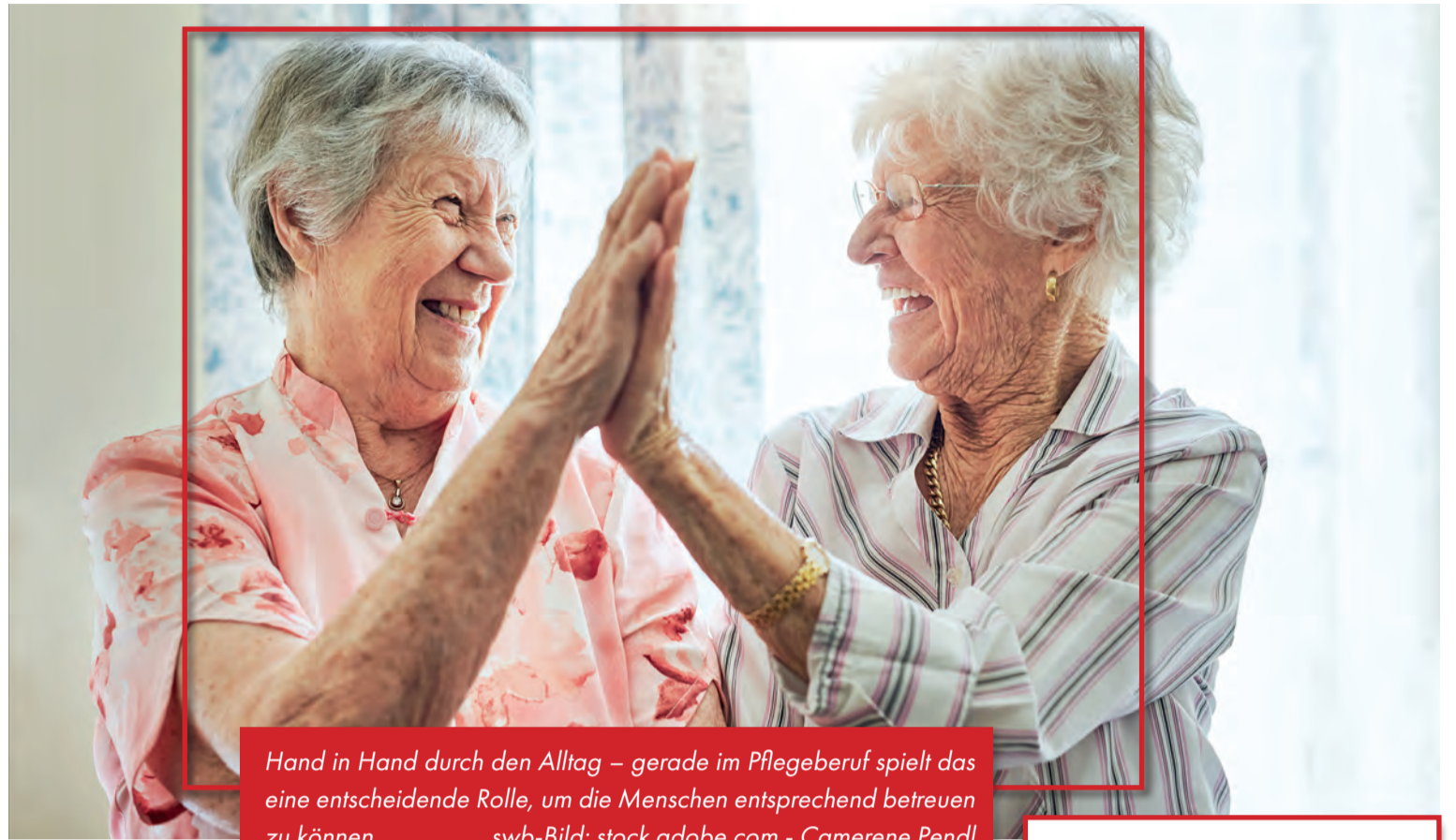
Hand in Hand durch den Alltag – gerade im Pflegeberuf spielt das eine entscheidende Rolle, um die Menschen entsprechend betreuen zu können.

Pflege bedeutet weit mehr als medizinisches Fachwissen. Sie fordert Einfühlungsvermögen, Geduld und die Bereitschaft, sich immer wieder neu auf Menschen einzulassen. Kein Tag gleicht dem anderen, kein Mensch ist wie der nächste. In diesem Beruf wächst man mit jeder Begegnung, lernt aus jeder Situation und entdeckt immer wieder neue Facetten des Lebens – auch die eigenen. Besonders bewegend sind die leisen Momente: Ein Händedruck, wenn Worte fehlen. Ein Lächeln, das Schmerzen für einen Augenblick vergessen lässt. Ein gemeinsames Schweigen am Bett eines Sterbenden. Diese Augenblicke sind es, die den