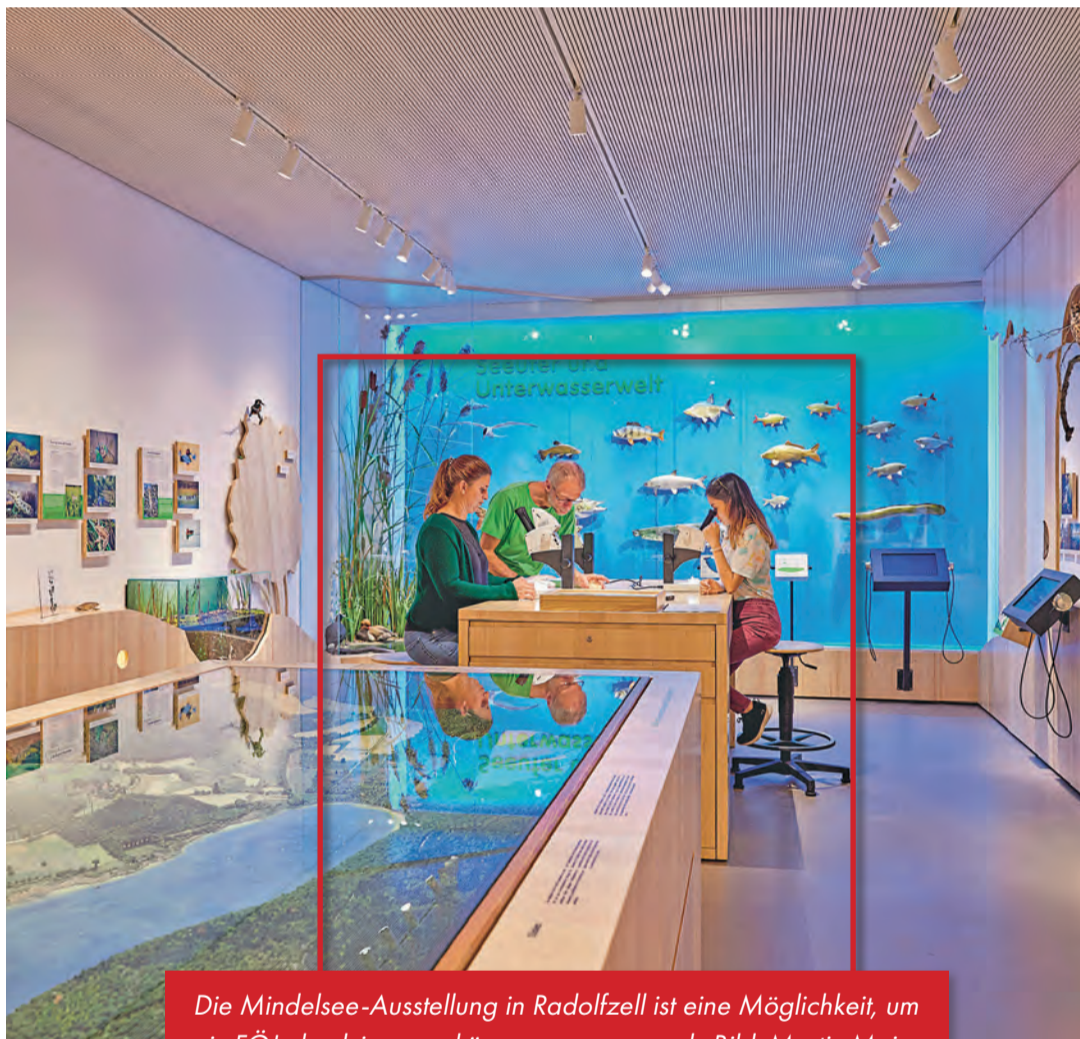
Die Mindelsee-Ausstellung in Radolfzell ist eine Möglichkeit, um ein FÖJ absolvieren zu können.

Der Umweltverband sucht ab Juli (BFD) und September (FÖJ) neue Leute. Lena und Henrike, die derzeit diesen Dienst ausüben, betreuen die Gäste der Mindelsee-Ausstellung. Sie geben nach fachlicher Einweisung Tipps zum Umweltschutz in Haus und Garten, lernen viel über Veranstaltungsorganisation und Öffentlichkeitsarbeit. Und sie sind immer mal