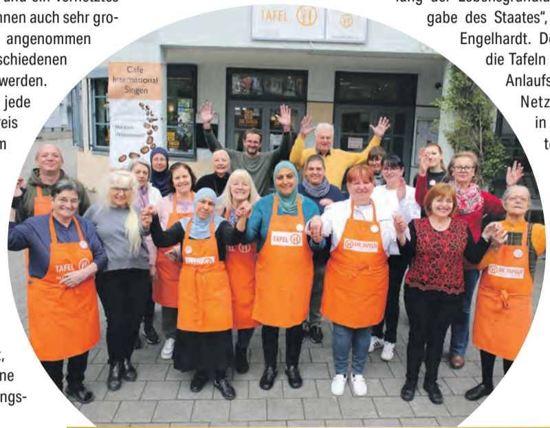
Zusammenhalt, der trägt – das spielt insbesondere bei der Arbeit der Tafeln im Landkreis Konstanz eine entscheidende Rolle.

Regelungen wie Einlasssysteme oder Einkaufsbegrenzungen sollen Fairness und Transparenz gewährleisten. Gleichzeitig wird auf eine respektvolle und wertschätzende Kommunikation geachtet. Konflikte werden nicht in den Ausgabestellen ausgetragen, sondern intern und strukturiert bearbeitet. Auf diese Weise entstand im Laufe der Jahre eine gemeinsame Konfliktkultur, die für einen ruhigen und geordneten Ablauf sorgt.