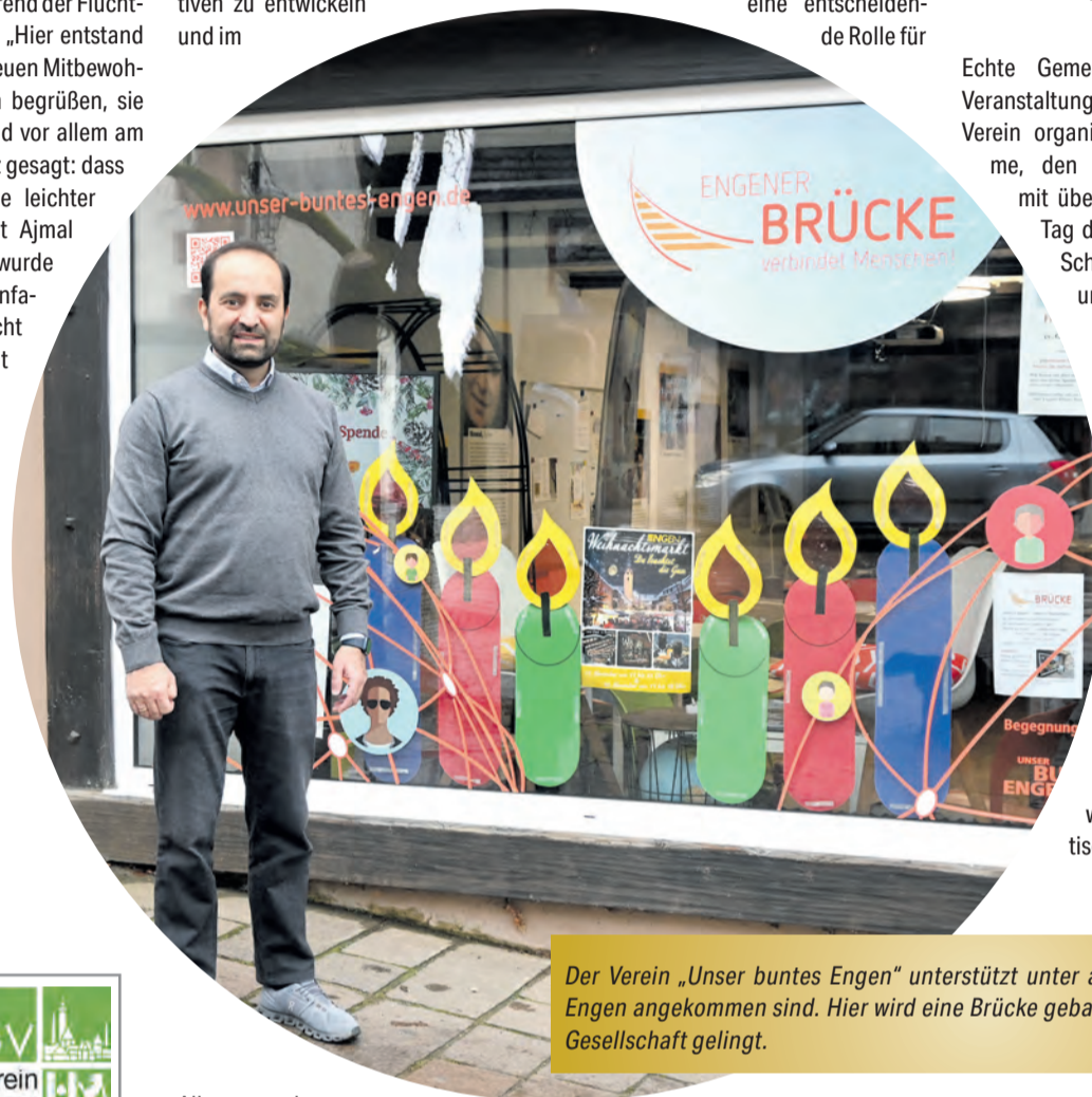
Der Verein „Unser buntes Engen“ unterstützt unter anderem Menschen, die neu in Engen angekommen sind. Hier wird eine Brücke gebaut, damit das Ankommen in der Gesellschaft gelingt.